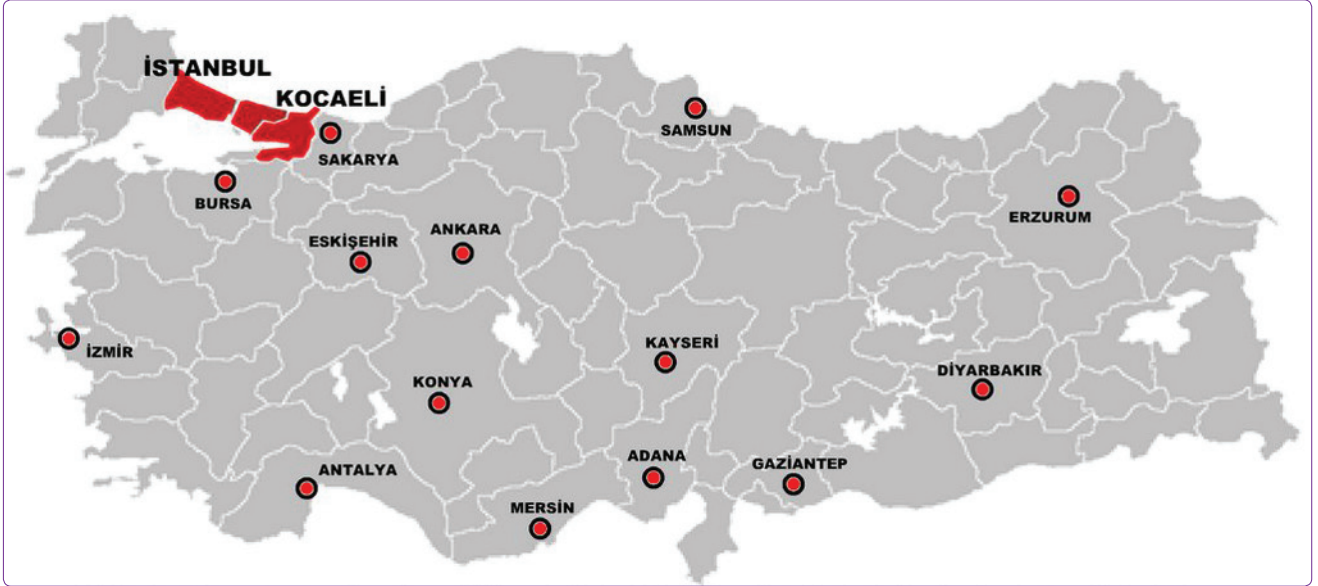
Şekil 1. Ülkemizde büyükşehir statüsüne sahip kentler (23.07.2004 tarihinde yürürlüğe giren 5216 sayılı yasaya göre İstanbul ve Kocaeli ilinde, büyükşehir belediye sınırı, İl mülki sınırdır).

rece önemli bir katkı sağlamıştır. Büyükşehirlerin kuruluşu, büyükşehir statüsüne sahip kentlerin sınırlarının belirlenmesi ve planlama açısından 3030 sayılı yasaya göre daha somut ve anlaşılır ölçütlerin ortaya konduğu 5216 sayılı yasa ise ülkemizde büyükşehir yönetimine ilişkin bir diğer önemli yapı taşıdır. Son 6 yıl içerisinde büyükşehir yönetimine ilişkin kuramsal ve uygulama içerikli birçok çalışmanın da konusunu oluşturan 5216 sayılı Yasa, sürecin özellikle kent planlama boyutuna yönelik önemli değişiklikler getirmiştir. Bu çerçevede, çalışmanın çıkış noktasını oluşturan “büyükşehirlerin sınırlarının belirlenmesine” ilişkin hükümler yanında, büyükşehir belediyelerinin kurulmasına ilişkin