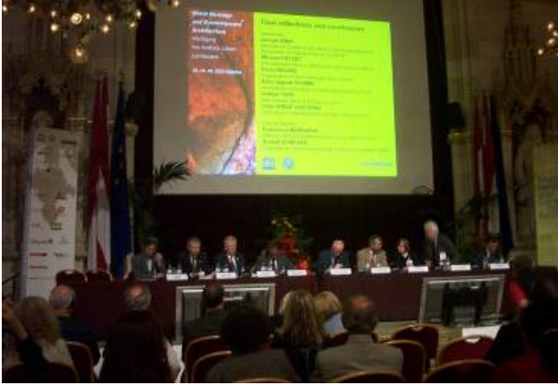
Resim 9: Konferansın kapanış oturumu

Bazı tasarımcılar, kültür mirasını tasarım yaparken başa çıkılması gereken zorluklardan biri olarak görseler de, Rafael Moneo, Hans Hollein, Arata Isozaki gibi başarılı tasarımcılar, kültür mirasını göz önüne alarak tasarım yapmaya çalışmanın bir itici güç olduğundan bahsetmektedir.