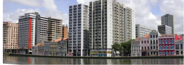
Resim 1: Brezilya'da Recife kenti'ndeki yüksek yapıların tarihi kent dokusu ile ilişkisi (Silvio Mendes ZANCHETI, World Heritage Conference 2005)

çözümlerin aranması gerektiğini bir kere daha gösterdi. Ayrıca, seçilen alan çalışmaları Dünya Kültür Mirası Komitesi'nin vurgulamaya çalıştığı konuların önemini ve yerindeliğini de destekler nitelikteydi.