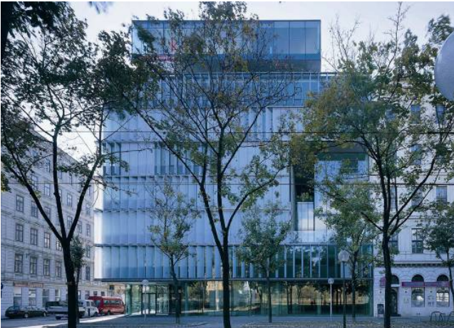
Resim 4: K47 Ofis Binası'nın dış cephesi