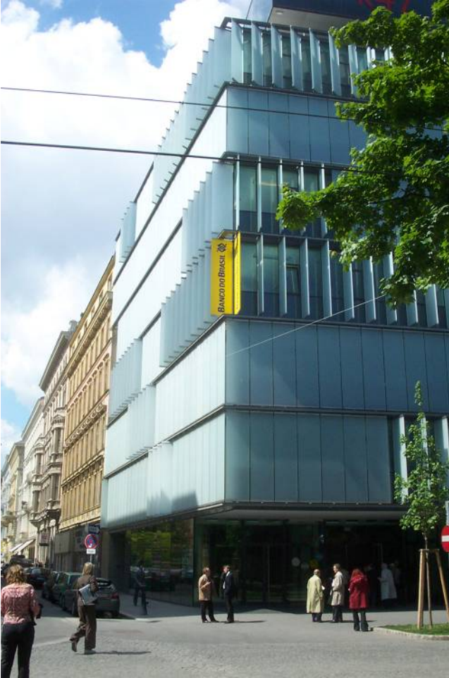
Resim 3: K47 Ofis Binası'nın tarihi kent dokusu ile bütünleşmesi © Emrah TÜRKYILMAZ