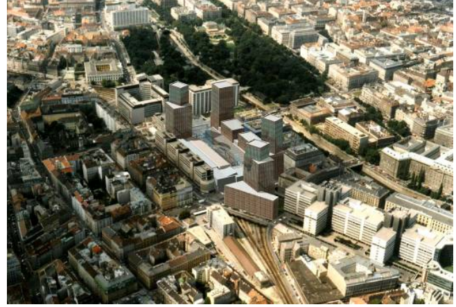
Resim 7: Eleştirilen Wien Mitte Projesi (Arnold KLOTZ, World Heritage Conference 2005)

Wien Mitte Projesi, Viyana'nın tarihi kent merkezinden yaklaşık 300 metre ve St. Stephen Katedrali'nden 800 metre ötede konumlanan ve dört gökdelenin meydana gelen bir projedir. Viyana'nın 2001 yılında Dünya Kültür Mirası Listesi'ne alınmasından hemen sonra, Wien Mitte adı verilen bölgede üç adet 87 metrelik ve bir adet 97 metrelik gökdelenin inşasına izin veren bir proje şehir konseyi ve belediye tarafından kabul edildi. Bu gelişme üzerine Dünya Kültür Mirası Komitesi konuyla ilgili endişesini bildirmesine rağmen, birinci gökdelen zaten inşa edilmişti. Diğer gökdelenler, Dünya Kültür Mirası Komitesi'nin endişesi yüzünden mi yoksa ekonomik nedenlerden dolayı mı olduğu tam olarak belli olmasa da gerçekleştirilmediler. Daha sonra, Wien Mitte Projesinin ikinci aşaması için, Avusturya Hükümeti ve ICOMOS arasında yapılan görüşmeler sonucunda, henüz gerçekleştirilmemekle birlikte, 70 metre yüksekliğinde tek bir gökdelenin yapılmasına karar verildi. Şu anda Viyana kentinde, Avusturya Hükümeti, Viyana Şehir Konseyi ve Viyana Belediyesi tarafından yüksek yapıların planlaması ve uygulanması için ana ölçütleri belirlemek üzere bir çalışma gerçekleştirilmektedir. Konferansta, Dünya Kültür Mirası Komitesi'nin yetkilileri Viyana kentinin ICOMOS'la uyumlu bir şekilde yaptığı çalışmanın diğer kentlere örnek teşkil etmesinin gerektiğini belirtmişlerdir.