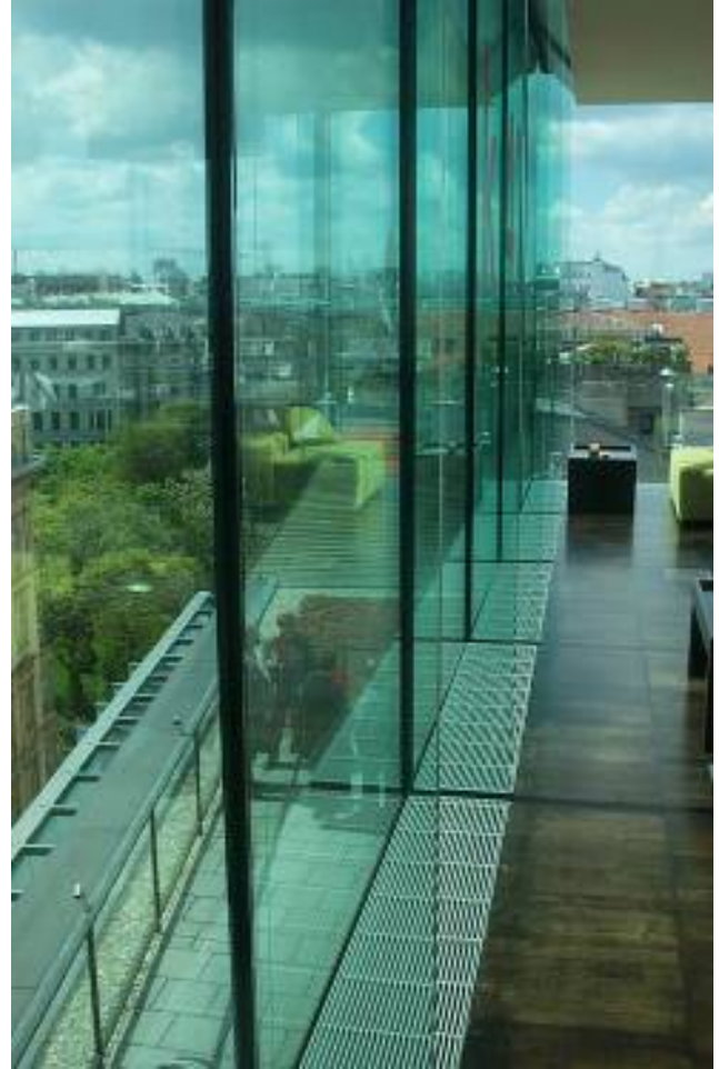
Resim 5: K47 Ofis Binası'nın içinden tarihi kent dokusunun algılanması