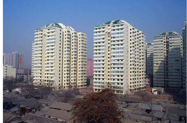
Resim 2: Pekin'de Yasak Şehir içinde yapılan toplu konutlar (Jixiang SHAN, World Heritage Conference 2005)

Tarihi kent peyzajında çağdaş mimarinin başarılı uygulamaları olarak kabul edilen ve konferansta sunulan ve tartışılan örnekler şunlardı: