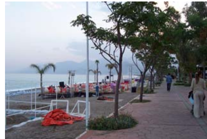
Beach Park Konyaaltı