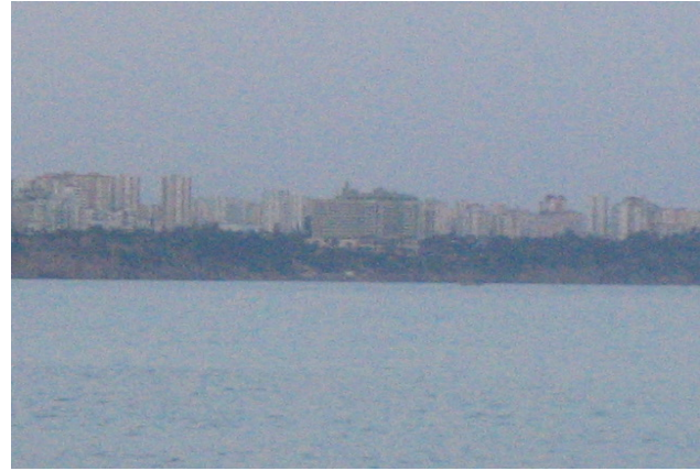
Beach Park'tan Dedeman Otel

yapılarak tahrip edilmiş ve bu kimliksiz yapıların birçoğu tatil evi olarak kullanılmakta. Bu plansız yapılaşma silüeti de olumsuz etkilemiş, sonuç olarak doğal çevre yapay etkilerle yara almış.