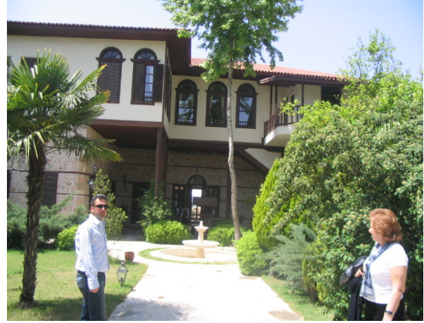
Kaleiçi sokaklarını anlatan bir restoran Gizli Bahçenin ön avlusu (İçine çeken bir karşılama) (Gizli Bahçe Restaurant)

Konyaaltı ardındaki yeşili düzenleyen Beach Park ile kamuya farklı seçeneklerde hizmet sunmakta. Tüm açık hava etkinliklerinin gerçekleşebileceği özgür rekreatif ortamları barındırıyor. Otopark alanları, yeme içme mekanları, muz bahçeleri, oyun ve eğlence mekanları gibi birçok ihtiyacı karşılarken kentin turizme katkısını güçlendirmekte. Fakat yaz mevsiminde mayıstan itibaren gecelerinin gündüzlerle yarışan hareketi kış için geçerli olmuyor.