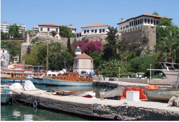
Kaleiçi yat limanından görünüm

yönlendiriyor. Yeşillikler ve kale duvarının eşliğindeki gezinin beklenmeyen bir anında limana ulaşıyorsunuz. Berrak suyu yine karşı kıyının apartman yığını bulandırıyor. Tarihi ve doğal zenginliklerin merkezindeki Tütav otelleri ilgimizi çekiyor. Dokuya uygun yapılaşma ve sağladığı lüks hizmetin yanında kamuya açık mekanlarının olması olumlu noktaları.