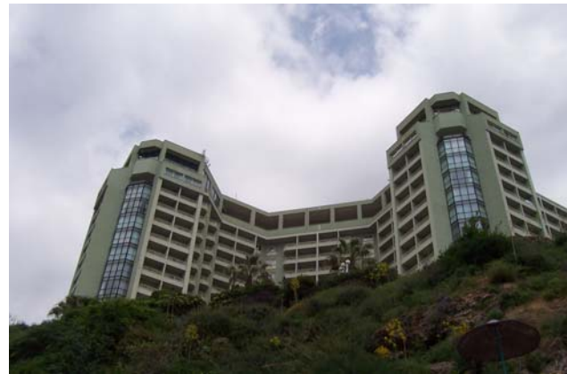
Dedeman Otel'in plajından görünümü

Antalya'nın gelişim süreci ve turizm potansiyelleri ve kıyı kullanımı incelenecek olursa; rant bölgesi olması, kıyı mimarisine uygun olmayan yapılaşmayı beraberinde getirerek doğal dengelerin bozulmasına yol açtığı görülüyor. Plansız ve duyarsız yapılaşma önemli bir tarım bölgesi olan Antalya'yı apartman tarlalarına çevirmiş.