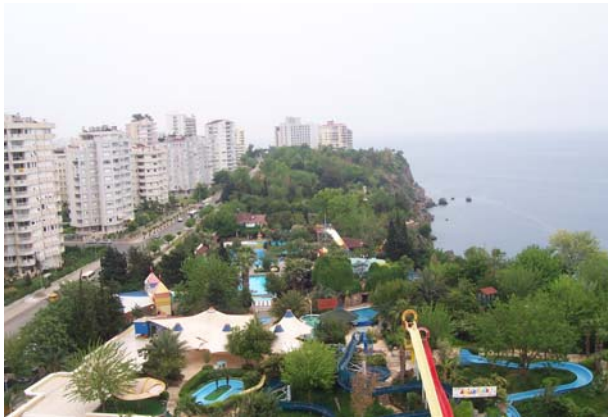
Dedeman Otel'den Lara Kıyıları

Sempozyum ve sunuşlar ardından yaptığımız gezi sürecinde kıyı yağmasını ve plansızlık sonuçlarını görebiliyoruz: