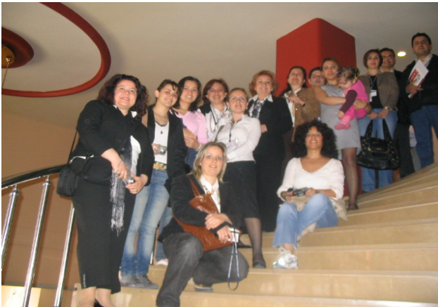
Yıldız Teknik Üniversitesi Mimarlık Fakültesi 15 akademisyen ve 10 adet bildiri katılımcısı ile dikkat çekici boyuttaydı.

28-29 Nisan 2006 tarihlerinde Antalya'da Antalya Mimarlar Odası öncülüğünde 53 bildiri ve 200'e yaklaşık katılımcı ile gerçekleştirilen "Turizm ve Mimarlık Sempozyumu", turizmde sosyal-kültürel-fiziksel gelişmeler, sorunlar ve öneriler konuları üzerine kuruluydu. Sempozyuma katılımcı profili ise akademisyenler ve mimarlardan oluştu. Turizm sektörünün başrol oyuncularını olan yatırımcılar, yerel yönetimler ve sivil toplum örgütlerinin eksikliği, sorunların tartışma platformuna çıkmasını engelledi. Dolayısıyla sempozyum öncesi beklentilerden eksik sonuç elde edildi.