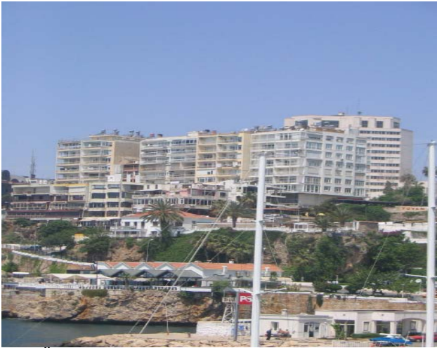
Üstteki iki fotoğrafın aynı yere ait iki kıydan olduğuna inanmak zor