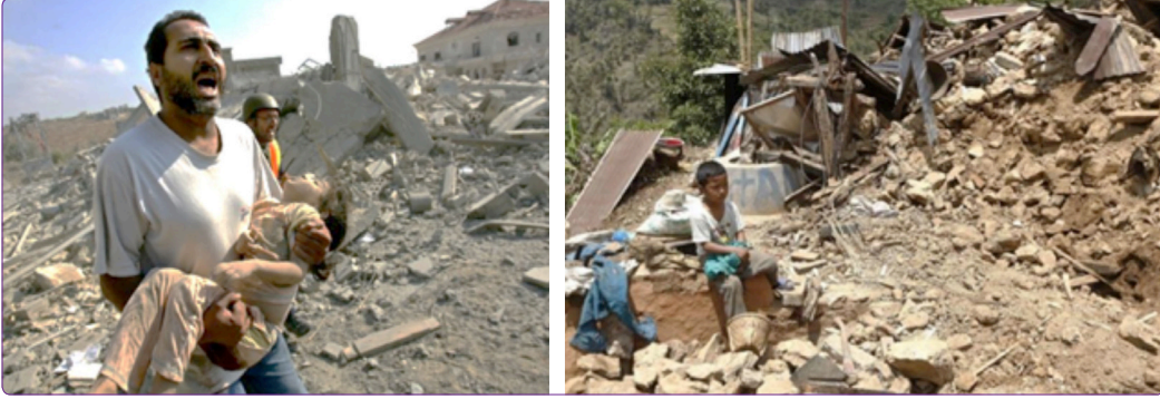
Şekil 7. Afet bölgesindeki acil yardıma ihtiyacı olan afetzedeler. 50

mekânlarında kalabalık yaşam biçimine yabancı olan çocuklara yemek sırası, kişisel ihtiyaçlar gibi eylemlerde öncelik verilmelidir. Çocukları afetin olumsuz etkisinden uzaklaştırmak için gereken önlemler aşağıda belirtilmektedir.