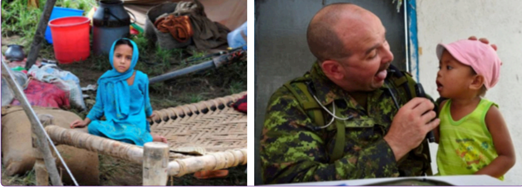
Şekil 6. Afet anında çocukların bakımı. 38