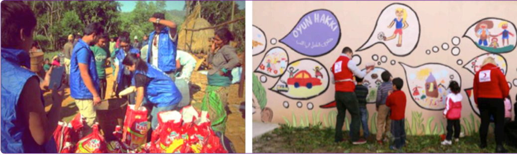
Şekil 9. Yeni yaşam alanlarındaki çocuk etkinlikleri. 49

da rehabilite tedavisinin gerekli olduğu gözlemlenmiştir. 46 İnsanlarda güven duygusunun ve huzurun tekrar sağlanması için bazı insani duyguların iyileştirilmesi gerekmektedir. Bunlar; umut, güven, ortak hareket etme (dayanışma), birlik olma duygularıdır. 47 Çocukların kısa zamanda eski yaşamlarına geri dönmeleri için yeniden inşa sürecinde yapılması gerekenler aşağıda belirtilmiştir.