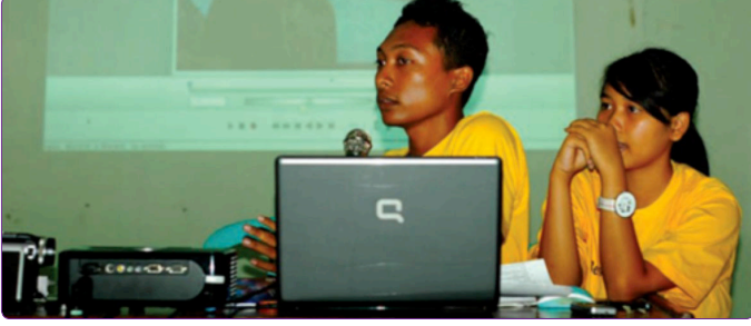
Şekil 5. Çocuk kurultayları oluşturularak çocuklar afetlere karşı bilinçlendirilmesi. 32

samağını oluşturmaktadır. Bu aşamada, öncelikle afetlerin oluşmaması için gerekli önlemler saptanmakta ve olası afetlere karşı ikincil tehlikelerin oluşmasının önüne geçilmeye çalışılmaktadır. Afet süreçlerinde çocukların sağlık bakımlarının düzensizliği veya eksikliği çocukları olumsuz etkilemektedir. Beslenme yetersizliği bebeklerde ölüme, çocuklarda hem ölüme hem de büyüme hızının yavaşlamasına neden olmaktadır. Önleme aşamasında, çocuklar için afet öncesinde yapılması gerekenlerin başlıcaları aşağıda belirtilmiştir.