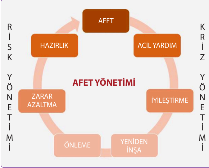
Şekil 2. Afet Yönetimi Döngüsü. 19