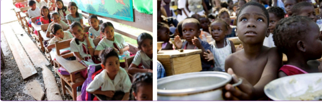
Şekil 8. Geçici eğitim birimleri ve bakıma muhtaç afetzede çocuklar. 45