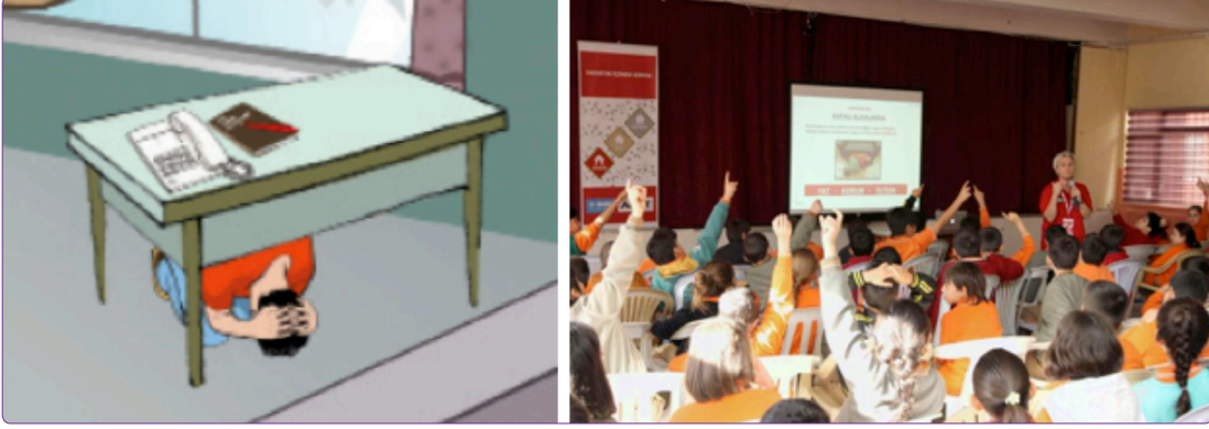
Şekil 4. Çocukların afetlere hazırlanmasında eğitim kurumlarının rolü. 30

Çocuk Merkezli Afet Yönetimi'nde Risk Yönetimi üç aşamada ele alınmaktadır.