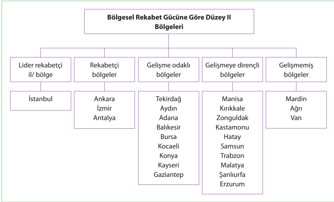
Şekil 2. Bölgesel rekabet gücüne göre Düzey II bölgeleri.

ve iç kesimdeki illerin büyük bölümü bu küme içinde yer alırken, batıdaki rekabet gücü yüksek illerin çevresindeki bazı iller de (Çanakkale, Manisa, Uşak, Afyon, Burdur, Düzce gibi) aynı küme içinde yer almaktadır. Karedeniz Bölgesinin iki büyük kenti konumundaki Trabzon ve Samsun illeri de bölgedeki diğer iller gibi dördüncü kümede yer almıştır. Bu durumda bölge içinden göç alan bu illerde artan nüfus nedeniyle kişi başı değerlerin düşmekte oluşunun etkileri gözlenmektedir. Sanayi bakımından gerileyen bir il olan Zonguldak ve bu ilden ayrılarak il haline gelen Karabük ve Bartın da bu kümede yer almaktadır. Bu kümede yer alan illerin kamu yatırımları ya da geçmişteki gelişmişlik dönemlerdeki nitelikli işgücü, üniversite vb donatılardan kaynaklanan birikimleriyle bu kümede yer aldıkları söylenebilir.