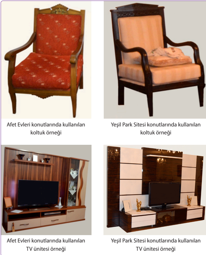
Şekil 3. Örneklem grubunda görülmeye başlanan aynılaştıran mobilya örnekleri.

lı olan kullanıcıların konutlarında birbirine benzer, ancak ekonomik değeri ve kalitesi farklılık gösteren mobilyalara yani taklit mobilyalara da rastlanabilmektedir. Yani küreselleşme etkisiyle alt gelir grubu kullanıcıların konutlarında da