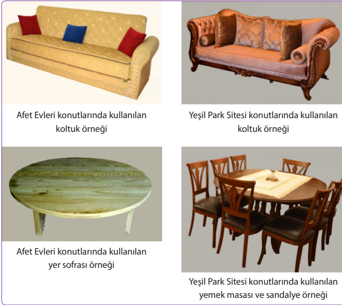
Şekil 2. Örneklem grubundaki kullanıcıların farklı yaşam tarzları olmasından kaynaklı farklılaşan mobilya örnekleri.