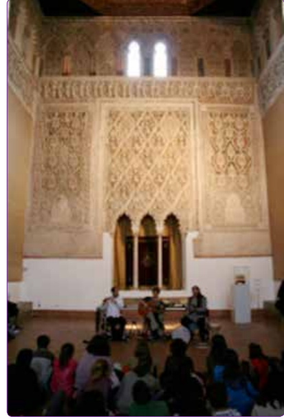
Şekil 4. El Tránsito Sinagogu, Toledo, 14.yy (Sinagoga del Tránsito) (Kaynak: Yazar tarafından çekilmiştir).

19.yy'da İspanyol akademisyenler, mimaride görülen Mudéjar Sanatı'nı bir üslup olarak kabul etmekten ilerleyen zamanlarda bu durum değişir. Mudéjar'in bir sanatsal manifesto olduğuna ilk olarak José Amador de los Ríos değinir. El Estilo Mudéjar en Arquitectura/ Mimaride Mudéjar Üslubu kitabında Mudéjar Sanatı'nın Hıristiyan ve İslam sanatlarının karışımı olduğundan bahseden Ríos