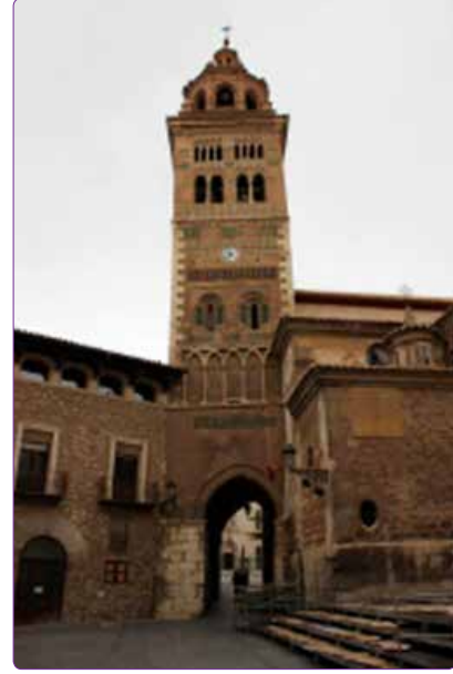
Şekil 1. Santa Maria Katedrali ve Çan Kulesi, Teruel, 1171-1587 (Catedral de Santa Maria y Torre).

Mudéjar yapılarında görülen farklı mimari yorumlar İspanyolların yeniden fetih kronolojisi, yeniden nüfuslandırılan yerlerin durumu ve taşıdığı İslami gelenekle alakalı olarak ortaya çıkmıştır. Geniş bir zaman diliminde görülen ve etnik çeşitliliğe sahip bu yaşam geleneğinin Mudéjar gibi çok yönlü dinamik bir sanatsal üslup yaratması şüphesiz ki kaçınılmaz bir sonuçtur. Mudéjar Mimarisi'nde İslam Sanatı'na yaklaşan biçimsel oluşum geometrik süsleme anlayışında ve malzeme kullanımında baskındır. Yapılarda yoğun bir biçimde tuğla kullanılması İslami gelenekle açıklanmalıdır. Tuğlanın çini ile uyumu İslam Sanat ve zevkini yansıtırken aynı zamanda tuğlanın hem inşa hem de dekorasyon sürecinin ayrılmaz bir parçası olduğunu gösterir (Şekil 1–3). Yapısal unsurlardan ahşap çatı uygulamaları teknik ve geometrik süslemeyi kullanması itibariyle üslupsal açıdan İslam Sanatı'nın devamcisidir. Süslemeye sunduğu kolaylıklar neticesinde alçının yine çokça tercih edildiği bu yapılarda izlenmektedir. Toledo'daki 14.yy'a ait El Transito Sinagogu alçı ve ahşap malzemenin zengin kullanımına örnek teşkil eder. Ahşap hem örtü sistemi olarak yapıyı korurken, bir yandan dekoratif imkanlar sunar. Alçı benzer bir biçimde mekanın İslami dokunuşunun sonucunda elde edilen geometrik, bitkisel ve yazıdan oluşan süsleme repertuarı ile dikkat çekmektedir (Şekil 4).