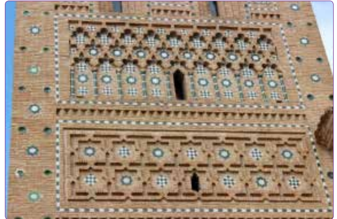
Şekil 2. St. Martin Kilisesi Çan Kulesi detayı, Teruel, 1316 (Torre de San Martin) (Kaynak: Yazar tarafından çekilmiştir).