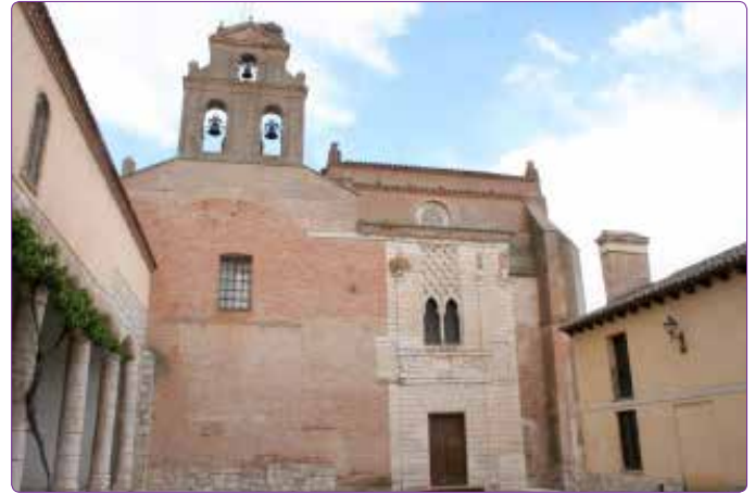
Şekil 5. Santa Clara Kraliyet Manastırı, 15.yy, Valladolid (El Real Monasterio de Santa Clara) (Kaynak: Yazar tarafından çekilmiştir).

kullandığı ifade ile konuyu deyimsel bir biçimde açıklar. Ona göre Mudéjar Sanatı Hıristiyan Mimarisi ve Arap Mimarisi'nin evliliği neticesinde ortaya çıkmıştır. Bu yaklaşımı ile 19.yy'da Ortaçağ'a yönelik İspanyol aydınlanma hareketi ile oluşan negatif tavrı bir nevi etkisizleştirir. 14