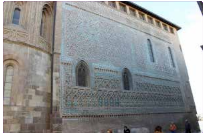
Şekil 3. La Seo Kilisesi, Zaragoza, 1318 (La Seo de Zaragoza).