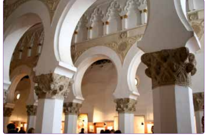
Şekil 6. Santa Maria Blanca Sinagogu, 12.yy, Toledo (Sinagoga del Santa Maria la Blanca) (Kaynak: Yazar tarafından çekilmiştir).

Mudéjar Mimarisi'nin melez bir yapıya oturması sanatsal değerinin tartışmaya açık olmasına yol açar. Bazen Mudéjar Sanatı İslam sanatının bir devamı olarak görülür, ancak kimi yayınlarda araştırmacılar Mudéjar Sanatı'nı, İslam ve Hıristiyan sanatlarının bağlantı noktası olarak değerlendirmektedir. 18 Ancak Mudéjar'a bu şekilde iki kültürün bağlantı noktası gözüyle bakanların atladığı konulardan bir tanesi bu sanatın Hıristiyanlardan belki de daha heyecanlı bir biçimde Yahudiler tarafından kullanılmasıdır. Bu yönüyle Mudéjar Mimarisi çoklu kültürel yapıya sahiptir. Toledo'daki Samuel Halevi ve Santa Maria Blanca Sinagogları 13.yy'ın Yahudi yapılarında Mudéjar üslubunda yapılmış önemli yapılar olarak karşımıza çıkarlar ve bu yapılarda Almohad üslubunun Yahudi sanatındaki karşılığını buluruz 19 (Şekil 6). Yahudilerin kullanmış olduğu formalar İslam Sa-