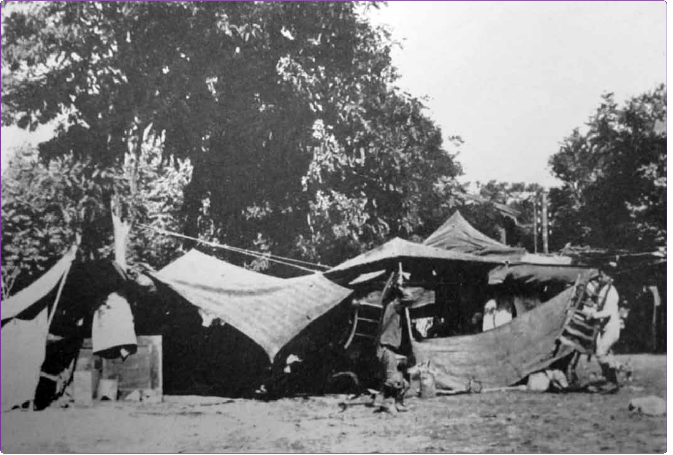
Şekil 3. 1894 yılı depreminden sonra oluşturulmuş çadırlar [Ürekli, 1999, s. 34].

birine benzer aynı tip ve planda oluşturulmuş konutlar olarak değil de, yıkılan binaların mevcut alanına yenisinin yapılması şeklinde oluşturulmaktadır. Bu da kalıcı konut için farklı bir yaklaşım olarak değerlendirilebilir.