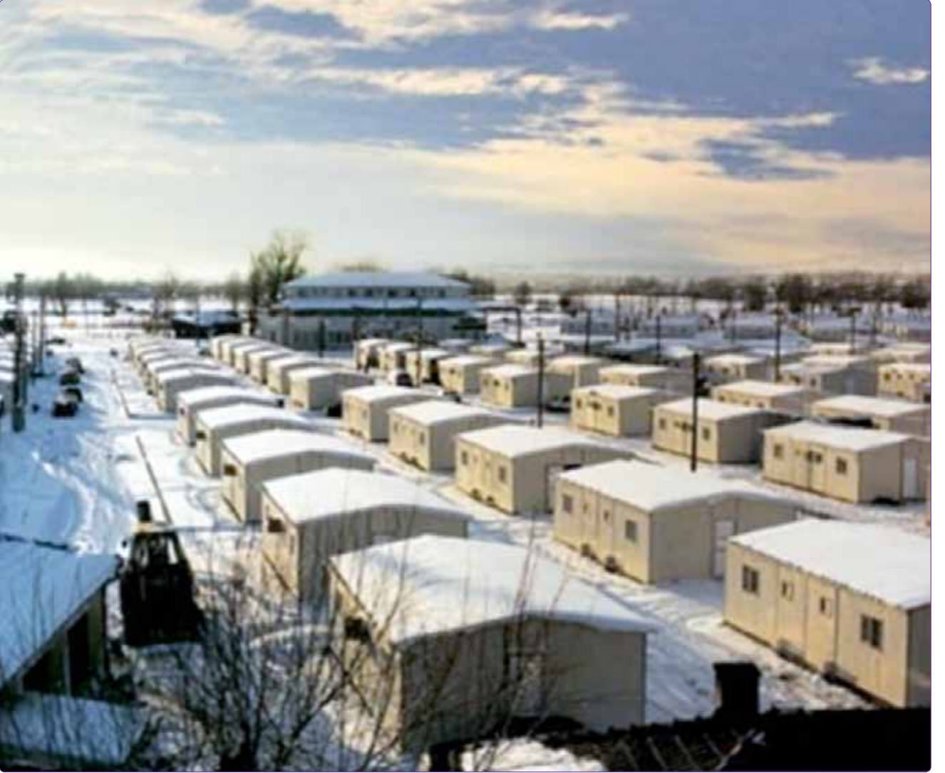
Şekil 5. 1999 Marmara Depremi sonrası prefabrik geçici konutlar [URL-3].

Deprem sonrasında barınma birimleri için yer seçimi; bölgesel planlama gözetilmeksizin alınan kararlar, tarım alanlarının yerleşime açılmış olması ve yerel yönetimle irtibatsız olarak eski imar paftalarından belirlenmelerin yapılması pek çok sorun meydana getirmiştir. 66