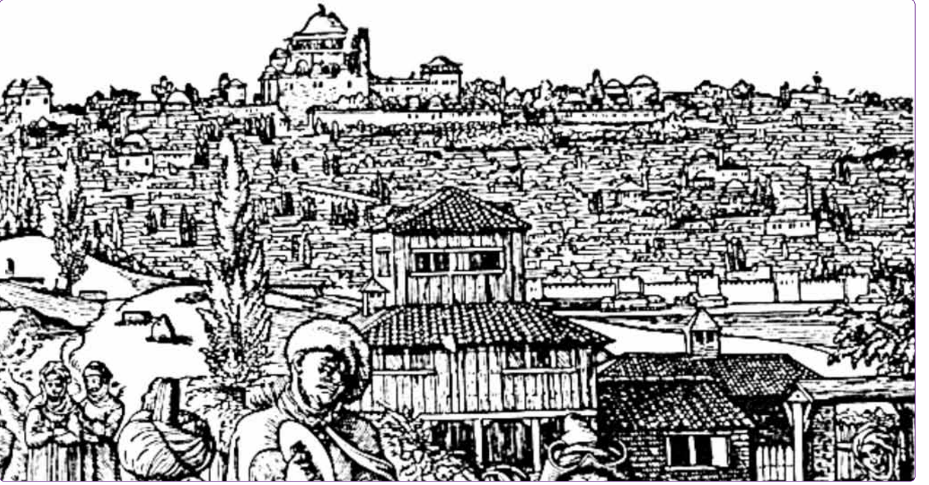
Şekil 1. Flemenk ressam Peter Coecke'nin 1509 depremini anlatan ağaç oyma gravürü [Sakin, 2009, s. 320].

önceki son beş yüz yıl boyunca Akdeniz'de yaşanan en büyük ve yıkıcı depremdir. Depremin artçı sarsıntıları iki yıl kadar devam etmiştir. 6