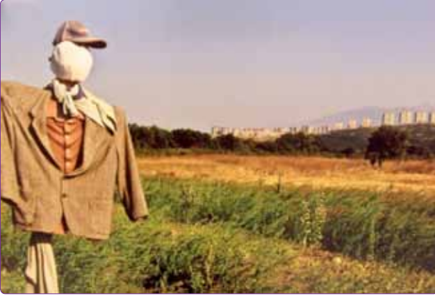
Şekil 2. Fotoğraf yarışması birincisi, Mehmet Dağ.