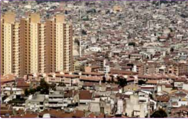
Şekil 3. Fotoğraf yarışması ikincisi, Egemen Ergin.

Veli'nin Gemlik girişinde bir sözü asılıdır. "Sakin şaşırmayın, denizi göreceksiniz." Artık bu yazı değiştirilerek yerine Bursa'nın girişine şu tabela asılmalıdır: "Sakin korkmayın, TOKİ'yi göreceksiniz." 4