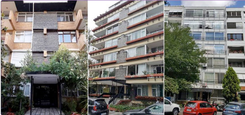
Şekil 9. Sırasıyla; Seden ve Gezi, Bulgurlu Apartmanı.