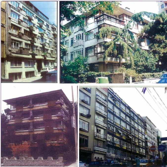
Şekil 10. Sırasıyla; Yonca Apartmanı, Yeşil Apartmanı, Dilman Apartmanı, Moda Palas ve bitişiğindeki Kent Apartmanı (MK-A).

Bu özgün cephe kurguları ile dikkati çeken ancak literatürde pek yer bulamamış figürlerden biri de Melih