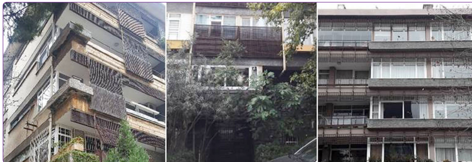
Şekil 5. Sırasıyla Dilman Apartmanı, Çizmecioğlu Apartmanı ve Suner Apartmanı'nda gridal eleman kullanımı (Efsun Ekenyazıcı Güney ve Hande Tulum Okur arşivi, 2020).