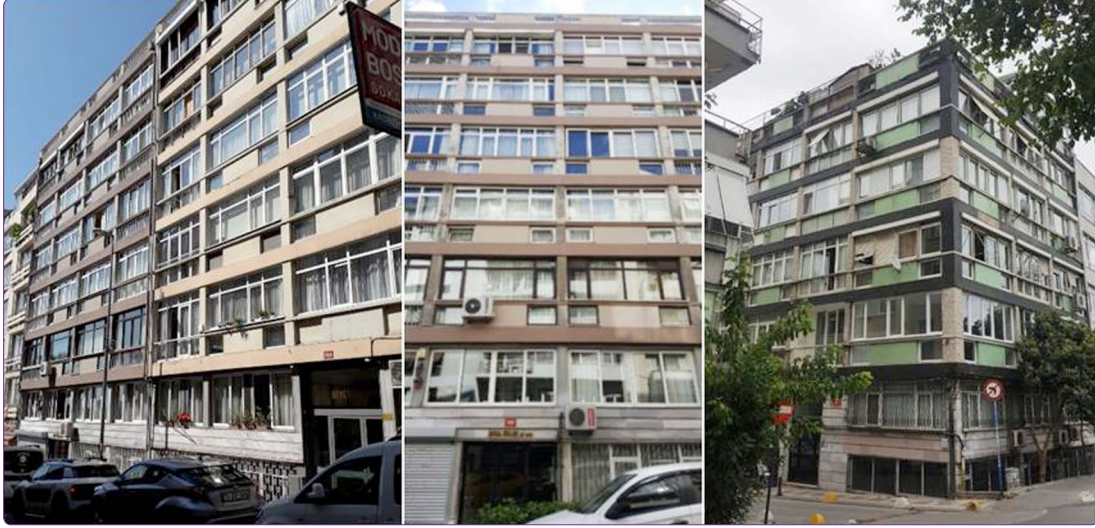
Şekil 6. Sırasıyla; Kent ve Moda Palas Apartmanı (bitişik), Moda Palas Apartmanı girişi, Özoğuz Apartmanı.

Caferağa, Moda'da yer alan Moda Palas Apartmanı (1962), Kent Apartmanı (1964) ve Özoğuz Apartmanı (1965) mimarın cephede bu kurguyu kullandığı yapılardandır (Şekil 6). Ön cephesinde belirgin kütesel hareketlere rastlanmayan bu örneklerde, mimarın yere kadar uzanan pencerelerin önüne tasarladığı parapetler, kolon ve girişlerle birlikte ritmik bir çerçeveye dönüşmektedir. Böylece girinti ya da çıkıntı algısı yaratacak mekânsal düzenlemelere rastlanmasa da bu ritmik çerçeveler yardımıyla yine kısmen dinamik bir cephe kurgusuna ulaşılmaktadır. Mimar, bu unsuru ele alırken aynı zamanda dolu-boş ilişkisine de dikkati çekmekte ve bu durumu renk ögesini de kurguya dahil ederek pekiştirmektedir.