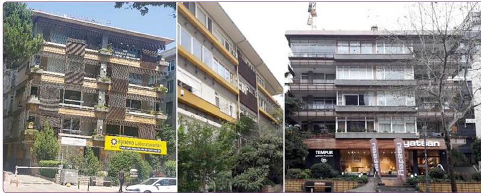
Şekil 4. Sırasıyla; Dilman Apartmanı, Çizmecioğlu Apartmanı ve Suner Apartmanı.

Koray'ın cephe tasarımlarında ele aldığı ikinci unsur ise kolon ve giriş sistemini (strüktürel elemanlarla) cephelye yansıtarak ritmik çerçeve oluşturma yöntemidir.