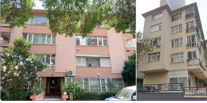
Şekil 2. Sırasıyla; Engin Apartmanı (Fenerbahçe, 1966), İpek Apartmanı (Zühtüpaşa, 1974).

Mimarın 1960-1980 yılları arasında apartman cephelerindeki tasarım dili incelendiğinde kimi unsurların sıklıkla ele alındığı görülmektedir. Bu unsurları birlikte ya da ayrı ayrı kullanan Koray -özellikle- ön cephelerde üç boyutlu bir doku oluşturmaktadır. Yapıların bu cephelerine muhtemelen dinamizm katmak ve onları diğer cephe örneklerinden ayırt edilir hale getirmek için malzeme, doku ve renk çeşitliliğine dikkat etmektedir.