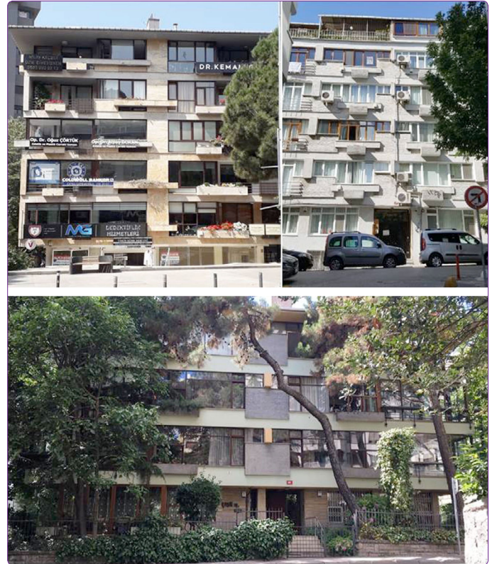
Şekil 7. Sırasıyla; Erenköy Palas Apartmanı, Yonca Apartmanı ve Yeşil Apartmanı (Efsun Ekenyazıcı Güney ve Hande Tulum Okur arşivi, 2020).

Erenköy Palas Apartmanı'nda farklı büyüklük, derinlik, doku ve renkteki yatay entegre elemanların şaşırtmalı yani