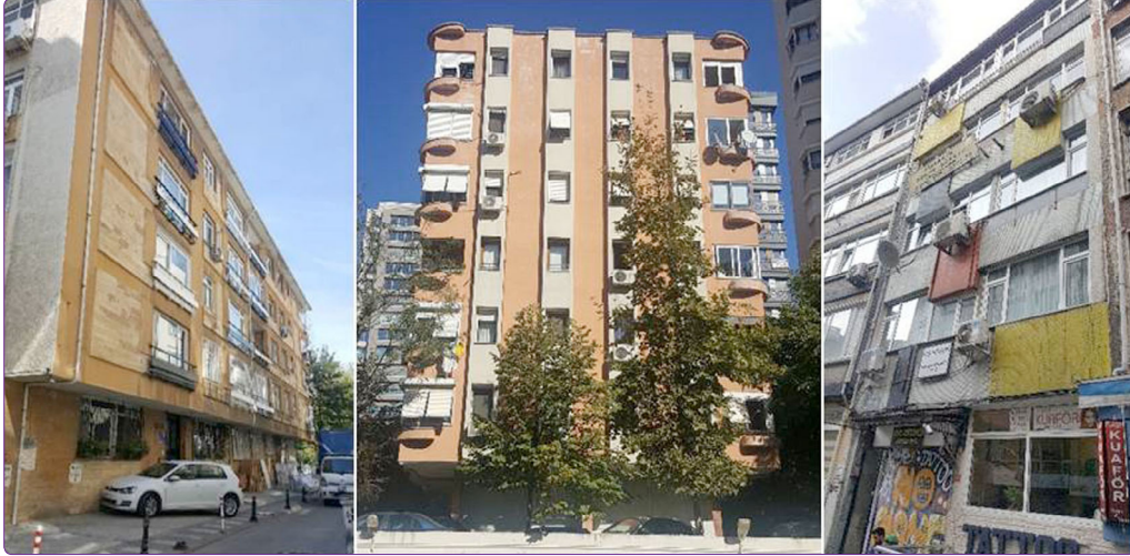
Şekil 8. Sırasıyla; Rüyam Apartmanı, Bizim Apartmanı ve Neşe Apartmanı.

Mimarın cephe organizasyonunda sıklıkla kullandığı son unsur ise kanopidir. Bu öge Koray'ın mimarlık dilinin bir diğer önemli parçası olup Seden Apartmanı, Bulgurlu Apartmanı (Caferağa, 1969), Gezi Apartmanı ve Kuzu Apartmanı (Sua-