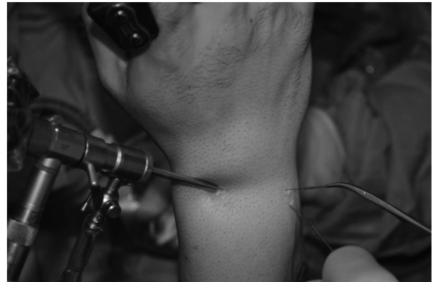
Şekil 2. portal'ın 1 cm altından açılan insizyondan TFKK periferik yırtık kenarına yeşil iğne gönderilmesi ve 6 R portalden sokulan klemp yardımı ile prolens halkasının dışarı alınması.