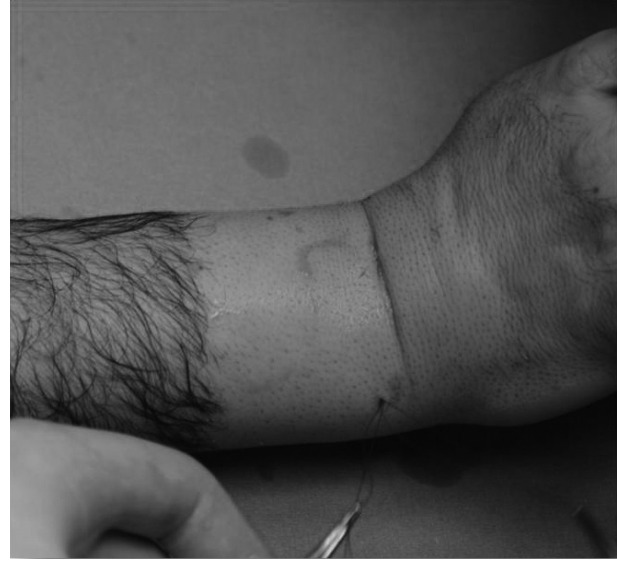
Şekil 5. Traksiyonun sonlandırılarak el bileği ekstansiyonda iplerin düğümlenmesi.