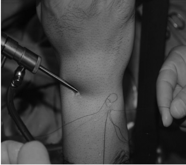
Şekil 3. Halkanın ortasından geçirilen ikinci ipin diğer ucunun halka yardımı ile 6R altından açılan insizyondan çıkarılması ve stur öncesi artroskopik görünüm.

Hastaların yakınmaya başlama zamanları ile operasyon arasında geçen süre ortalama 16.2 (Dağılım: 4-46) ay, ameliyat sonrası ortalama takip süresi ise 11.6 (Dağılım: 6-21) aydı. Fonksiyonel değerlendirmede ameliyat öncesi ve sonrasında yapılan "Türkçe QuickDASH" ölçeği ve VAS (Görsel analog ağrı skalası) kullanıldı. Ameliyat öncesi ve takip dönemine ait veriler istatistiksel olarak kıyaslandı.