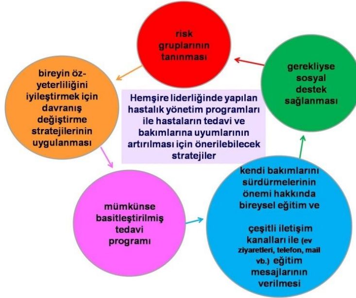
Şekil 3. Hastalık yönetim programlarına hasta uyumunun artırılması için öneriler [41]

Sonuç olarak, bakımda hastalık yönetim programlarının kullanılması organize ve bütüncü bir şekilde hastaya bakım verilebilmesi için hemşirelere yardımcı olacaktır. Ülkemizde bu yönde sürekli programlar bulunmamakla birlikte, yaşlı nüfusunun artmasıyla beraber gelecek yıllarda kronik hastalıklardan ölümlerin de artacağı düşünülürse hemşire liderliğinde hastalık yönetim programlarının hızla oluşturulmaya ve uygulanmaya başlanması öncelikli bir ihtiyaçtır.