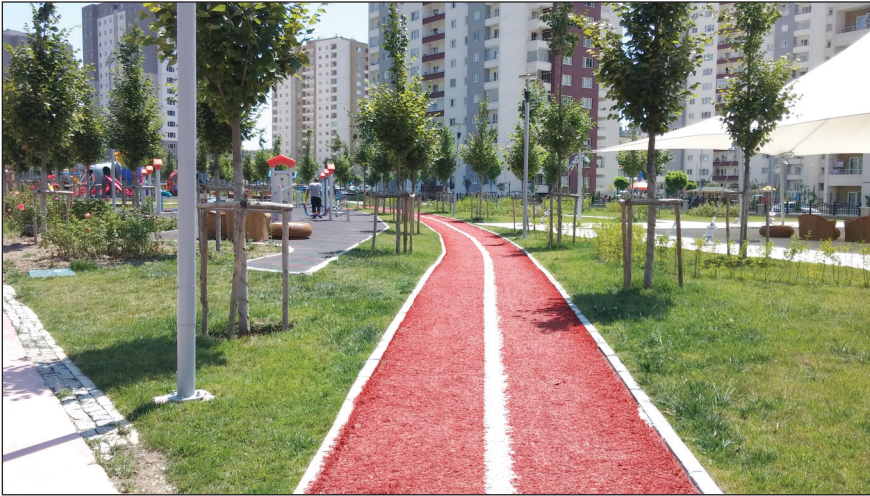
Şekil 7. 1. Etap park alanındaki yürüyüş yolu. Fotoğraf: Burcu Göközkut, 2016.