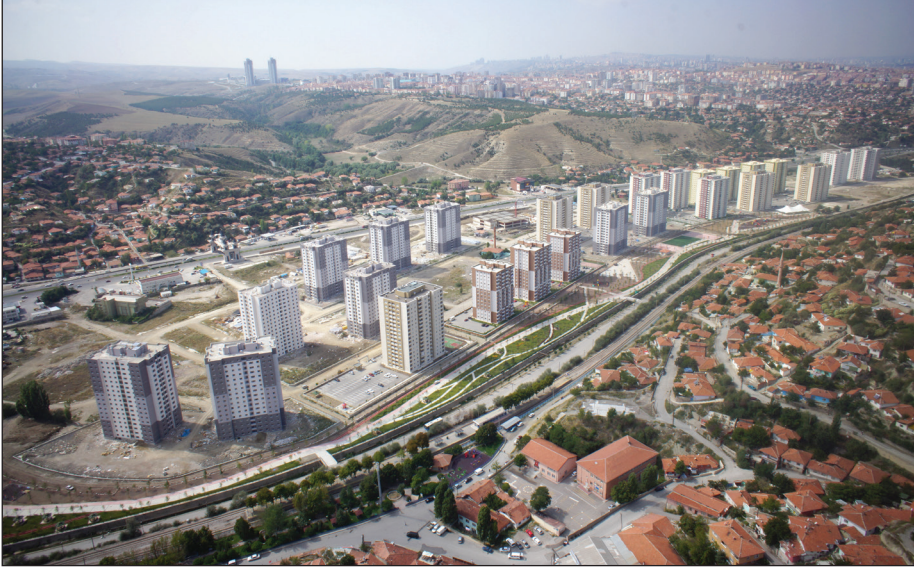
Şekil 2. YMKD'nde gecekondusu sahiplerinin taşındığı apartmanlar – 1. Etap.

O bina o şekilde yapıldığı için yani yokluktan yapıldığı için değeri 300 milyar değil, değeri 30 trilyon bile değil. Dedemin gözünde o evin değeri 30 trilyon bile değildi. 30 sene 40 sene ömrü orda taşıyla karılmış, çamuruyla örülmüş. Emekten dolayı manevi değeri çok çok yüksek. O bina yıkıldığında dedem babaannem gidemedi, kaç yaşındayım ben babamın ağladığını ilk orada gördüm. Bu da manevi boyutu, her şey ticaret de değil (...) Benim oturduğum şu anki evden, bizim eski bahçemizin olduğu yerde çam ağaçları kesilmedi, balkona çıktığımda çam ağaçlarını görebiliyorum, bakıyorum her gün. Bu duygusal boyutu işte. Çünkü benim çocukluğum orada geçti (K13, Erkek, 28 yaşında).