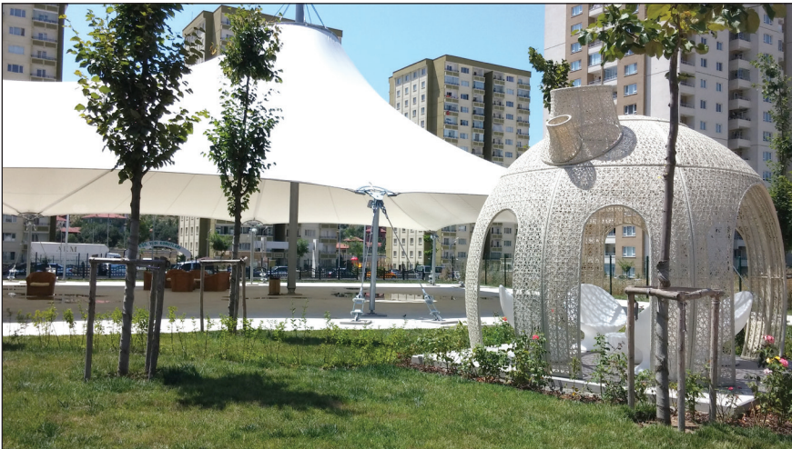
Şekil 8. 1. Etap park alanındaki oturma alanları. Fotoğraf: Burcu Göközkut, 2016.