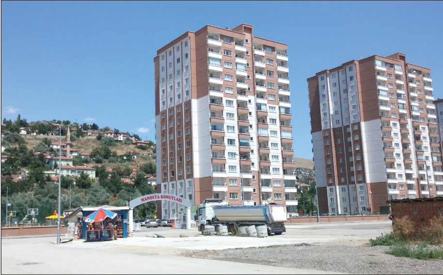
Şekil 4. 1. Etap’ta bulunan Halk Ekmek dükkanı.

“Bu evler bizim için lüks evler. Ama buranın da her şeyi sorun. Kapılar kapanmaz, langır lungur sallanır ama görünüşte lüks görünüyor” (K3, Erkek, 65 yaşında).