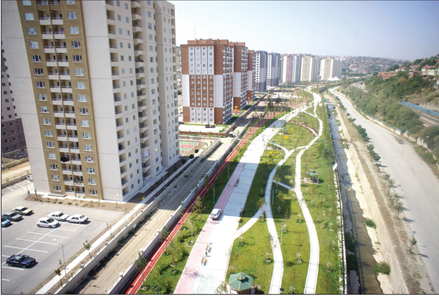
Şekil 6. YMKDP 1. Etap ve 2. Etap arasında kalan park alanı.