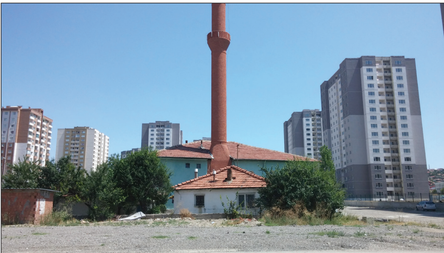
Şekil 5. 1. Etap’ta cami yerine kullanılan Kuran kursu.