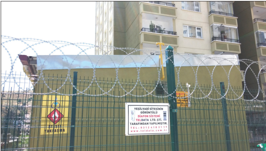
Şekil 11. Sitelerin çevresine güvenlik amaçlı çekilmiş dikenli tel. Fotoğraf: Burcu Göközkut, 2016.