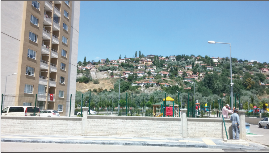
Şekil 10. Sitelerin çevresine güvenlik amaçlı dikenli tel çekiliyor.

Türkiye'de kentsel dönüşüm projeleri neoliberal politikaların aracı olarak bir yandan kenti yeniden yapılandırır-