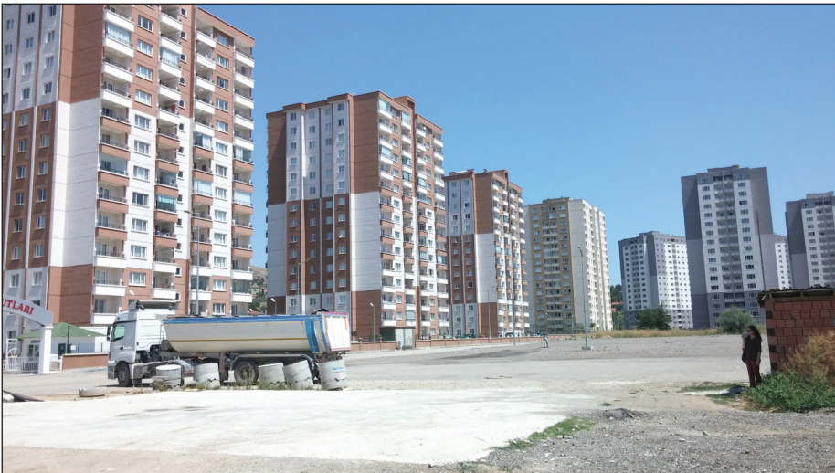
Şekil 3. Eski gecekondusu sahipleri tarafından 'hapis' ve 'cezaevi' benzetmesi yapılan apartmanlar.