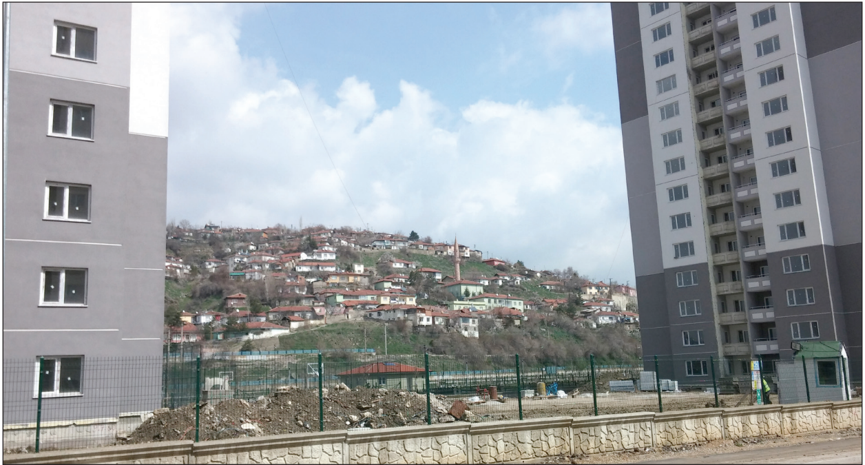
Şekil 9: YMKDP'nde 1. Etapta bulunan apartmanların ve 2. Etapta bulunan gecekonduların mekânda yarattığı tezat görüntü. Fotoğraf: Burcu Göközkut, 2016.

Ah Eryaman, Batıkent gibi olsa buralar ne güzel. Bunlar çok kötü. Verecekler evleri çekiliş mekilmiş yapacaklar aynı bu evler gibi. Buralar da artık Pursaklar'daki yerler gibi olacak. Pursaklar'ın bir tarafı daire,