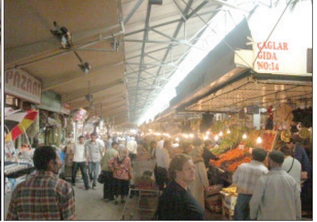
Şekil 7. Ulus Sebze Hali (2013).