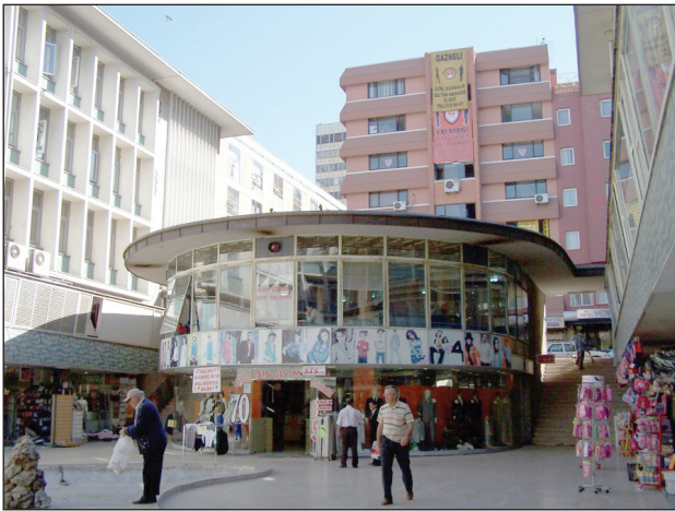
Şekil 4. Ulus İşhanı Kuzey Avlusu (2007).

Ulus İş Hanı, Erken Cumhuriyet Dönemi'nin (1923-1950) ulusal ve uluslararası mimarlık üsluplarından sonra 1950'ler mimarlığının modern çizgisini temsil eden simge yapılardan birisidir (Şekil 4). Bu dönemde giderek artan yeni ticari büro ve alışveriş mekânı gereksinimlerini karşılamak amacıyla inşa edilmiştir. Yapının, üç tarafındaki yolların da yarattığı karmaşık kentsel çevreye karşın, sokaklarla ve Meydan ile kurduğu ilişki, yüksek büro bloğunun hafif gerilimli düzenlenişi gibi özellikleri ona "kentsel yapı" statüsü kazandırmaktadır. Bu özellikleri ile Cumhuriyet Dönemi mimarlık tarihi değerlendirmelerinde önemli bir belge niteliği taşımaktadır. Aynı zamanda binanın yoğun ve aktif olarak kullanımının sağladığı ekonomik değer de göz ardı edilmemelidir.