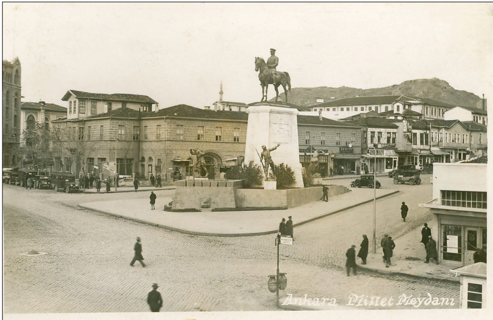
Şekil 9. Ulus Meydanı’nda bulunan Zafer Anıtı ve arkada Taşhan.

...Ulus Meydanı’nın Ankara Kalesi ile tarihsel olarak kurduğu görsel ilişki de başka bir değerlendirme konusu olmuştur. Bu kapsamda, Meydana katkısı sınırlı olan yüksek katlı kamu yapıları ile bunların ortasındaki Anafartalar Çarşısı’nın blok olarak ortadan kaldırılması ve bu alanların Meydan ile açık alan sis-