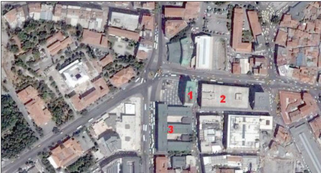
Şekil 5. Ankara Tarihi Kent Merkezi Yenileme Alanı Koruma Amaçlı Uygulama İmar Planı içinde dava konusu olan 1.Gençlik ve Spor Genel Müdürlüğü, 2. Anafartalar Çarşısı, 3. Ulus İşhanı görülmektedir.

Plandan da görülebileceği gibi yapılmak istenen Taşhan Çarşısı, orta kesimde 3 adet (Şekil 5), biri de Ulus İşhanı olmak üzere tescillenmiş en az 4-5 yapının koruma alanı içinde yer almaktadır. 2863 Sayılı Kanun uyarınca; koruma kurullarının görev yetki ve çalışma usullerini belirleyen 57. maddesinde; (5226 ile değişiklik yapılan d bendi) "Koruma amaçlı imar planları ile bunların her türlü değişikliklerini inceleyip karar almak" hükmü ile de imar planı değişikliklerinde karar alma yetkisinin Ankara Kültür ve Tabiat Varlıkları Koruma Bölge Kurulu olduğu ve Ankara Büyükşehir Belediyesi tarafından bu Kurul'dan görüş alınmadan koruma planı değişikliğine gidildiği açıkça görülmektedir.