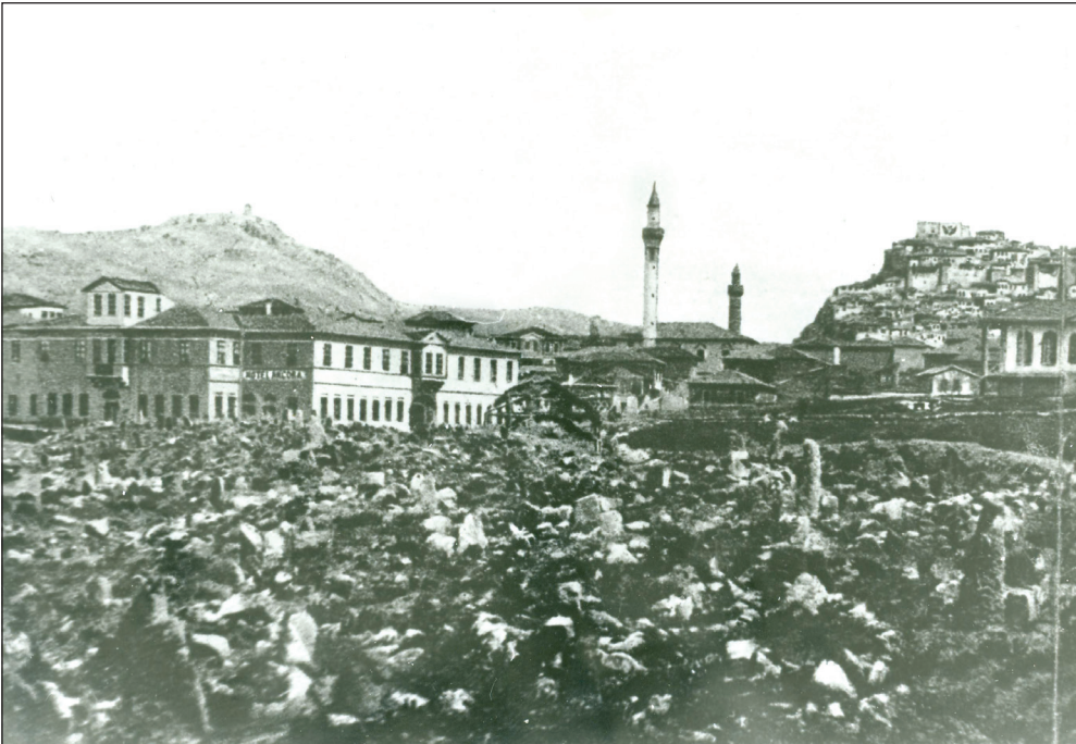
Şekil 8. Düzenleme öncesi Taşhan Meydanı (soldaki yapı Taşhan).

Günümüzün çağdaş koruma anlayışı artık "eski" ve "tarihsellik" kavramlarının dışına çıkarak, her dönemin kentleşme ve mimarlık anlayışını yansıtan özgün örneklerin korunması ve geliştirilmesine yönelmiştir. 2863 Sayılı Kanun'da 5226 Sayılı Kanun ile yapılan değişiklik sonucunda kabul edilen tanım, yeni ve geniş bir perspektif oluşturmaktadır: