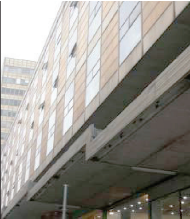
Şekil 6. Yıkılmak istenen Anafartalar Çarşısı ve Gümrük Müsteşarlığı binası.

Ankara İmar ve Emlak İşletmesi T.A.Ş. tarafından 1967 yılında düzenlenen mimari proje yarışması sonucunda elde edilen projenin müellifleri, dönemin tanınmış mimarlarından Ferzan Baydar, Affan Kırımlı, Tayfur Şahbaz'dır.