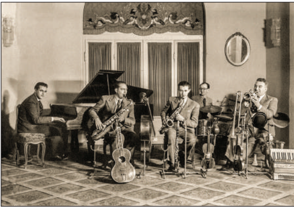
Şekil 1. Ankara Palas Orkestrası, t.y.