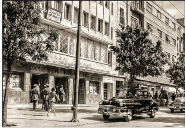
Şekil 6. Büyük Sinema, 1949.