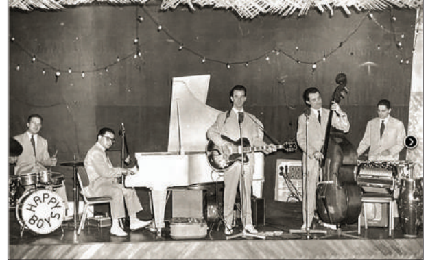
Şekil 9. Ankara Palas. Happy Boys Orkestrası, t.y.