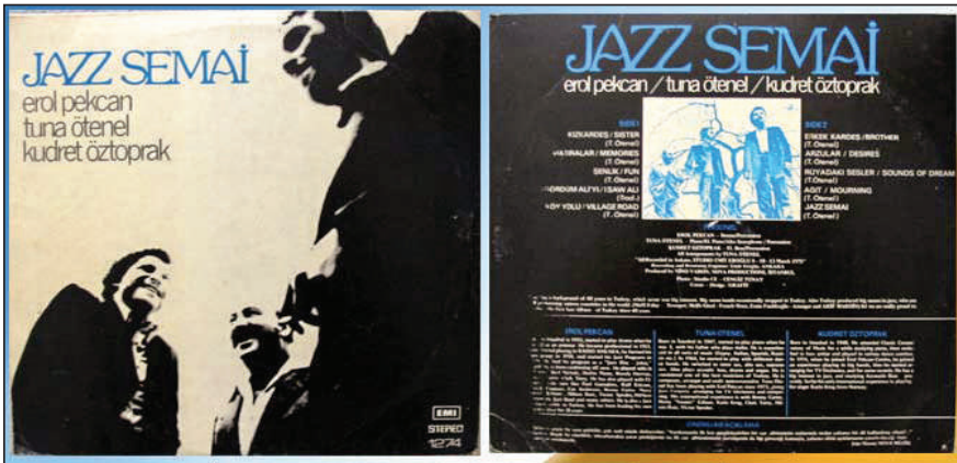
Şekil 21. Jazz Semai albümünün ön ve arka kapakları, 1978.