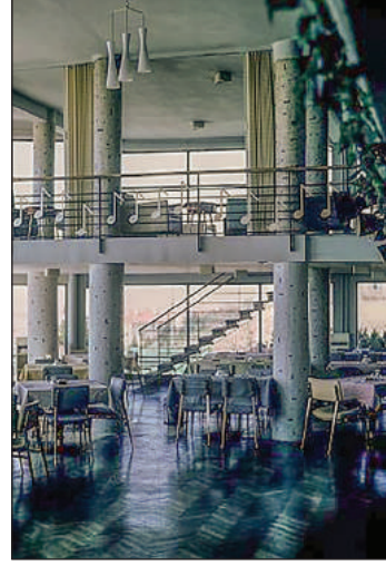
Şekil 4. Officers' Club dış ve iç mekân, 1963.