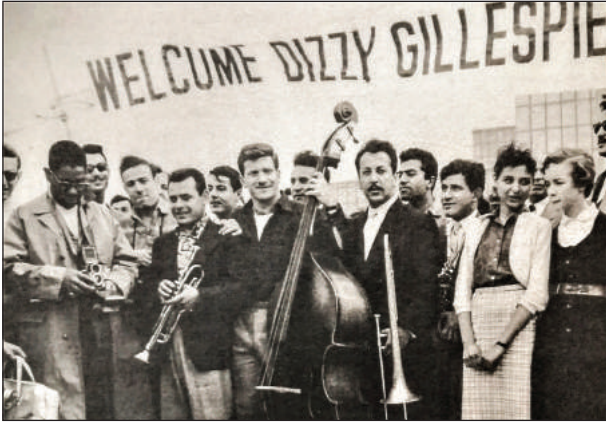
Şekil 5. Dizzy Gillespie, Muvaffak Falay, Süheyl Denizci, Sabahattin Doğangöz 1956.