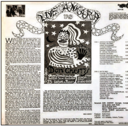
Şekil 17. Live Ankara albümü ön ve arka kapağı, 1969.