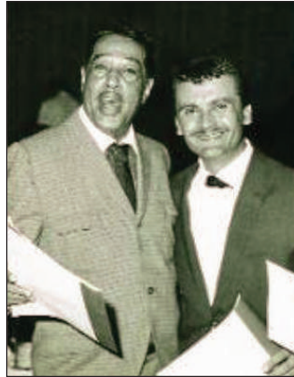
Şekil 13. Duke Ellington ve Aydemir Mete, 1963.