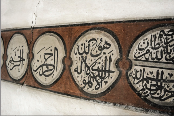
Şekil 23. Madalyonlardaki yazılar. Fotoğraf: Muzaffer Karaaslan, 2020.