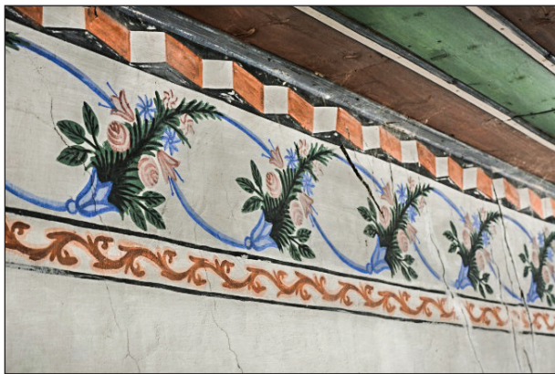
Şekil 14. Harimin tavan eteğindeki bezemeler. Fotoğraf: Muzaffer Karaaslan, 2020.