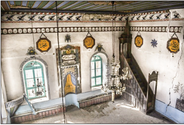
Şekil 10. Caminin içi ve bezemeler. Fotoğraf: Muzaffer Karaaslan, 2020.

Bitkisel bezemelerin olduğu bir diğer yer doğu ve kuzey duvarıdır. Doğü duvarında yazılarla birlikte ortak bir kompozisyonla yapılmış farklı bitkisel düzenlemeler vardır. Burada akantus yaprakları, lale ve yıldız çiçeğine benzer çeşitli çiçek motifleri bulunmaktadır (Şekil 11 ve 12). Kuzeydeki giriş kapısının her iki yanında ise