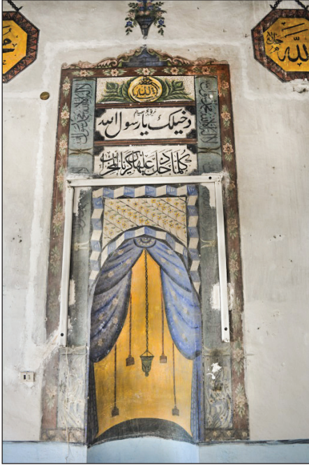
Şekil 16. Caminin mihrabı. Fotoğraf: Muzaffer Karaaslan, 2020.

şerit içerisinde yan yana dizili kenarları iç bükey çerçeveler yer almaktadır (Şekil 10). Çerçevelerin içinde yazılar vardır. Şerit ve çerçeveler kahverengi, siyah, gri ve beyaz renklerle boyalıdır. Tavan eteklerindeki geometrik bezemeler zigzag formunda ilerleyen, turuncu, siyah, beyaz ve kiremit kırmızısı renklerin kullanıldığı motifler şek-