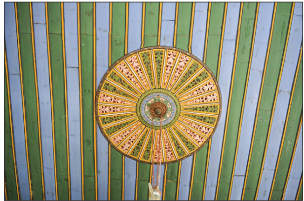
Şekil 9. Caminin ahşap tavanı.