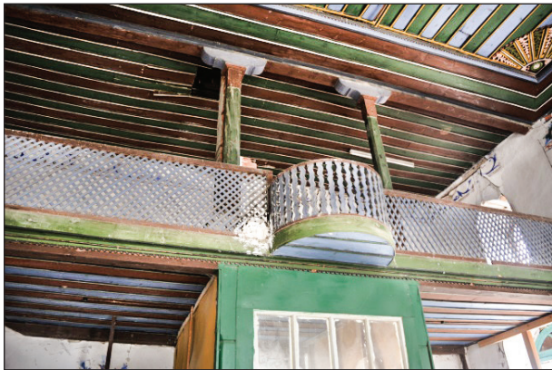
Şekil 8. Caminin kadınlar mahfili. Fotoğraf: Muzaffer Karaaslan, 2020.