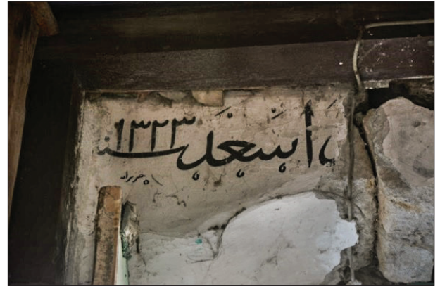
Şekil 3. Boyalı nakışların kitabesi. Fotoğraf: Muzaffer Karaaslan, 2020.