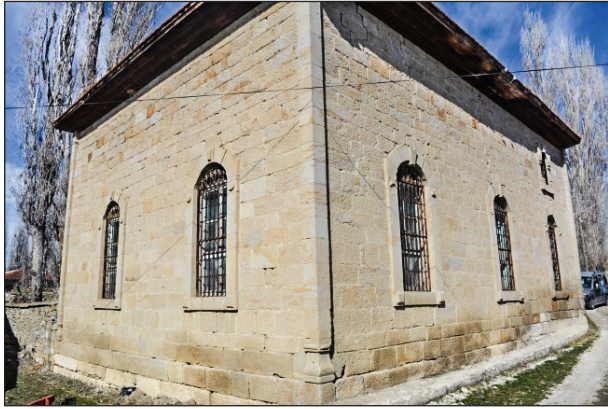
Şekil 6. Caminin güneydoğudan görünümü. Fotoğraf: Muzaffer Karaaslan, 2020.

Karahoca Köyü Camisi dikdörtgen planlı ve düzgün kesme taştan inşa edilmiştir (Şekil 6). Yapının minberi (Şekil 7), vaiz kürsüsü ve kadınlar mahfili ahşaptır (Şekil 8). Caminin örtü sistemi içten ahşaptan düz tavan, dıştan kırma çatıdır. Tavanda üzeri boyalı ahşap işlemler vardır (Şekil 9). Minare, yapının kuzeybatısında yer almaktadır.