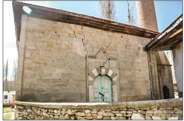
Şekil 1. Karahoca Köyü Camisi.

Çalışmanın amacı harap durumda olan Karahoca Köyü Camisi'nin boyalı nakışlarını ve duvar resmini incelemek