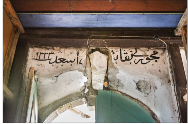
Şekil 26. Sanatçı kitabesi.

dolayı Muhammed isminin bulunduğu sıva düşmüştür. Ayrıca burada senenin hemen altında oldukça küçük Hür Murad yazısı daha vardır (Şekil 26).