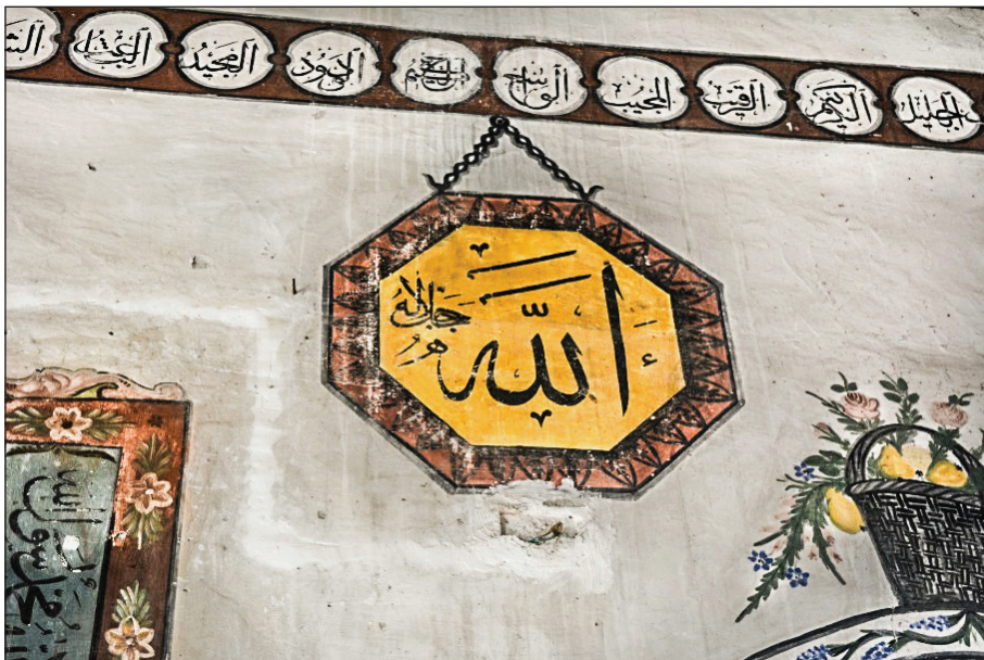
Şekil 21. Levha tasviri.