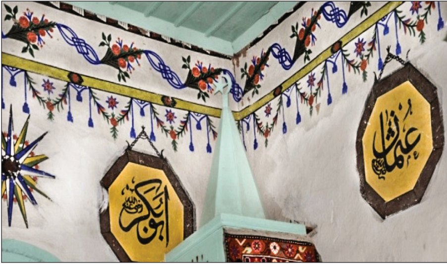
Şekil 29. Kırşehir Hüseyin Ağa Camisi bezemeleri.

Sultan Ahmed Cami tasviri ise yine Ankara, Kırşehir ve Nevşehir karşılaştırmalarında birbiriyle örtüşen imgerlendendir. Hüseyin Ağa Cami, Emine Hanım Cami ve Gümüşkent Köy Odası'ndaki örnekler de Karahoca Köyü Camisi'ndeki Sultan Ahmed Camisi'nin tasviri gibi tek boyutlu ve sadece mimari ayrıntılarıyla verilmiştir. Hatta resimlerin serbest fırça tekniğinden ziyade bir kalıp yardımıyla yapıldığı anlaşılmaktadır (Şekil 30 ve 31).