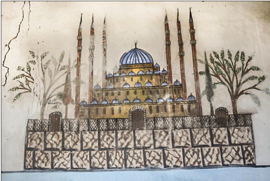
Şekil 22. Sultan Ahmed Camisi'nin tasviri.

Osmanlı dönemi duvar resimleri ve boyalı nakışların en önemli sorunsallarının başında sanatçı gelmektedir. Bezemelerin büyük bir çoğunluğunda sanatçı imzası olmadığı için eserler anonim kalmaktadır. Karahoca Köyü Camisi'ni bu durumdan ayıran şey yapıda sanatçı adının geçiyor olmasıdır. Sanatçı ismi giriş kapısının üzerinde ve doğu duvarındaki madalyonda yazılıdır. Doğu duvarındaki madalyonda yukarıda da bahsedildiği gibi Harrerehu Muhammed Esad sene 1323 (Şekil 25), giriş kapısında ise Mucurlu Nakkaş... Esad sene 1323 okunur. Kapıda kilit taşının hasar görmesinden