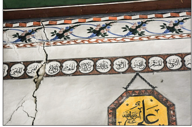
Şekil 24. Madalyon içlerinde Esmâü'l Hüsnâ. Fotoğraf: Muzaffer Karaaslan, 2020.