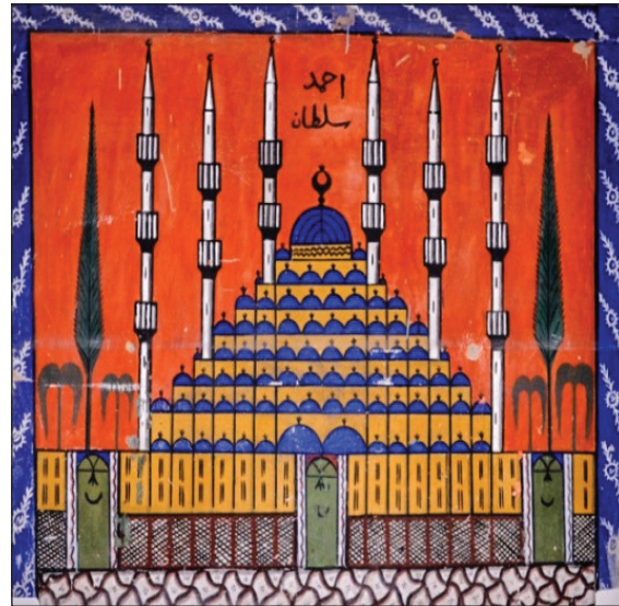
Şekil 31. Kırşehir Emine Hanım Camisi'ndeki Sultan Ahmed Cami'nin tasviri. Kaynak: Tali, 2013, s. 524.