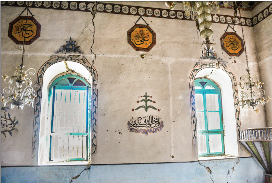
Şekil 11. Camideki boyalı nakışlar. Fotoğraf: Muzaffer Karaaslan, 2020.