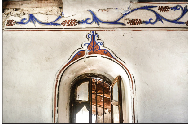
Şekil 17. Kadınlar mahfilindeki pencere. Fotoğraf: Muzaffer Karaaslan, 2020.

Yapıda en fazla karşılaşılan kompozisyonlardan biri vazo/sepet düzenlemesidir. Bu tür tasvirler mihrabın ve pencerelerin üzerindedir. Mihrabın üstündeki vazo düzenlemesi form olarak diğerlerinden ayrılmaktadır (Şekil 18). Burada üç kaideli, mavi renkte ve üzerinde çiçek motifleri olan bir vazo tasviri vardır. Vazonun içinden kenarlara doğru mavi, pembe ve yeşil renklerde çeşitli çiçek ve yapraklar sarmaktadır.