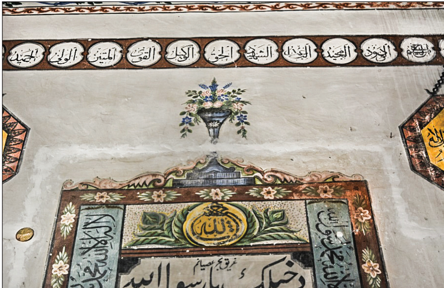
Şekil 18. Mihraptaki vazo düzenlemesi.