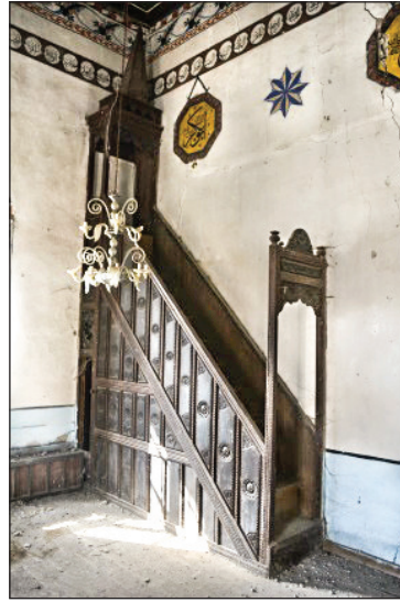
Şekil 7. Caminin minberi. Fotoğraf: Muzaffer Karaaslan, 2020.