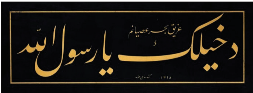
Őekil 27. 'Garik-i bahr-i isy nım dahilek ya Res lullah' yazılı levha.

Yapıdaki levha tasvirlerinin birebir benzerlerini tek levha olarak da g rmek m mk nd r. Allah, Muhammed, d rt halifenin ismi ile Hasan ve H seyin'in isimlerinin birok kopyası vardır. Bu isimlerin yanı sıra pop ler olan bazı yazılar da yine yapıda karřımıza ıkmaktadır. Mihraptaki Mařallah ile Garik-i bahr-i isy nım dahilek ya Res lullah yazılarının eřitli kopyaları bilinmektedir (Őekil 16, 17, 18, 19, 20, 21, 22, 23, 24, 25, 26 ve 27). Levhalara yansıyan bu pop ler yazılar bir beđenin g stergesi olmasının yanı sıra sanatıların esin kaynaklarını da ortaya ıkarmaktadır. Levha tasvirlerinin yanı sıra yine yapıda madalyonlar ve ereveler ierisinde Kur'an'dan ayetler, Kelime-i Tevhid ve Esm 'l H sna gibi eřitli yazılar da vardır. Yapıdaki yazıların genel  zelliđi Osmanlı'nın b t n topraklarında karřılařabilen ve pop ler olduđu anlařılan yazıların kullanılmasıdır. Yapının bezeme repertuarında yođun bir Őekilde yazıların olması olduka ilgi ekicidir ve camiye ayrıcalıklı bir konuma y kseltmektedir. Ayrıca bunların nesih ve s l s t r nde yazılmaları sanatıların yazı t rlerini iyi bildiklerini g stermektedir.