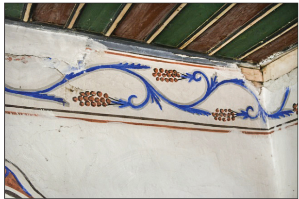
Şekil 15. Kadınlar mahfilindeki tavan eteği. Fotoğraf: Muzaffer Karaaslan, 2020.