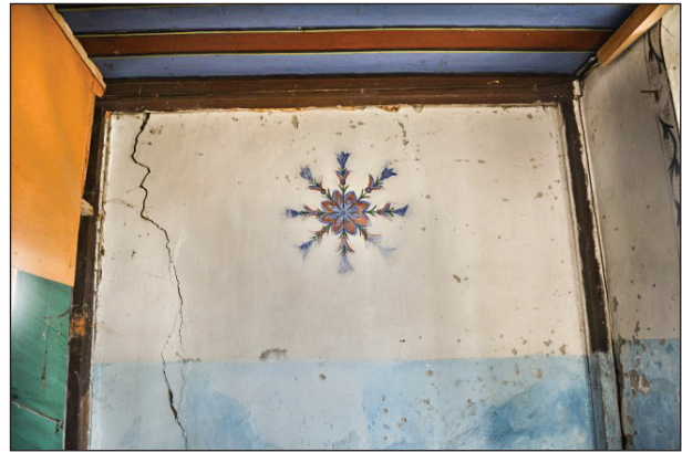
Şekil 13. Kuzey duvarındaki bitkisel bezeme. Fotoğraf: Muzaffer Karaaslan, 2020.