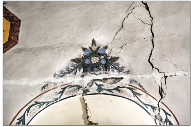
Şekil 20. Sepet düzenlemesi. Fotoğraf: Muzaffer Karaaslan, 2020.

Camideki bezemeler arasında sekiz levha tasviri vardır (Şekil 21). Bu levhalar sekiz kenarlı ve zincirlerle duvara asılı gibi resmedilmiştir. Levhaların çerçeveleri kahve-