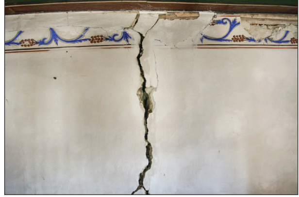
Şekil 33. Duvarlardaki ayrılmalara bir örnek.

Karahoca Köyü Camisi'ndeki boyalı nakışlar ve duvar resmi, taşra üslubunun bir örneğidir. Yapıdaki bezemeler üslup açısından 19. yüzyılın sonu 20. yüzyılın başlarından itibaren genellikle İç Anadolu ve kısmen Ege Bölgesi'nde yapılan örneklerin benzerleridir. Seçilen bezemeler köken olarak daha eskilere dayanmakla birlikte işleniş açısından 20. yüzyılın başlarındaki beğenin yansımasıdır. 18. ve 19. yüzyıla ait duvar resimlerinde başkent ve taşradaki sanatçıların farklı üsluplarda resimler yapmış olmalarına rağmen bazı ortak kaygıları vardır. Taşrada çok ustaca olmasa da sanatçıların renk tonlamaları ve optik perspektif kurallarına yetenekleri veya bilgileri doğrultusunda