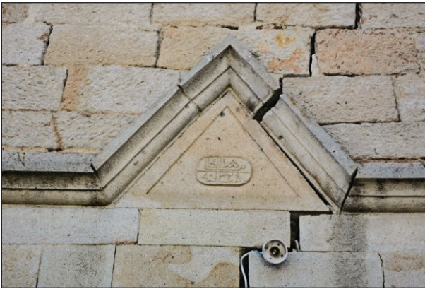
Şekil 4. Caminin giriş kapısındaki kitabe.