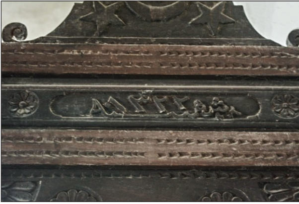
Şekil 2. Caminin minber kitabesi. Fotoğraf: Muzaffer Karaaslan, 2020.

Cami'deki tarihler yapının tamamlanmasının uzun yıllar sürdüğünü göstermektedir. Giriş kapısındaki 1906-1907