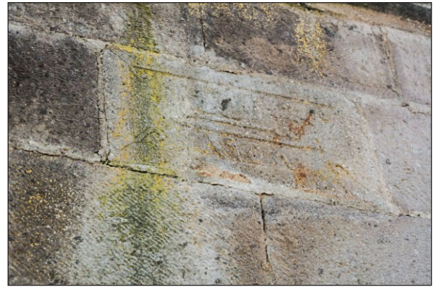
Şekil 5. Caminin minare kitabesi.