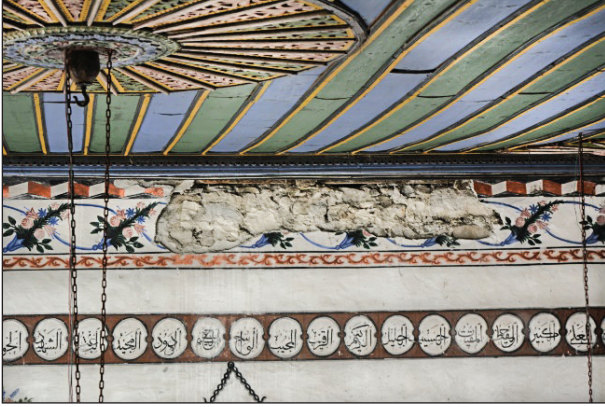
Şekil 32. Bezemelerdeki dökülmelere bir örnek.

Tali, Hüseyin Ağa Camisi'ndeki bezemelerin 1939'da Nakkaş Halil tarafından yapıldığını ve benzer kompozisyon ve üsluba sahip Emine Hanım Camisi'nin bezemelerinin de aynı sanatçı tarafından yapılmış olabileceğini belirtmektedir (Tali, 2013, s. 511). Tay ise Kırşehir'deki camilerde adı geçen Nakkaş Halil'in Gümüşkent Köy Odası'ndaki süslemelerde de çalışmış olabileceğini düşünmektedir (Tay, 2018, s. 250). Bu bilgiler Kırşehir'deki duvar resimleri ve boyalı nakışlarda yerleşmiş bir ekolün olduğunu göstermekle birlikte yarattıkları sanat beğenisini gezici sanatçılar aracılığıyla yakın kentlere taşıdıklarını da kanıtlamaktadır. Kırşehir'de oluşmuş bir ekolün Osmanlı döneminde Ankara'da izlerinin takip ediliyor olması oldukça önemlidir. Bu durum Ankara'da gezici sanatçıların çalıştığı bilgisini daha da güçlendirmektedir. Bunun yanı sıra kültür aktarımında bu sanatçıların etkisini bir kez daha ortaya çıkarmaktadır.