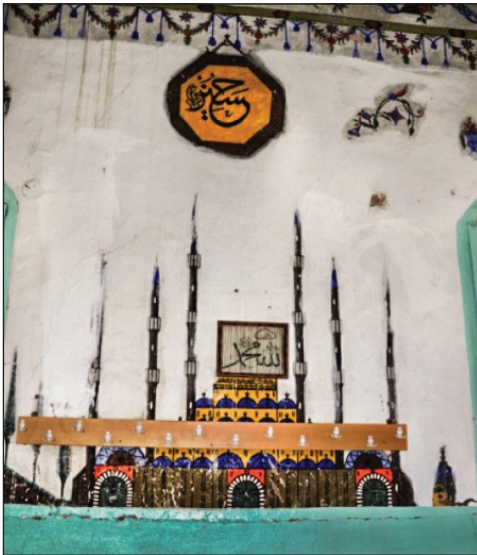
Şekil 30. Hüseyin Ağa Camisi'ndeki Sultan Ahmed Cami tasviri.