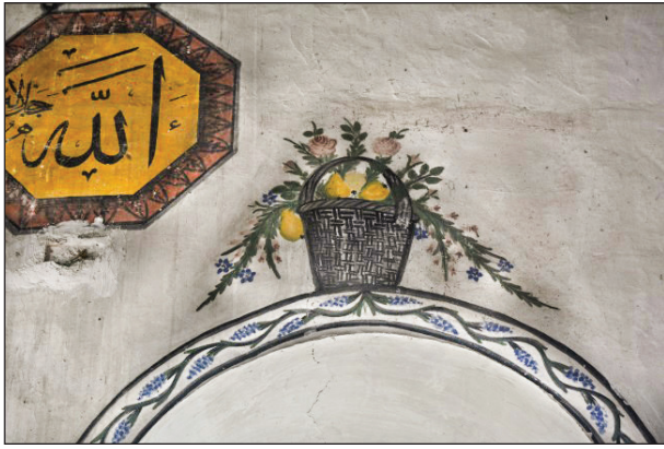
Şekil 19. Sepet düzenlemesi.

Pencerelerin üzerindeki sepet düzenlemeleri ikiye ayrılmaktadır. Güney duvarındaki pencerelerin üzerinde sepet içerisinde çeşitli çiçekler ve armut tasvirleri vardır (Şekil 19). Bu duvardaki sepet düzenlemeleri kompozisyon ve işleniş açısından birbiriyle örtüşmektedir. Diğer sepet düzenlemeleri ise doğu duvarındaki pencerelerin üzerindedir (Şekil 20). Burada aynı kompozisyonda içinde farklı çiçeklerin olduğu bir sepet tasviri vardır. Çiçekler sepetten kenarlara doğru sarkmaktadır. Camideki sepet tasvirleri ufak farklılıklarla birbirine benzerdir. Tasvirler, mavi, yeşil, sarı, siyah, gri ve pembe renklerle boyalıdır.