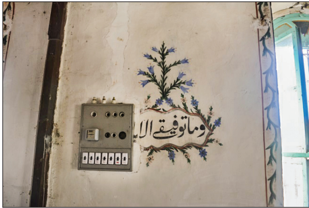
Şekil 12. Doğu duvarındaki boyalı nakışlar.

Karahoca Köyü Camisi'nin boyalı nakışları arasındaki bir diğer kompozisyon geometrik bezemelerdir. Bu tür nakışlar harim duvarlarında, kadınlar mahfilindeki pencerede, tavan eteklerinde ve mihraptadır. Duvarlarda bir