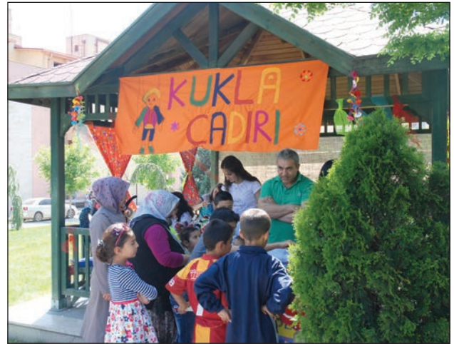
Şekil 8. Kukla çadırı.