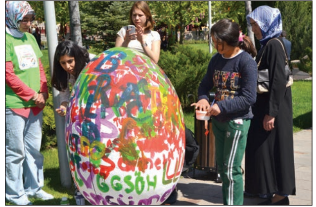
Şekil 12. Boyanabilir yumurta maketi.

Hamamönü Hıdırellez Şenlikleri'nde en çok rağbet gören uygulamalardan biri de dilek ağacına dilek bağlama, dilek yazma ve kismet açma ile ilgili uygulamalardır (Şekil 13 ve Şekil 14). Bu uygulamaların bu denli rağbet görmesi, ister kentte ister köyde yaşasın tüm insanların olmasını arzu ettiği şeylere kavuşma isteğinin bir sonucu olarak değerlendirilebilir. Ancak bu uygulamaların aynı zamanda katılımcıların şenliklere aktif olarak katılabildikleri etkinlikler olduğu da göz ardı edilmemelidir. Masal Çadırı, Dede Korkut Çadırı, Orta Oyunu, Kukla, Meddah Çadırı,