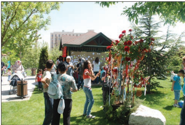
Şekil 13. Dilek ağacı.