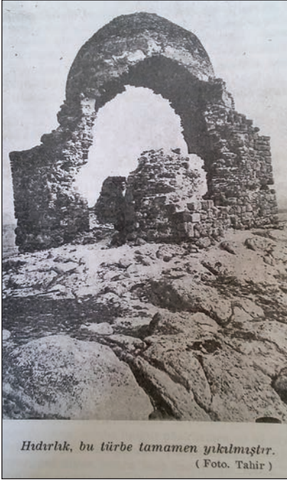
Şekil 2. 1935’li yıllarda Hıdırlıktepe.

Bu tepenin Osmanlı Devleti döneminde Hızır Tepesi, Cumhuriyetle birlikte Hıdırlık Tepe olarak adlandırıldığı, geçmişten günümüze yerleşim yeri olarak kullanıldığı, Ankara’nın hakim tepelerinden biri olması nedeniyle Anıtkabir’in buraya yapılmasının planlandığı ancak sonrasında vazgeçildiğine ilişkin bilgiler bulunmaktadır (Altındağ’ın Sosyo-Kültürel, 2011, ss. 36-37). Bu tepenin eteklerinde 1950’lerden sonra gecekondulaşmanın başladığı ifade edilmektedir (Erdoğan, Günel ve Kılıcı, 2008a, s. 92).