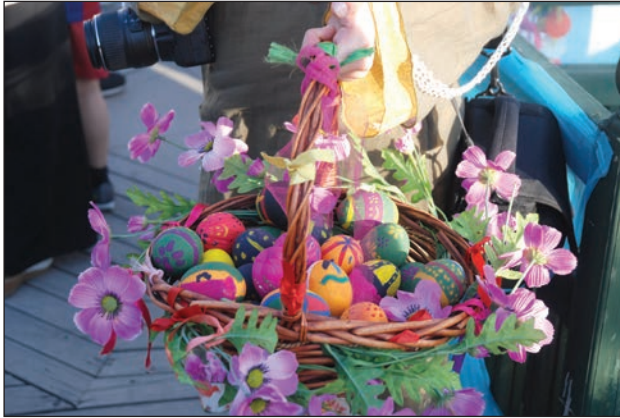
Şekil 11. Boyanmış yumurtalar.

Yumurta boyama ve tokuşturma Hıdırellez'de gerçekleştirilen uygulamalardan biridir (Şekil 11). Doğurganlık, yeniden doğuş ve bereket ile ilişkilendirilen yumurta, soğan kabuklarıyla, kök boylarıyla boyanmakta ve haşlanmaktadır. Hıdırellez günü yumurtalar tokuşturulur ve kırılan yumurta kırana verilir. Hamamönü Hıdırellez