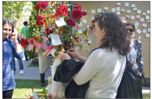
Şekil 14. Katılımcılar dileklerini dilerken.