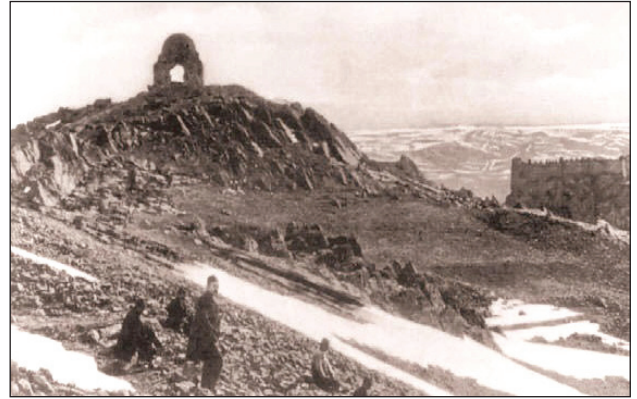
Şekil 1. 1900'lü yıllarda Hıdırlıktepe.

Ankara kırsalındaki Hıdırellez kutlama mekânlarının yanı sıra Ankara kent merkezinde de Hıdırlık Tepesi adıyla bilinen bir tepede Hıdırellez kutlamalarının gerçekleştiği bilinmektedir (Şekil 1 ve Şekil 2). Hıdırlık Tepe, Ankara Kalesi'nin karşısında yer alır ve Ankara'nın en güzel manzarasının görülebileceği yer olarak tanımlanır. Evliya Çelebi Seyahatnamesinde buradan Hazret-i Hızır Makamı olarak bahseder: "... Ankara Kalesi'nin doğu tarafında kaleye eğimli bir yüksek dağ üzerinde Hazret-i Hızır makamı ziyareti: Bölge halkının dinlenme ve mesire yeri her yeri gören yüksek bir türbedir ki bütün Ankara ovası bu kalemin renginde yapraklar görülür "(Günümüz Türkçesiyle, 2012, s. 531).