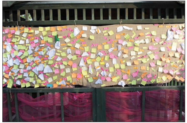
Şekil 16. Dilek panosu