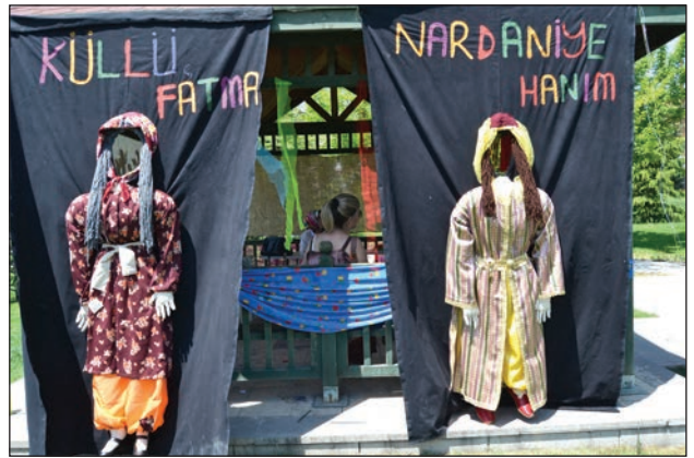
Şekil 18. Masal kahramanları Küllü Fatma ve Nardaniye Hanım figürleri.