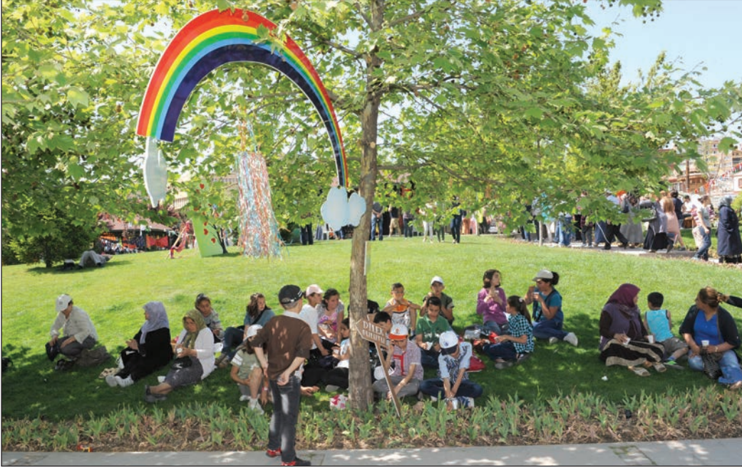
Şekil 5. Şenlik Alanı - Mehmet Akif Ersoy Parkı.