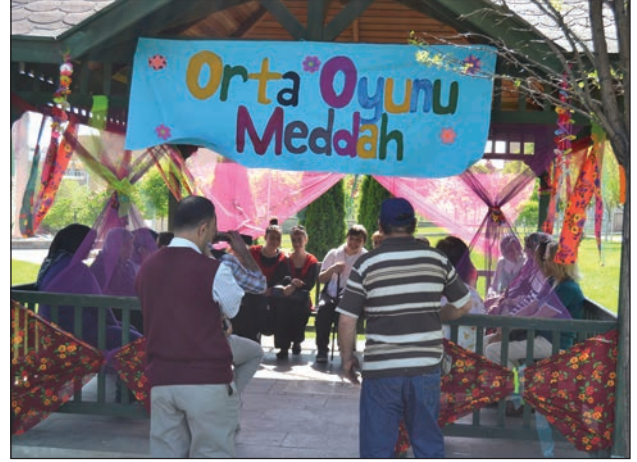
Şekil 7. Orta Oyunu-Meddah çadırı.

Âşık Çadırı, Dede Korkut Hikâyeleri, Masal Çadırı, Orta Oyunu, Meddah, Kukla gösterileri; gelenekte olmamasına rağmen, Hıdırellez'le ilişkilendirilerek kimi zaman da etkinliğin daha eğlenceli bir hale dönüştürülmesi amacıyla şenliğe eklenen uygulamalardandır (Şekil 7 ve Şekil 8). Örneğin, Dede Korkut Hikâyeleri'nden Boğaç Han, tiyatrolaştırılarak oynanmaktadır. Bu hikâye, Hıdırellez ile ilişkili olmamasına rağmen içerisinde Hızır'ın geçtiği