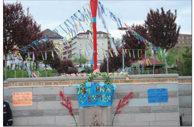
Şekil 9. Temsili Âb-ı Hayat çeşmesi.

Bu anlatıların kaybolması Hıdırellez'in içeriğinde ve kutlanış amacında da değişikliklerin olmasına yol açmaktadır. Gelenekte kuşaktan kuşağa sözlü bir biçimde aktarılan anlatılar, Hamamönü Hıdırellez Şenlikleri'nde görselleştirilerek anlatılmaktadır. Temsili bir ab-ı hayat çeşmesi ve boyanabilir balık maketleri kurgulanmakta, Hızır ve İlyas'a ilişkin anlatı bu yolla dinleyicilere anlatılmaktadır (Şekil 9 ve Şekil 10). 12 Anlatılan hikâyenin