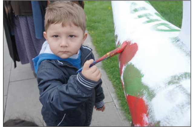
Şekil 10. Kurutulmuş balıkları temsil eden boyanabilir balık maketleri.