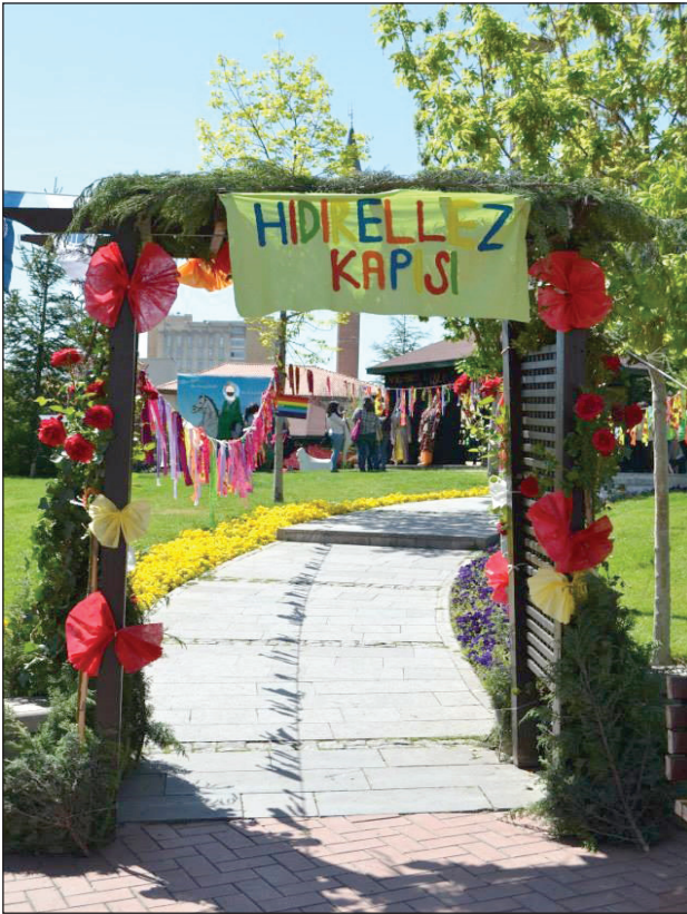
Şekil 6. Hıdırellez Kapısı - Mehmet Akif Ersoy Parkı.

tarafından belirlenen bu mekânın seçilme nedeni, şenliğe katılacak kişiler için geniş ve açık bir alan imkânı sunmasıdır. Geleneksel kutlama mekânlarında olduğu gibi kenarında göl, akarsu gibi su bulunmamaktadır.