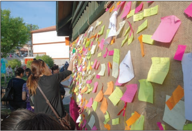
Şekil 15. Dilek panosu.

Hamamönü Hıdırellez Şenlikleri'nde Masal Çadırı'nda gerçekleştirilen masal anlatma uygulamaları ile ilişkili olarak Küllü Fatma ve Nardaniye Hanım gibi masal kahramanları, birlikte resim çektirilebilecek figürlere dönüştürülmüştür (Şekil 17 ve Şekil 18). Masal Çadırı'nda masalları dinleyenler sonrasında bu masal kahramanlarının kılığında fotoğraf çektirebilmektedirler. Kahramanların