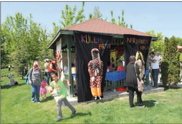
Şekil 17. Masal kahramanları Küllü Fatma ve Nardaniye Hanım figürleri.