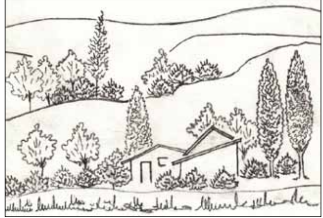
Şekil 4. Evciler kırsal yerleşiminde mevcut bitki örtüsünün skeç çizimi. Çizim: Yekta Köse, 2016.