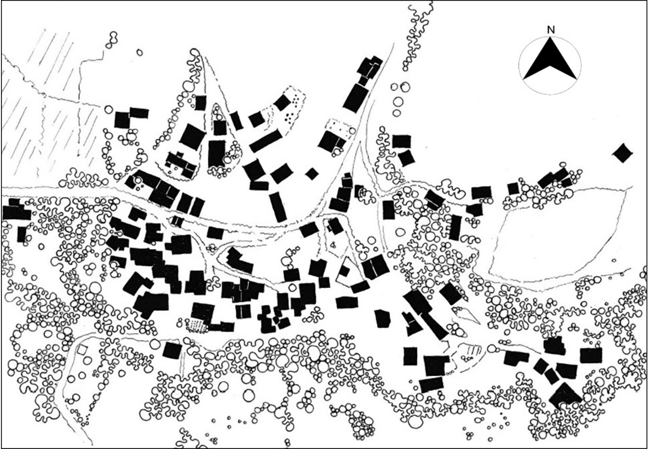
Şekil 5. Evciler Yerleşimi yapıların ve bitkilerin plan çizimi. (Uydu görüntüsü baz alınarak çizilmiştir).

Kültürel kimlik bileşenleri-I insanların doğayı kullanarak bıraktıkları izlerdir. Yerleşimlerde insanların izi olan üretim şekilleri peyzaj özelliklerinin ve kimliğinin oluşmasında önemli bir etkidir. Kültürel kimlik bileşenleri-I doğal bileşenleri kullanarak insan eliyle oluşturulan üretim ve diğer peyzaj özelliklerini yansıtmaktadır. Kültürel kimlik bileşenleri-I yerleşimleri birbirinden ayıran özel-