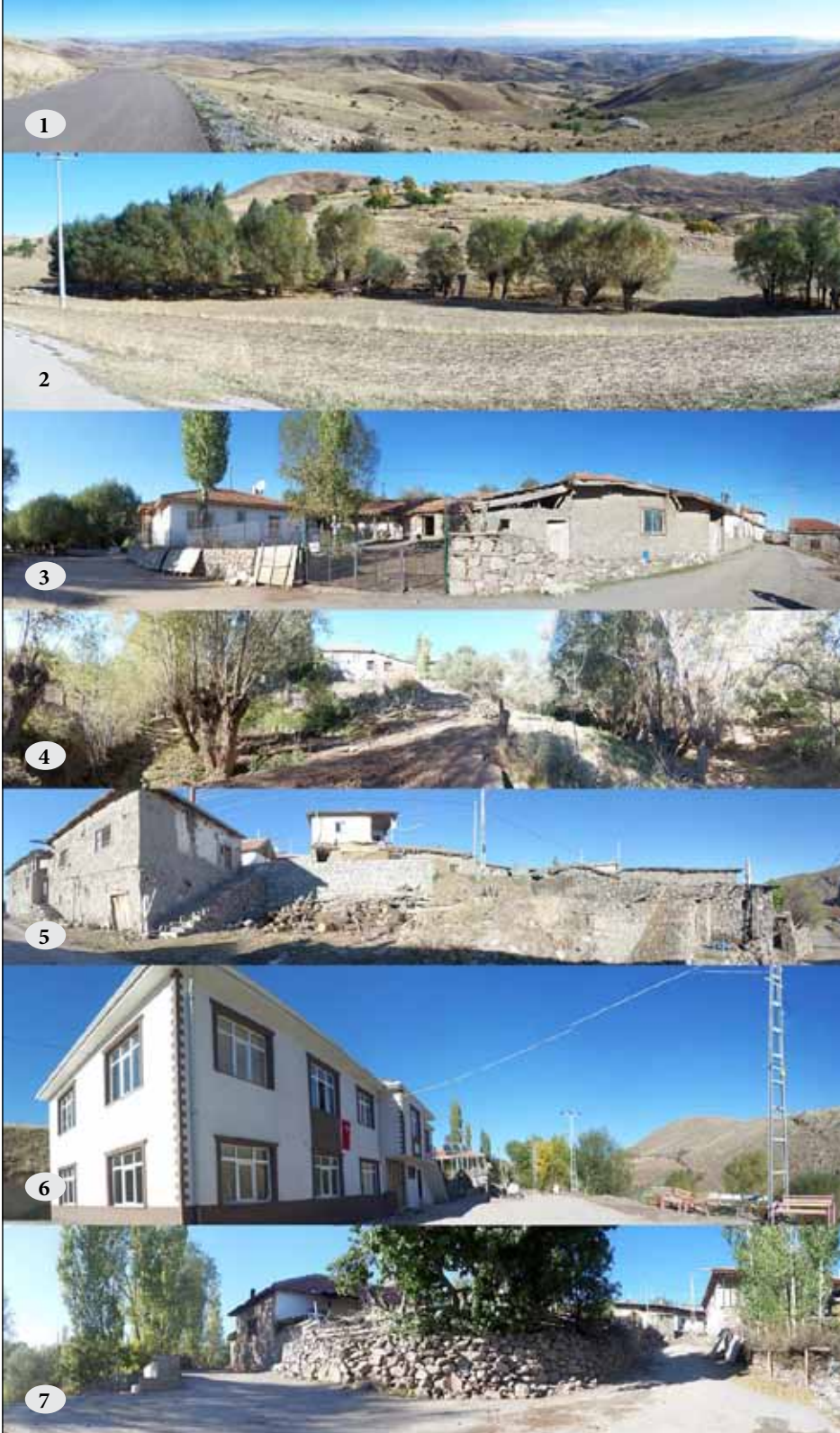
Şekil 7. Peyzaj Kimlik Özelliklerini Değerlendirme Matrisi - Algısal nitel özellik kimlik bileşenlerinin değerlendirilmesinde kullanılan görüntüler.