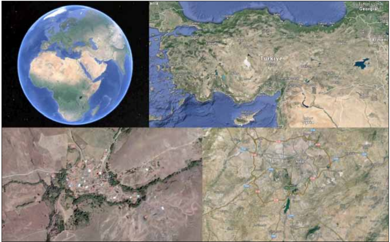
Şekil 1. Araştırma alanının coğrafi konumu.

Matrisin orijinal halini özetleyecek olursak; kırsal yerleşim peyzaj karakterini değerlendirmek için arazide doldurulmasını ve yerinde tespitleri içeren bir süreçtir. Matris üzerinde verilen ve ifade edilen bilgiler Çankaya Belediyesi, Türkiye İstatistik Kurumu (TÜİK), arazi alan araştırmaları sırasındaki gözlemler ve halka uygulanan anketler ile elde edilmiştir. Matris beş ana bileşen içermektedir, bu bileşenler; doğal kimlik bileşenleri, kültürel kimlik bileşenleri (I), kültürel kimlik bileşenleri