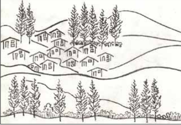
Şekil 3. Evciler Mahallesi'nin karşı vadiden bakıldığında görünüşünün skeç çizimi. Bitki örtüsünün yoğun olduğu yerler; su yüzeylerinin bulunduğu alanlar. Çizim: Yekta Köse, 2016.