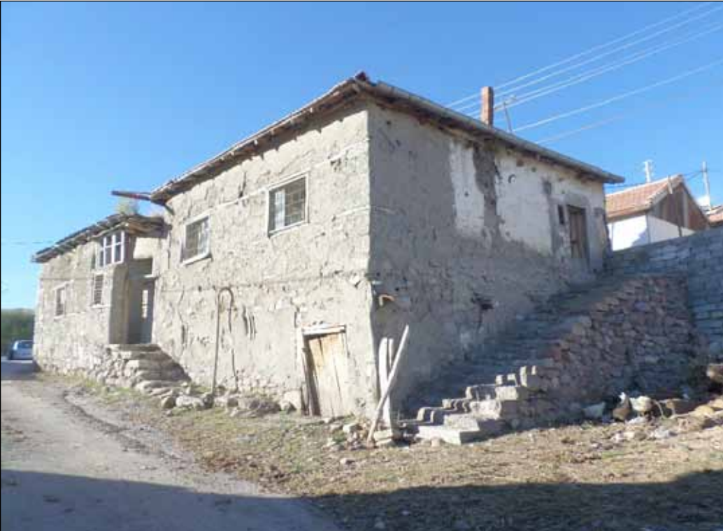
Şekil 6. Evciler Yerleşimi'nde bulunan eski bir yapı. Fotoğraf: Yekta Köse, 2016.

Kültürel bitki dokusu; mahallenin üretim peyzajına göre şekillenmiş, kırsal yerleşimde çoğunlukla tarımsal yüzeyler ve meralar bulunmaktadır. Kültürel bitki dokusu, peyzaj