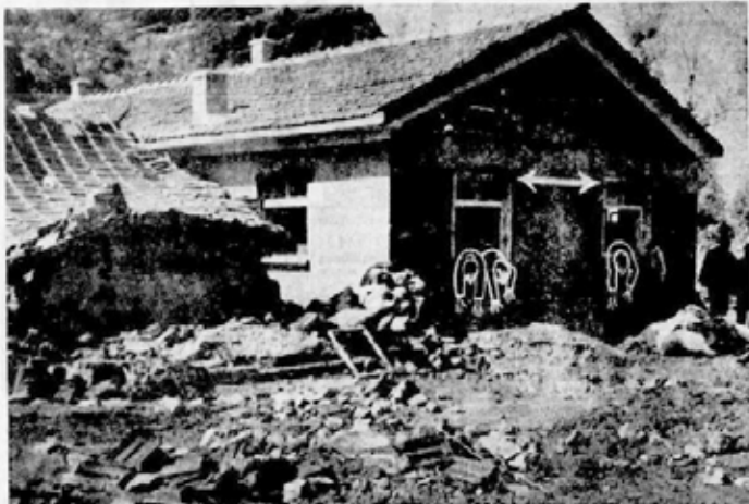
Bu evde 4 kişi boğuldu

Bayar seylip bölgesinde Çankırı'da 11 Eylül 1957 tarihinde meydana gelen sel felaketi, tahrip ettiği semtlerden resimler.