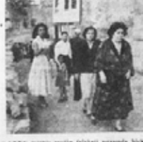
D. N. K. Meclis üyeleri felaketi sırasında büyük çabalarını gösterdiklerini ifade eden Meclis üyeleri. (D. N. K. Meclis üyeleri felaketi sırasında büyük çabalarını gösterdiklerini ifade eden Meclis üyeleri.)

DEVLET REİSİMİZ VE BAŞVEKİLİMİZ SEYLÂP SAHASINDA BİZZAT MEŞGUL OLDULAR