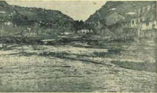
Ağır su suları Bentderesi mahallesinde ilerliyor. Bu bölgedeki sel felaketi her yıl tekrar eden bir felakettir.

Sel felaketi nedeniyle Ankara'nın birçok mahallesi sular altında kaldı. Sel felaketi nedeniyle Ankara'nın birçok mahallesi sular altında kaldı.