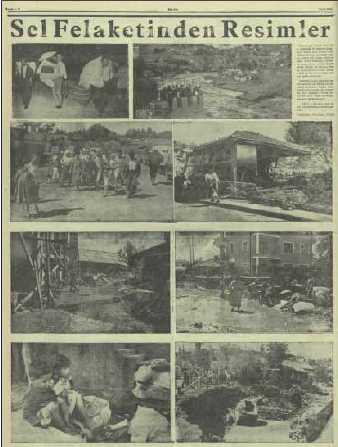
Şekil 13. 13 Eylül 1957 tarihli Ulus Gazetesi 6. sayfası.