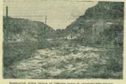
Bentderesi'deki sel felaketi nedeniyle bölgedeki birçok ev yıkıldı.

Can kaybının kesin sayısı belli değil. Mal kaybının ise milyonlarca liranın üstünde olduğu bildiriliyor. Sel felaketi nedeniyle Ankara'nın birçok mahallesi sular altında kaldı. Sel felaketi nedeniyle Ankara'nın birçok mahallesi sular altında kaldı.