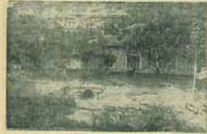
Sel felaketi nedeniyle Ankara'nın birçok mahallesi sular altında kaldı. Sel felaketi nedeniyle Ankara'nın birçok mahallesi sular altında kaldı.