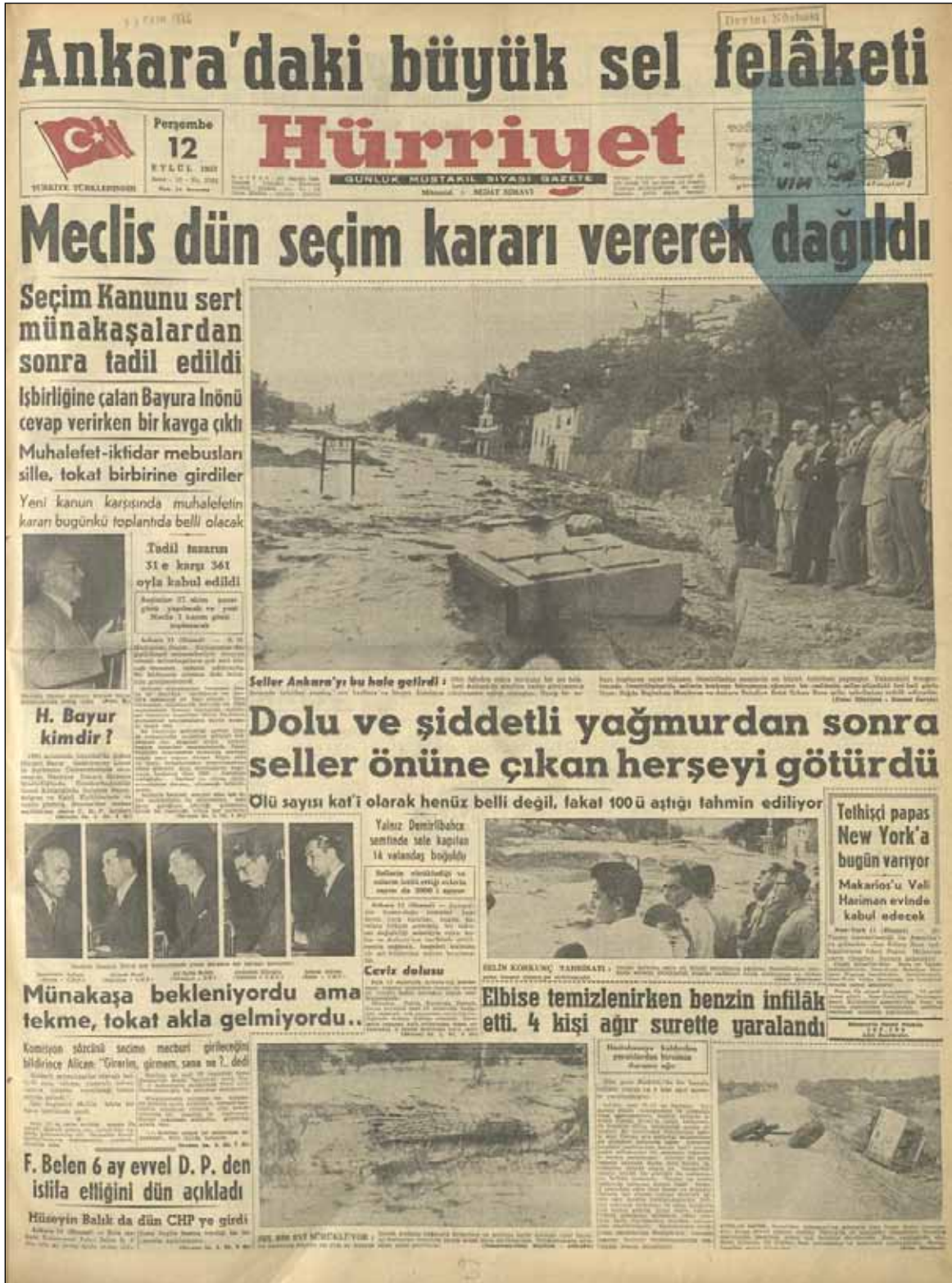
Şekil 8. 12 Eylül 1957 tarihli Hürriyet Gazetesi.