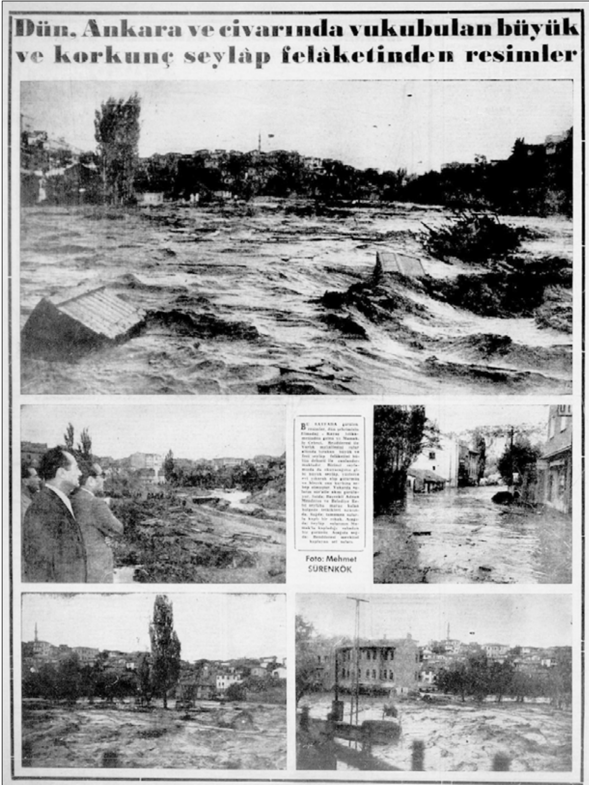
Şekil 12. 12 Eylül 1957 tarihli Zafer Gazetesi 8. sayfası.