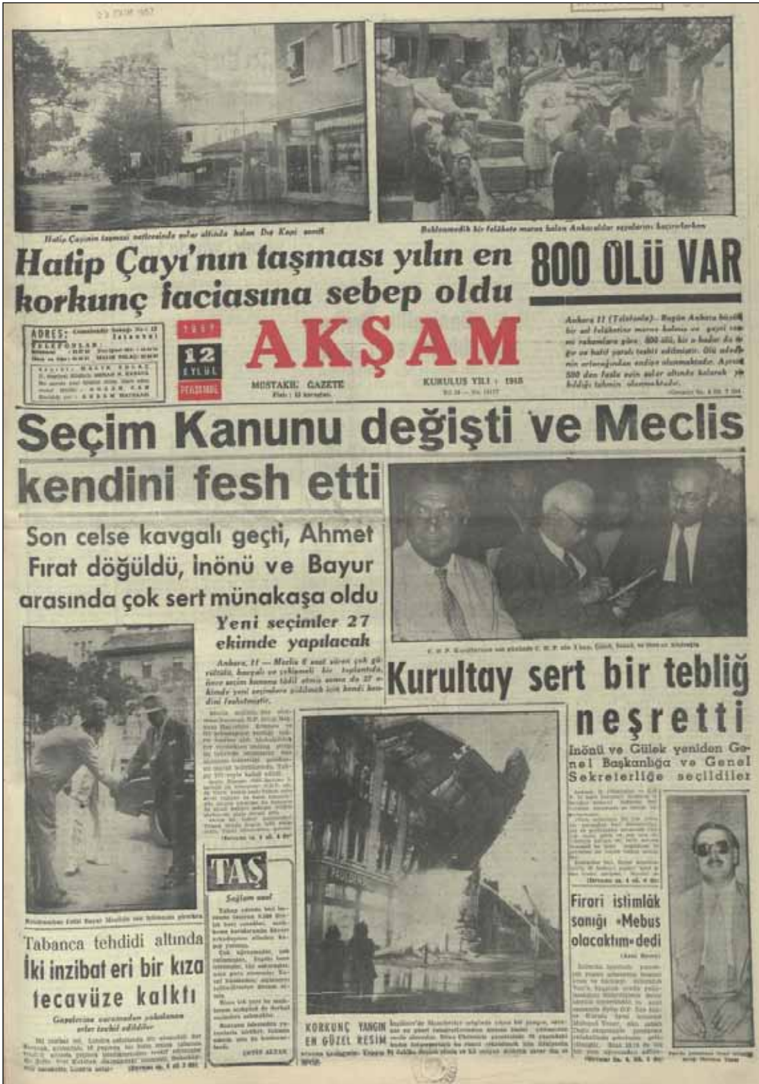
Şekil 6. 12 Eylül 1957 tarihli Akşam Gazetesi.