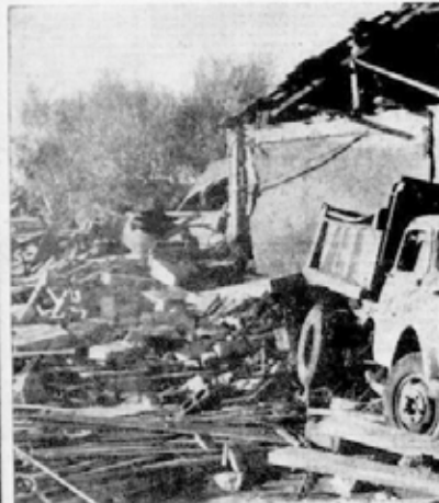
Selin müthiş tahribatı

Çankırı'da 11 Eylül 1957 tarihinde meydana gelen sel felaketi, tahrip ettiği semtlerden resimler.