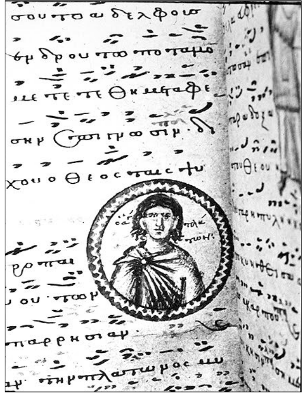
Şekil 6. Koutloumousiou Manastırı n. 412, fol. 51v, 14. yüzyıl, Aziz Platon.

Hristiyan inancına göre martirler hayatlarından vazgeçmekle diğer inananlara ilahi güçlerini göstermişlerdir. Böylece ölümün bir kurtuluş yolu olduğuna inanmışlar ve inandırmışlardır. Bu yüzden martirlerin ölüm yıldönümleri önemlidir ve Azizler Takvimi'ndeki konumlandırılan yerlerinin sözde ölüm yıldönümleri olduğuna inanılır. Ölüm onlar için bir kurtuluş, insanlık için de umut olmuştur. Bununla birlikte martirlerin ölümünden sonra adlarına inşa edilen martiriumlar önem arz etmeye başlamış ve her durumda manevi gücü vurgulanmıştır.