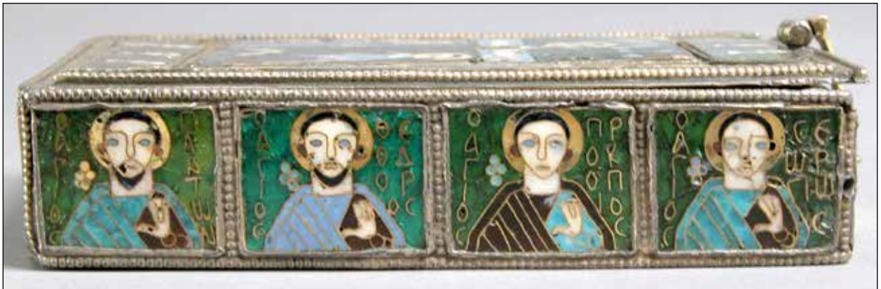
Şekil 2. Röliker, 9. yüzyıl başları, Aziz Platon ve diğer azizler.