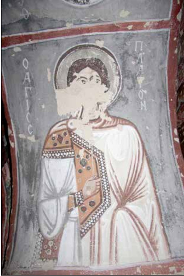
Şekil 3. Kapadokya Kılıçlar Kilisesi, duvar resmi, 10. yüzyıl (y) Aziz Platon.

Aziz Platon'u izleyebildiğimiz bir diğer örnek Kapadokya Kılıçlar Kilisesi resim programında bulunur (Şekil 3). Bizans kilise resim programlarında çok fazla tercih edilen aziz figürleri kiliselerin resim programlarında genel olarak kabul görmüş ve hiyerarşiyi takip ederek mesleki kategorilerine ya da daha nadiren aziz gününe göre gruplar hâlinde düzenlenmiştir. Kapadokya kiliselerinde genellikle Peygamberlerin madalyon içlerinde