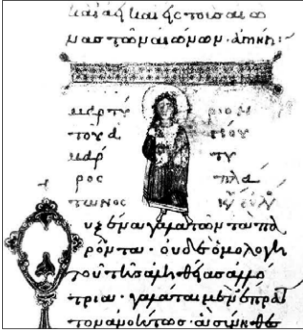
Şekil 5. Gl. Kongl. Saml. 167, fol. 27r, 11. yüzyıl, Aziz Platon.

öldürmek için görevlendirilen cellat dağlık bir arazide (Kampüs) betimlenmiştir. Cellat arkasını kendisine dönmüş olan Aziz Platon'a doğru kılıcını kaldırmış bir şekilde resmedilmiştir. Himationunun etek ve kol bilekleri ve halesinde altın rengi ile vurgulanan Aziz Platon ve Tanrı'ya yakarır biçimde betimlenmiştir. Eski Kilise Slavcası ile yazılmış yazıtta "kılıçla başı kesilmişti" 18 yazmaktadır. 19