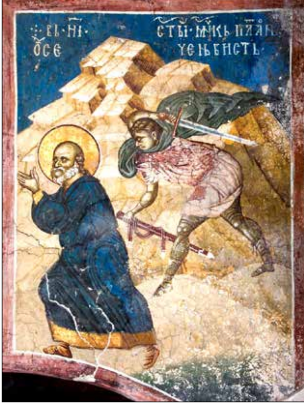
Şekil 7. Deçani Manastır Kilisesi, duvar resmi, 14. yüzyıl, Aziz Platon'un infazı.