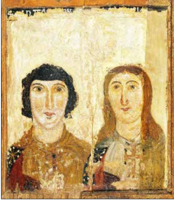
Şekil 1. İkona, 6. yüzyılın sonu 7. yüzyılın başı, Aziz Platon ve bir kadın martir.

Bir diğer örnek 9. yüzyılın başlarına tarihlenen Fieschi Morgan Staurotheke rölikeridir (Şekil 2). Burada Aziz Platon'un bir madalyonun içinde büst şeklinde betimlemesi bulunmaktadır (Art, 2012, s. 184). Söz konusu röliker, aynı amaca yönelik diğer Bizans rölikerleri gibi sürgülü kapaklı, sığ bir gümüş kutudur. Üst ve yanlarda altın mine tekniğinin uygulandığı altın plakalarla kaplanmıştır; altta bir süsleme bordürü içinde yıldızlı bir haç bulunur. Kapağın alt yüzünde kakma tekniğiyle İncil sahneleri ile zenginleştirilmiş dört bölme vardır. Kutunun iç kısmında, bir zamanlar strautekin içinde bulunduğu haç şeklinde bir boşluk vardır. Kapağın üst tarafında ise mine işinin kullanıldığı madalyonlar içinde aziz büstleri ile Bakire ve Aziz Ioannes arasında Çarmıh sahnesi bulunur. Çevre yüzlerinde de aralarında Aziz Platon'un da bulunduğu diğer azizler vardır (Dalton, 1912, s. 66). Sağ ve solunda "O ΑΓΙΟΣ ΠΛΑΤΩΝ" (Aziz Platon) yazıtının bulunduğu Aziz Platon'un betimlemesi kendisiyle birlikte betimlenen diğer azizlerle oldukça benzerdir. Genç, siyah saçlı ve sakallı resmedilmiştir.