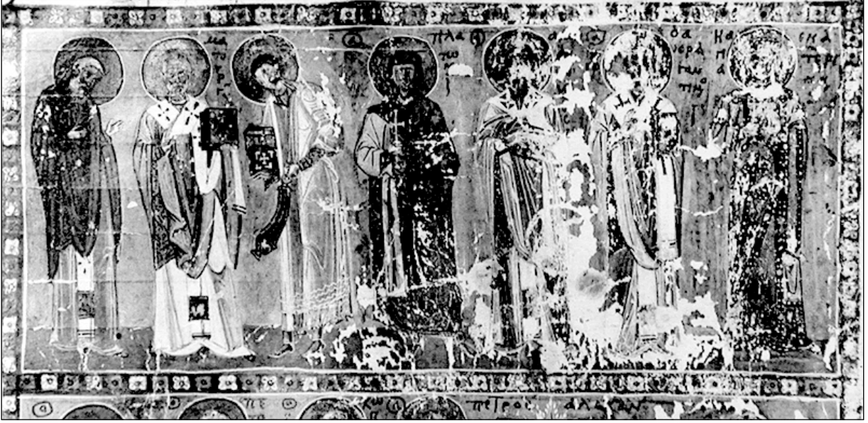
Şekil 4. Par. gr. 580, fol. 2v, 11. yüzyıl, Aziz Platon ve diğer azizler.

Korunmuş en iyi takvim döngüleri arasında olan günümüzde Biblioteca Apostolica Vaticana (Vatikan) Vat. gr. 1613 koduyla muhafaza edilen 976-1025 yılları arasına tarihlenen II. Basileios'un Menologion'unda her bir azize ayrı sayfa ayrılmıştır. El yazması resimlemelerinde azizlerin hayatta iken maruz kaldıkları işkence ya da infaz sahneleri işlenmiştir (Ševčenko, 1962; Nersessian, 1940-1941, ss. 104-125). Fol. 189 17 "ΜΗΝΙ ΤΩ ΑΥΤΩ ΙΗ. ΑΘΑΗCIC ΤΟΥ ΑΙΤΙΟΥ ΜΑΡΤΥΡΟC ΠΛΑΤΩΝΟC" (Aynı ayın 18'inde, Aziz Martir Platon'un Hatırasına) başlığıyla Aziz Platon'a ayrılmıştır. Sayfanın üst kısmında metin, alt kısmı ise resim bulunmaktadır. Aziz Platon'un yer aldığı sayfada bulunan resmin zemininde altın rengi kullanılmıştır. Sadece vücudunun alt kısmı beyaz bir örtüyle örtülmüş Aziz Platon eğilir pozisyonda betimlenmiştir. Hemen arkasında onu öldürmek için kılıcını çekmiş cellat bulunmaktadır. Arka planda dağlık bir manzara kullanılması Platon'un öldürüldüğü yerin Ankara dışında kırsal bir alanda olduğuna vurgu yapmak istenildiğini düşündürür.