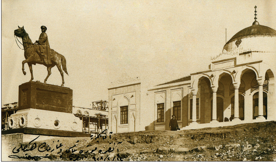
Şekil 2. Ercüment Ekrem'in şiirinde geçen Pietro Canonica'nın yaptığı heykel, 1928.