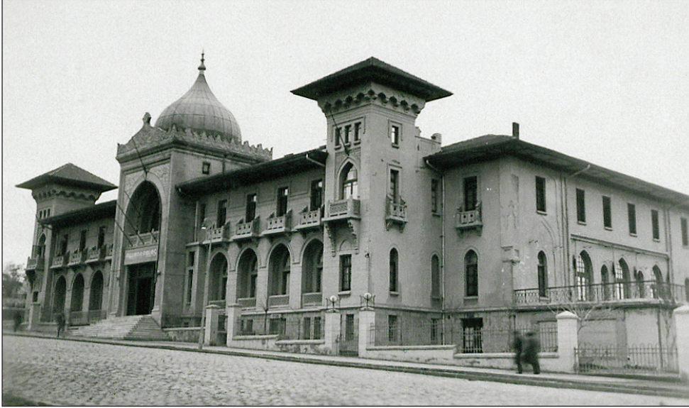
Şekil 6. Ankara Palası, 1933-1935.