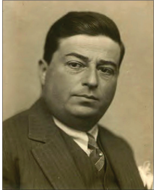
Şekil 1. Ercüment Ekrem Talu.

değişikliklerinden dolayı kendi tabiri ile Ankara İstanbul arasında mekik dokumaktadır. Ercüment Ekrem, Ankara'da bulunduğu zaman Siyasal Bilgiler Okulunda, Gazi Eğitim Enstitüsünde, Ankara Hukuk Fakültesinde, Polis Kolejinde, Gazi Terbiyede dersler vermiştir. Ayrıca Halkevlerinin gezgin konferansçısı olarak Erzurum, Zonguldak, Konya, Mersin gibi illerde konuşmalar yapmıştır. Talu, 1943'te eşi Hatice Hanım'dan ayrıldıktan sonra İstanbul'a döner (Karaca, 1993, ss. 33-34). Ercüment Ekrem'in biyografisini yazanlar bu tarihten sonra İstanbul'dan bir daha ayrılmadığını belirtiyorlar. Ankara'ya gelişleri varsa bile bunlar biyografisinde anılmayacak kadar sıradan ve kısa süreli seyahatler olmalıdır. Ercüment Ekrem'in Ankara'yla irtibatı konusunda verdiğimiz bu bilgiler, yazarın Ankara'da 1920 ile 1943 yılları arasında çeşitli görevler sebebiyle dört farklı zaman diliminde yaklaşık sekiz yıl ikamet ettiğini göstermektedir. Bahsi geçen yıllar, aynı zamanda Ankara'nın en kritik zamanlarıdır. Millî Mücadele, inkılaplar, yeni bir ulus inşası ve zihniyet dönüşümü gibi birçok mesele bu yılların gündemini teşkil etmektedir.