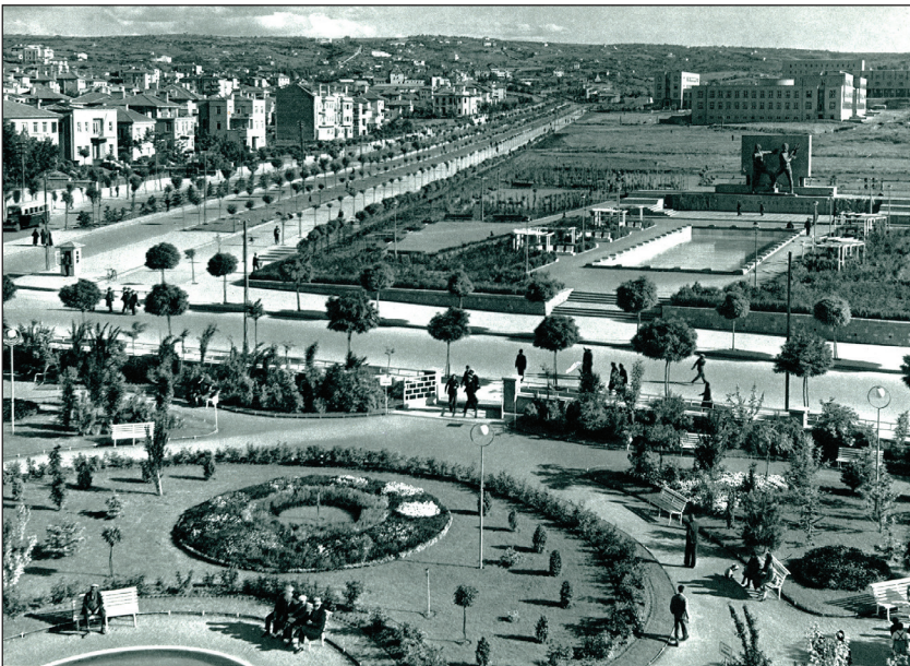
Şekil 3. Ercüment Ekrem'in “emniyet ve güven duygusu” oluşturduğunu düşündüğü yeni Ankara, 1930 (Fotografda Kızılay Parkı, Güven Park, Atatürk Bulvarı ve Bakanlıklar görülmektedir).

Ercüment Ekrem'in hemen her yazısında -o dönemin birçok yazarı gibi- ideolojik farklılığı belirginleştirecek biçimde İstanbul Ankara karşılaştırmasına gitmesi, Ankara'yı birçok bakımdan üstün gösterme çabası dikkat çekicidir. Söz gelişi Ercüment Ekrem, Yenişehir'de geniş bir modern bir mahalle teşkil eden Bakanlıkların (Şekil 3), oralara işi düşüp de gidenlerin üzerinde, bir emniyet ve güven duygusu oluşturduğunu, bu temiz güzel ve muntazam binaların içinde dağınıklık çirkinlik ve çapraşıklığın olamayacağı hissini verdiğini iddia eder. Ona göre Osmanlının meham-ı umur (önemli işler) değir-