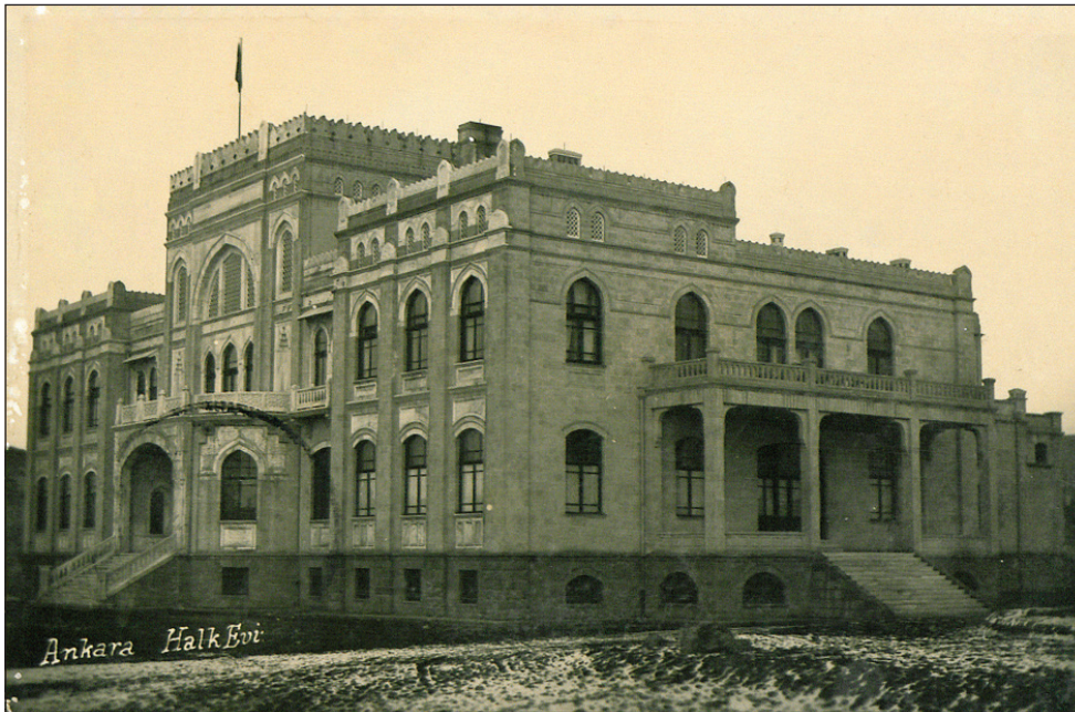
Şekil 8. Ankara Halkevi, 1930.

Talu kimi yazılarında, sıklıkla ele alıp değerlendirilen konulara -Ankara'daki konut sorunu gibi- temas etmekle birlikte yazılarının büyük çoğunluğunda özgün bir tavra