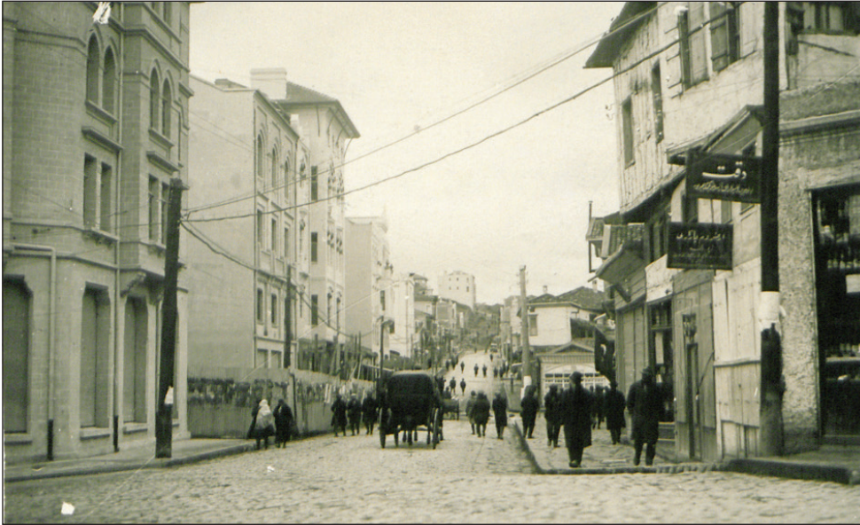
Şekil 4. Anafartalar Caddesi, 1926-1927.

Ercüment Ekrem'in Ankara'da katıldığı önemli bir etkinlik olarak 1 Mayıs 1939 tarihli "10 Yıllık Türk Neşriyat Sergisi"ni anabiliriz. Harf İnkılabının 10. Yılı münasebetiyle Maarif Bakanlığı tarafından organize edilen serginin amacı 10 yılda yeni harfler ile yapılan neşriyatı kamuya tanıtmaktır. Ercüment Ekrem'in aktardığına göre bir karşılaştırma yapmak için bu etkinlikte Arap harfli metinler de sergilenmiştir. Ercüment Ekrem de bir karşılaştırma yaparak yeni harflerin "medeni, selis ve sehil" bir