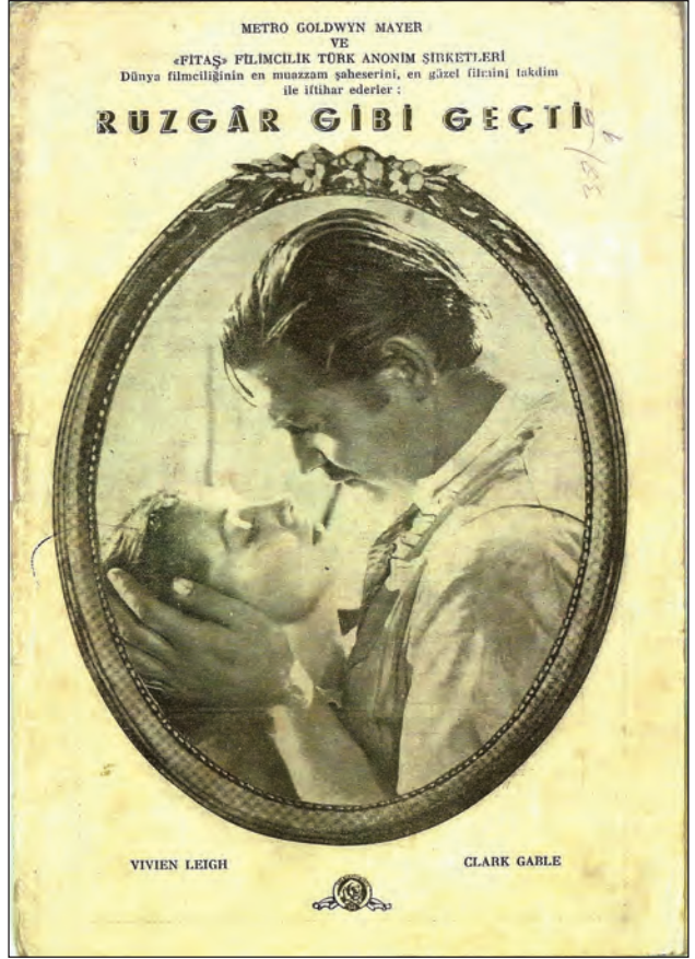
Şekil 3. Rüzgâr Gibi Geçti filminin tanıtım broşürü.

Aynı yılın Nisan ayı başlarında Orson Welles'in sinemaya uyarladığı Othello 'yu ( The Tragedy of Othello: The Moor of Venice , 1952) izlediğinde, sinemanın Shakespeare'in eserini fazlasıyla değiştirdiği kanısına varır. Öyle ki ona, Shakespeare'in Othello 'su demekte zorlanıyordur. Üstelik filmi beğenip beğenmediğinden de emin değildir. Gerçi birtakım güzel resimler izlemiştir, filmin bir iki yeri de insanı sarıyordu; ancak kıskançlığın yakıcı bir duygu olarak Othello 'nun yüreğinde usul usul kök salışı, sinema