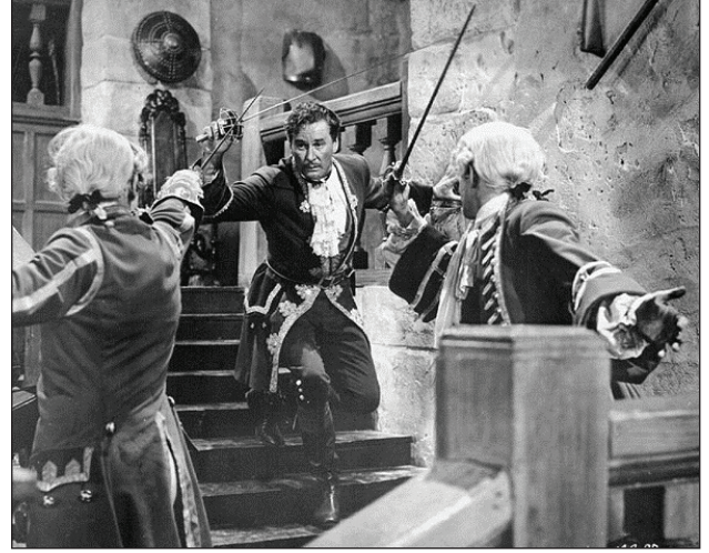
Şekil 8. Erol Flynn Korsanlar Kralı’nda.

İlerideki günlerde sinema salonlarına bir kez daha yolu düşen Ataç, 6 Nisan Salı günü öğleden sonra Büyük