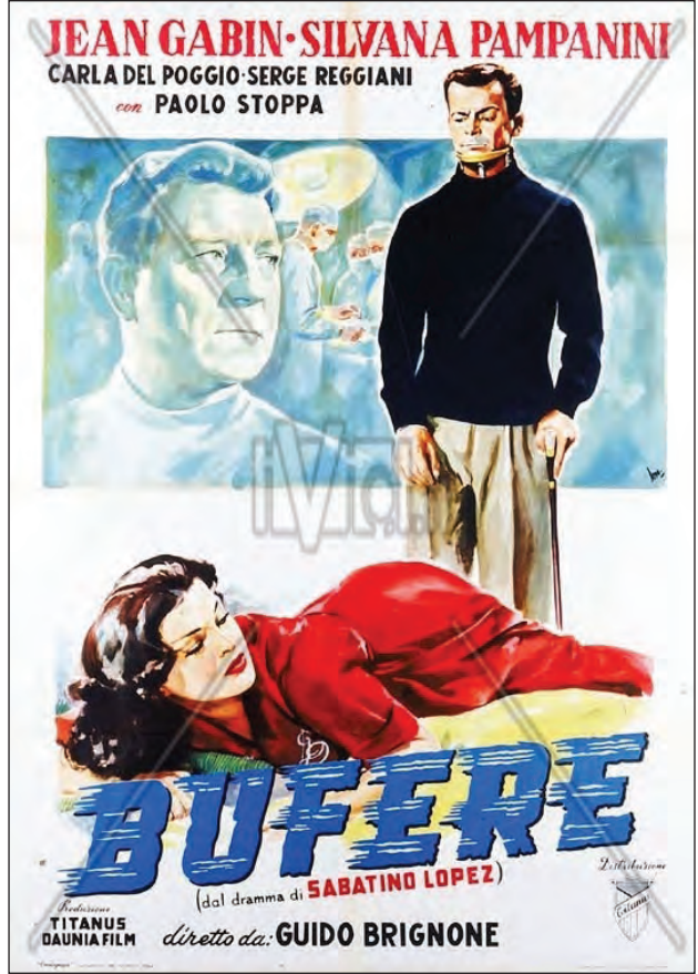
Şekil 6. Bufere filminin afişi.

Sineması'nda seyrettiği Hayat Kasırgası 'dır (Bufere, 1952) (Şekil 6). "Nedense iyi bir şey olduğunu umuyordum o filmin" sözleriyle başlayan eleştirisinde; konu, oyunculuk ve işleniş bakımından olumsuzluklarını vurguladığı film hakkında yargısı kesindir: "Bomboş bir film". Üzerinde özellikle durduğu nokta ise, Jean Gabin'in filmdeki oyunculuğudur. Gerçi değerli aktör, her zamanki gibi usta bir oyunculuk sergilemiştir; ama Ataç'ın ondan beklediği bundan daha fazla bir şeydir. Onun Gabin'in oyununda gördüğü eksiklik, "yaratma"nın olmayışıdır. Yazara göre, izleyiciye "Bak, ne güzel anlamış insan gönlünü!" dedirtecek bir ruh yoktur bu oyunculukta (1998a, ss. 169-170).