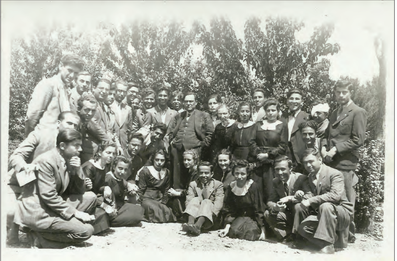
Şekil 1. Ataç Gazi Terbiye Enstitüsü'nde öğrencileriyle, 3 Mayıs 1940.

Örneğin Günce'nin 28 Ocak 1953 tarihli sayfasında (1998a, s. 23), o günlerde Büyük Sinema'da gösterilmekte olan Rüzgar Gibi Geçti (Gone With the Wind, 1939) filminden (Şekil 2, Şekil 3) söz açılır. Yazarımız, kentte olağanüstü bir ilgiyle karşılanan ve gösterimi başlı başına bir olay haline gelen bu filmi görmeye hiç de istekli olmadığını belirtiyordu. Ona göre film, fazlasıyla uzundur, ayrıca çoğunluğun beğenisini kazanmış böylesine ünlü yapıtların gerçekten güzel olabileceklerine inanmamaktadır.