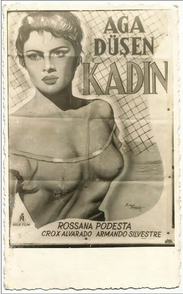
Şekil 5. Ağa Düşen Kadın filminin fotokartı.

Sineması'nda seyrettiği Hayat Kasırgası 'dır (Bufere, 1952) (Şekil 6). "Nedense iyi bir şey olduğunu umuyordum o filmin" sözleriyle başlayan eleştirisinde; konu, oyunculuk ve işleniş bakımından olumsuzluklarını vurguladığı film hakkında yargısı kesindir: "Bomboş bir film". Üzerinde özellikle durduğu nokta ise, Jean Gabin'in filmdeki oyunculuğudur. Gerçi değerli aktör, her zamanki gibi usta bir oyunculuk sergilemiştir; ama Ataç'ın ondan beklediği bundan daha fazla bir şeydir. Onun Gabin'in oyununda gördüğü eksiklik, "yaratma"nın olmayışıdır. Yazara göre, izleyiciye "Bak, ne güzel anlamış insan gönlünü!" dedirtecek bir ruh yoktur bu oyunculukta (1998a, ss. 169-170).