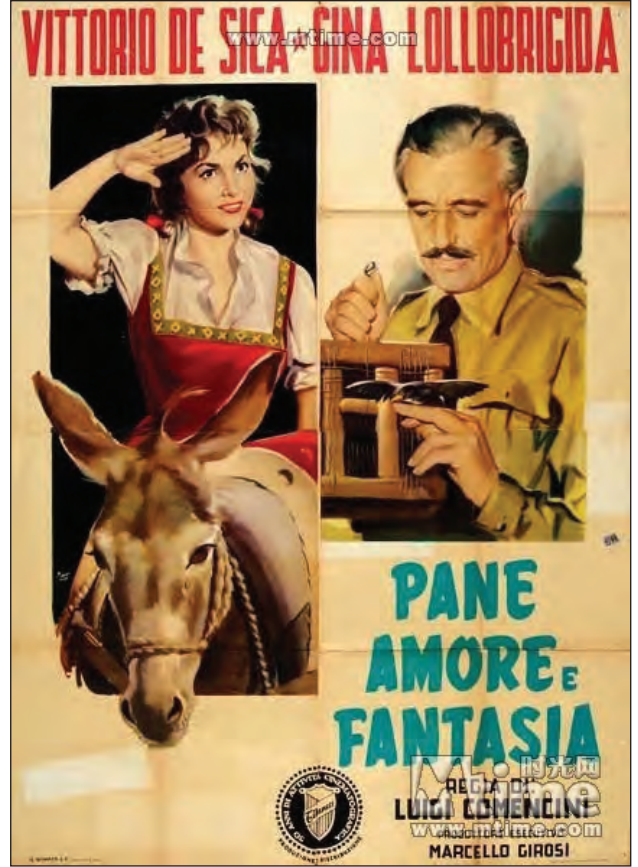
Şekil 10. Pane Amore e Fantasia filminin afişi.

Bu kez söz konusu film, onu düş kırıklığına uğratan Arka Pencere 'yle aynı hafta içinde izlediği, “ Ekmek, Aşk ve Kıskançlık ”tır (Pane Amore e Gelosia, 1954). Bir yıl önce gördüğü ve hâlâ unutamadığını söylediği, Ekmek, Aşk ve Hayal (Pane Amore e Fantasia, 1953) (Şekil 10). adlı İtalyan filminin bir tür devamı olan Ekmek, Aşk ve Kıskançlık ; yazarımızda, tıpkı ilk filmde olduğu gibi büyük