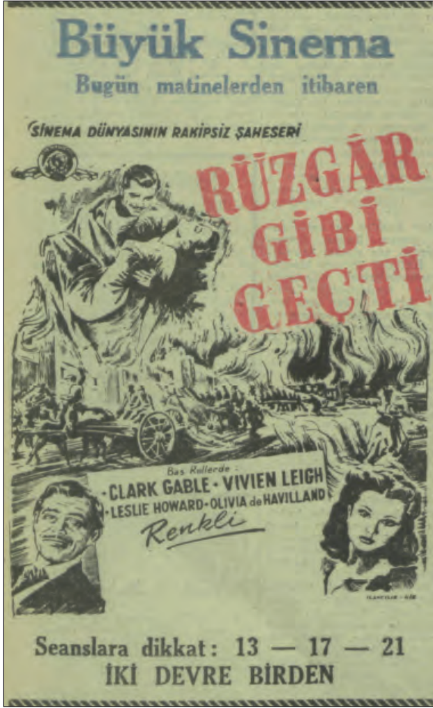
Şekil 2. Rüzgâr Gibi Geçti filminin reklamı. Kaynak: Rüzgâr Gibi Geçti, 1953, 27 Ocak, s. 6.