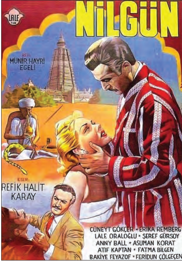
Şekil 7. Nilgün filminin afişi.