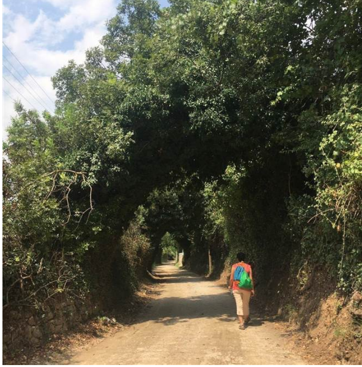
Şekil 6. İrim ve Kesik

Evliya Çelebi'nin o dönem yazdığı Karabağlar'ı Seyahatnamesi'nde "Karabağlar'ın yollarına bir yabancı girse bir ağaç deryası içinde yolunu bulamaz ve hayretle kalır. İrim ve kesiklerden oluşan yollar birbiri ile kesişir. Bu bağ yollarında asla güneş yoktur. Zira kesik üzerindeki ağaçların dalları gökyüzünü kapatırcasına birbiri içine girmiştir" ifadeleriyle anlatmıştır (Muğla Karabağlar Yaylası Geliştirme ve Güzelleştirme Derneği, 2021 akt, Menteşe Belediyesi, 2016, s. 7).