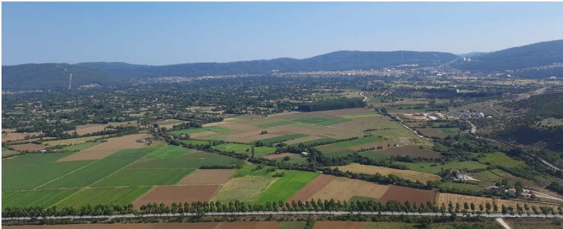
Şekil 1. Muğla Karabağlar Yaylası genel görünümü