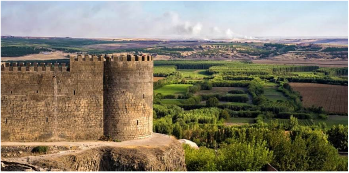
Şekil 4. Diyarbakır Kalesi ve Hevsel Bahçeleri

“Diyarbakır'da Fis kayasının aşağısında bulunan büyük nehrin iki yanı, güllük gülistanlık, bağ, bostan ve reyhan olduğu için yeryüzünde tanınmış bir dinlenme yeri olup her 5-6 ay veya yedi ay Diyarbakır halkının Şattü'l-Arab faslını ettikleri bir gezinti ve eğlence yeridir” (akt, Okumuş, 2012; 2001'a, s. 24, 38-39; 2003c, s. 253) (Diyarbakır Büyükşehir Belediyesi, 2014, s. 30).