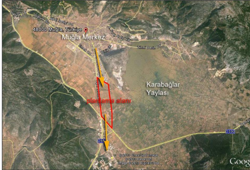
Şekil 2. Planlama alanı

amaçlı imar planlaması yaklaşımının mevcut haliyle işlevi yapılaşma koşullarının kentsel yoğunluk ve kentsel kullanım artışını yeniden düzenlemektir.