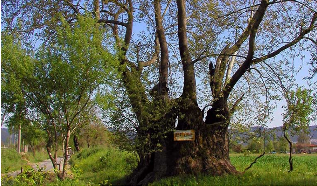
Şekil 10. Allan Kavağı