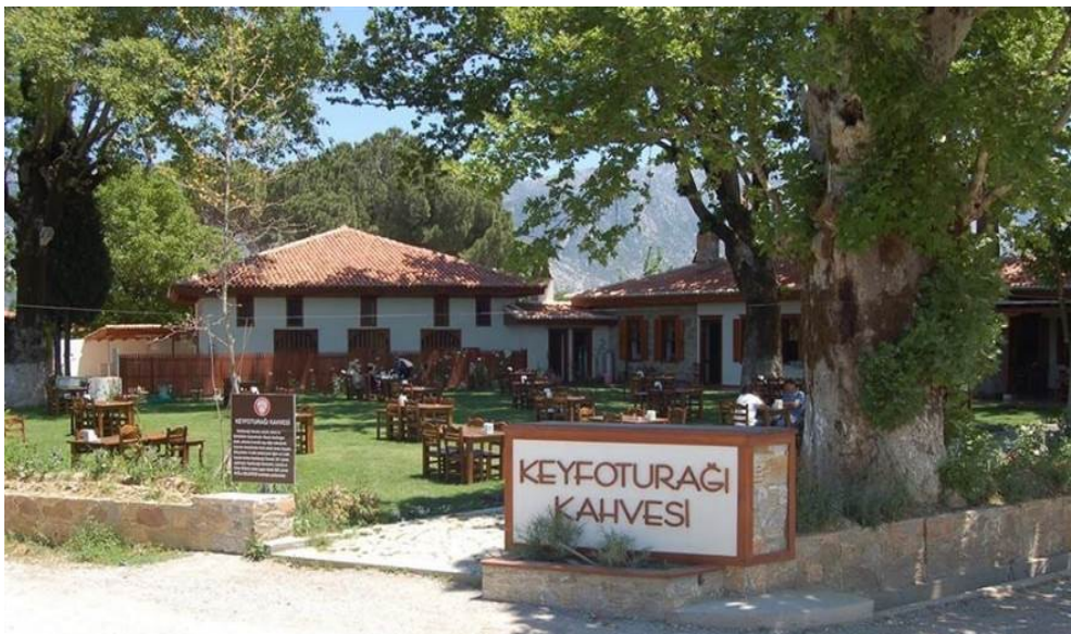
Şekil 8. Muğla Karabağlar Yaylası içerisinde yer alan kahvelerden Keyfoturağı Kahvesi-avlu görüntüsü

Yaylada genellikle anayol kavşaklarında tarihi kahveler bulunmaktadır. Bu tarihi kahvelerin ve mescitlerin birçoğu 19.yüzyıldan önce inşa edilmiştir. Her bir kahve ve mescitler sivil mimari örneğidir. Kahveler isimlerini yer aldıkları mevkilerden almıştır. Eski zamanlarda kahvelerin bulunduğu yerlerde mescit ile fırın, bakkal, berber, terzi gibi halkın ihtiyaçlarını karşılayabileceği hizmet yapıları bulunmaktaydı. O dönemlerde yaylada yaşayanlar için sosyalleşme mekanları olmuştur. Fakat günümüzde kahvelerin kullanımının değişmesi sebebiyle bu etkinliklerin yapıldığı sosyalleşme alanları olan kahvehaneler özelliğini yitirmiştir. Sapmaz (1996)’a göre; 1950’lerde başlayan ve bugüne kadar olan ulaşım ve tarımsal üretimlerde teknolojinin gelişmeye başlaması ile “deniz turizminin popülerleşmesi, ülke ekonomisinde yaşanan ani değişimler ve yayla yurtlarının el değiştirmesinin sonucunda mevcut yaşam kültürünü devam ettirecek olan neslin kalmaması gibi nedenlerden yazlık kahveler önemini kaybetmiş ve yazlık kahve ve mescitlerin birçoğunun yıkılarak yok olmasına neden olmuştur” (Koca, 2021, s. 10).