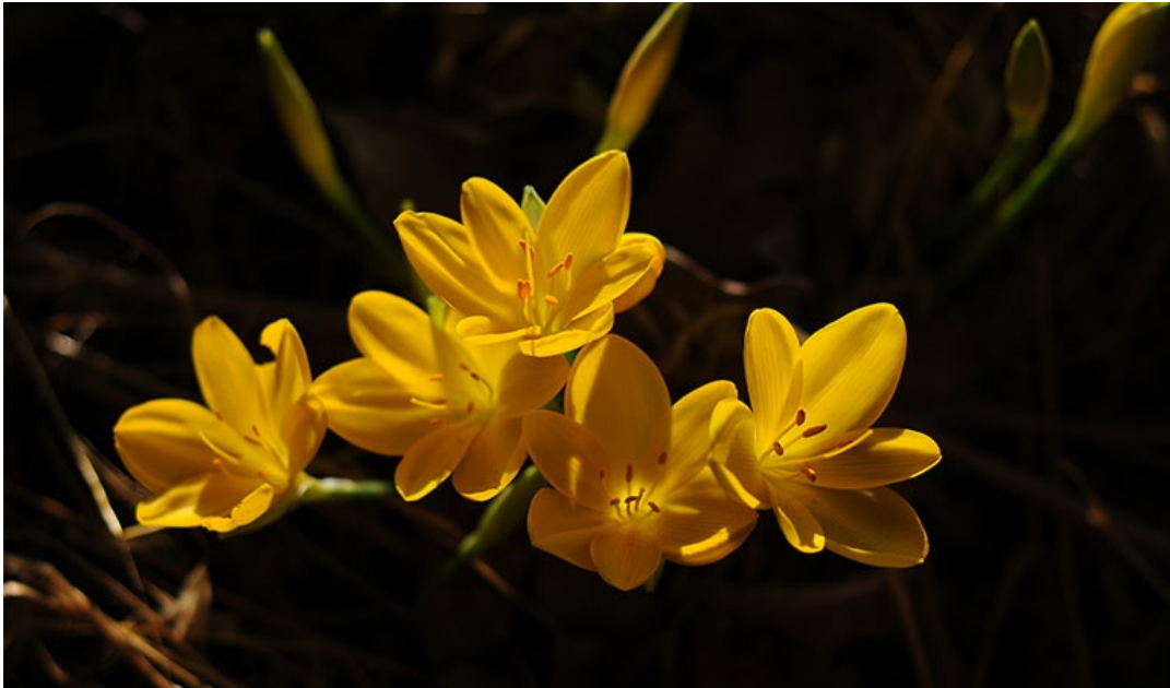
Şekil 9. Göç Göç Çiçeği

Yayladaki tarım ürünlerinden en önemli sayılabilecek Yayla Kavunu, endemik ve yerel bir tarımsal üründür. Halk bu kavuna Paris Kavunu'da demektedir. Özelliği ise kış aylarına kadar saklanarak kışın bile tüketilebilmesidir. Her sene Yayla Kavunu Yarışması düzenlenmekte ve en güzel yayla kavunu seçilmektedir.