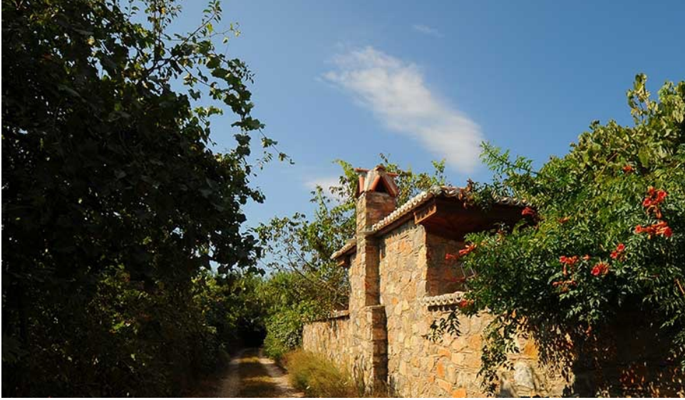
Şekil 7. Muğla Karabağlar Yaylası içerisinde yer alan Yayla Evi ve Muğla Bacası - yoldan görüntü

Yaylada, ilk yapıların ev tipi tahta damlar olduğu görülmüştür. 1940’lı yıllardan sonra tahta damların yerine Muğla tipi ve Ula tipi evler yapılmıştır. Yayla evleri, yığma taş duvar ve karkastan oluşmaktadır. Yayla evlerinde de Muğla genelinde kullanılan Muğla kentine özgü olan Muğla bacası kullanılmaktadır. Evler yurtların tam köşesinde yer alır ve diğer bölgeler ekili alan için ayrılmaktadır. Yayla evlerinden ise günümüzde 40 adet yayla evi tescillenmiş durumdadır.