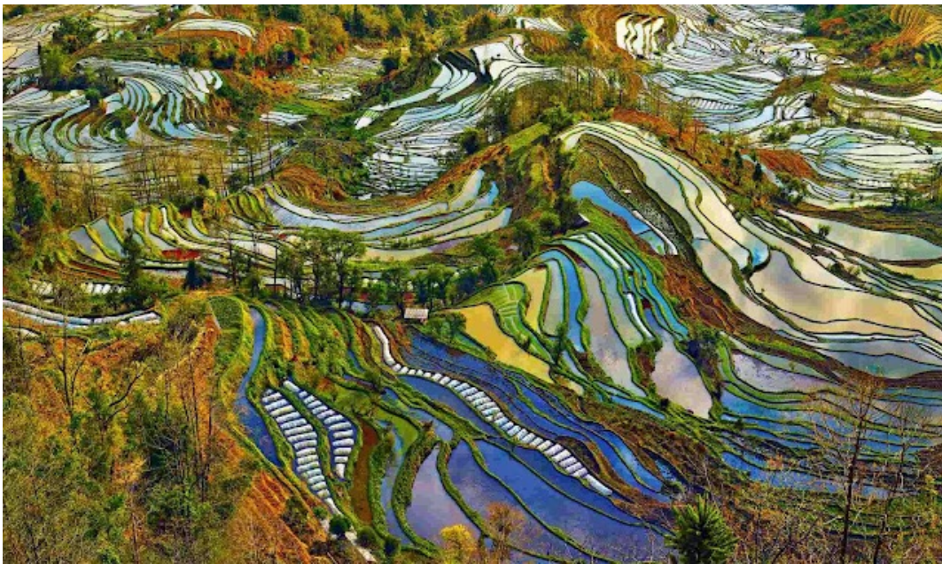
Şekil 3. Honghe Hani Pirinç Terasları'nın kültürel manzarası

Doğal ekonomi bölgenin geleneksel yaşam tarzını oluşturmakta ve traktör gibi makineli tarımsal uygulamalar ile kimyasal gübre kullanımı sınırlandırılmaktadır. Manda ve sığırlar, toprağı sürmek için kullanılmaktadır. Pirinç