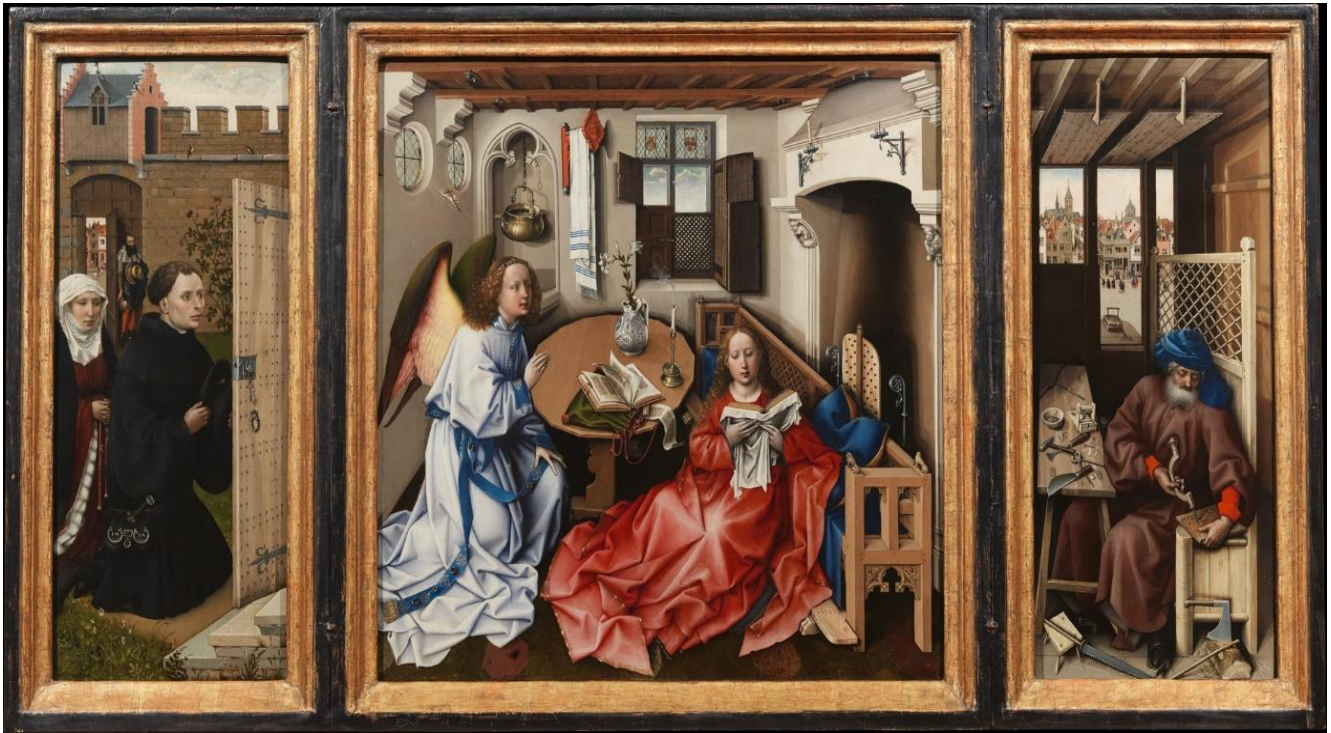
Resim 13. Robert Campin. Annunciation Triptych (Merode Altarpiece), Meryem'e Müjde. 1375/1444. Merode Altarı, triptikon; tamamı (64.5 x 117.8 cm), orta panel (64.1 x 63.2 cm), kanatlar (64.5 x 27.3 cm) Tournai. ca. 1427–32

Yaklaşık yüz yıl kadar önce Simona Martini ve Lippo Memmi Siena Katedrali sunağına "Meryem'e Müjde" konulu bir fresk yapmışlardı. Aynı konuyu Flemalleli Ustanın (Robert Campin) Merode Altarına uyguladığı bilinmektedir (Resim 13).