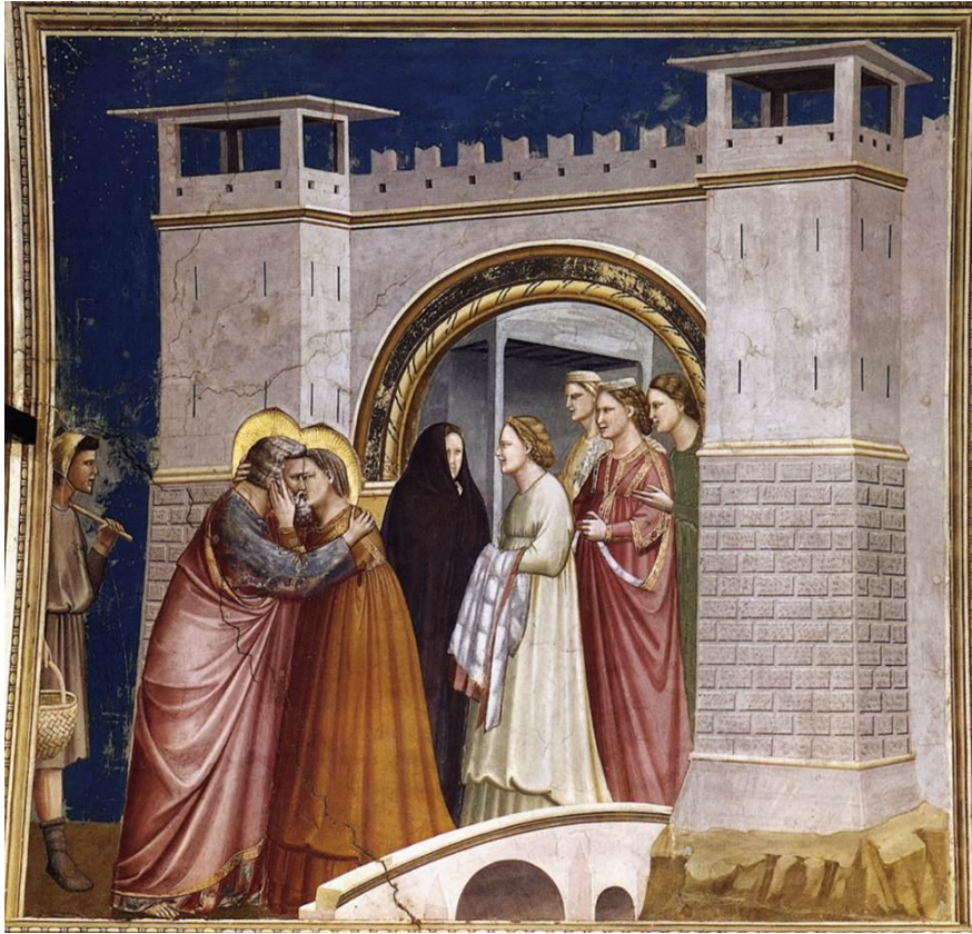
Resim 8. Giotto. Aziz Joachim efsanesi, Altın kapıda buluşma 1305, fresk 200x185 Scrovegni (Arena) Chapel, Padua.

simetrik bir piramit oluşturmuştur. Freskte bu bir denge duygusu yaratırken aynı zamanda figürleri sol tarafında izleyici grubu olarak resmedilen figürlerden ayırmaktadır. Sanatçının resminde figürler anıtsal niteliktedirler. Resimde mekân mimari bir yapıdan oluşmuş, sol ve üst bölümünde mavi renk ile boşluk duygusu verilmiştir. Işık sol üstten yansıtılarak yüzleri aydınlık yapmış, kıvrımlı kumaşlar, gölgelemeler ve figürler mekânla uyum içerisinde gösterilmiştir (Beyoğlu, 2016, s. 380) (Resim 8).