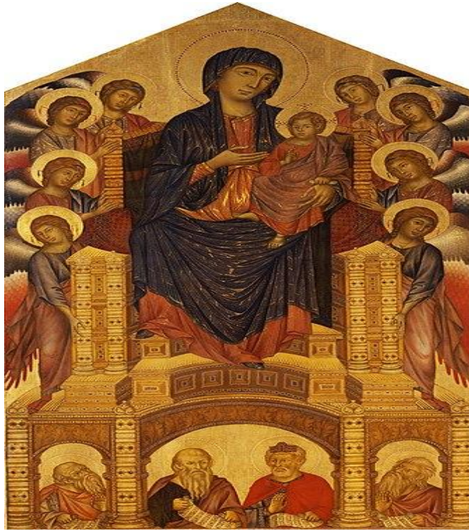
Resim 1. Cimabue, Meryem ve çocuk İsa, 1285, Ahşap üstü tempera ve altın, 384x223 cm. Floransa Galleria degli Uffizi

yerleştirememiş pek çok bakış açısı var. Aşağıda ellerinde peygamberlik sembolü olan parşömen tutan peygamberler bir mekân içinde duruyor. Cimabue'nin melekleri yığılmış gibi duruyor, hepsinin yüzü idealize edilmiş gibi ayındır.