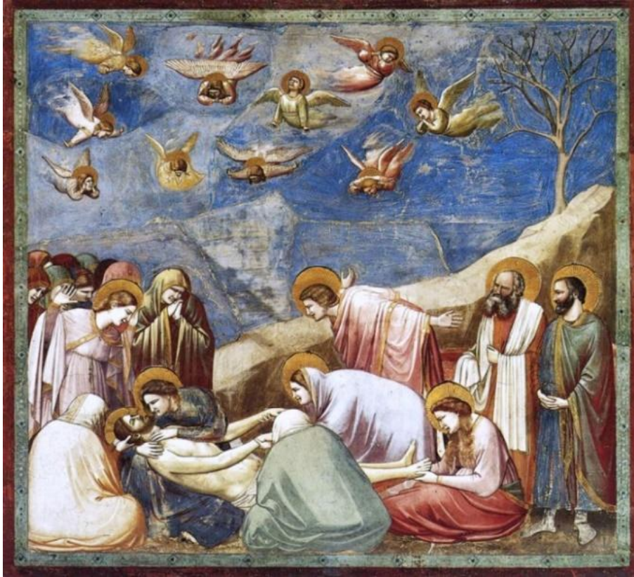
Resim 7. Giotto, İsa'ya Ağlama, 1305-6, fresk 200x185, Scrovegni (Arena) Chapel, Padua, 200x185