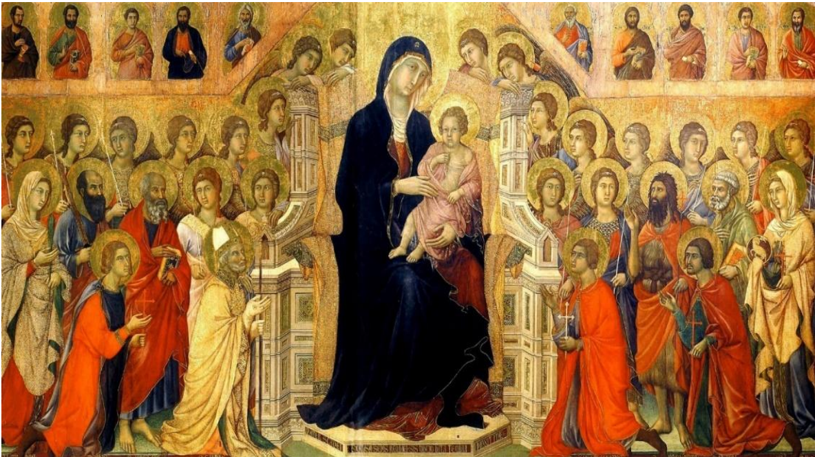
Resim 2. Duccio. Res.Maestà 1308-1311. Ahşap üstü tempera ve altın. 213x396 cm Museo dell 'Opera Metropolitana del Duomo, Siena.

14. yüzyılın en önemli ressamlarından biri olan Duccio, biraz daha genç çağdaşı Giotto gibi, İtalyan resminin gidişatında büyük bir etki yapmıştır. Bir yenilikçi olarak Siena resmine yeni altar tasarımları, dramatik bir manzara kullanımı, etkileyici duygusal ilişkiler, son derece karmaşık mekânsal yapılar ve incelikli bir renk etkileşimi kazandırmıştır. En önemli ve devrim niteliğindeki eseri Siena Katedrali için yaptığı Maesta (Meryem ve Çocuk İsa) idi (Resim 2).