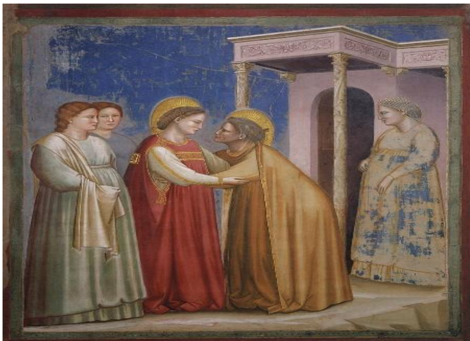
Resim 10. Giotto. Meryem'in Dadısını Ziyareti, 1306, fresk, 150x140 Cappella Scrovegni (Arena Chapel), Padua