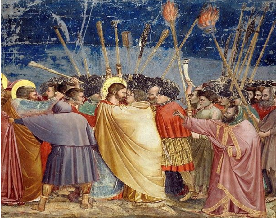
Resim 9. Giotto, Yudas'ın Öpüşü. 1304 – 1306. fresk 200x185 Capella Scrovegni ( Arena Şapeli), Padua