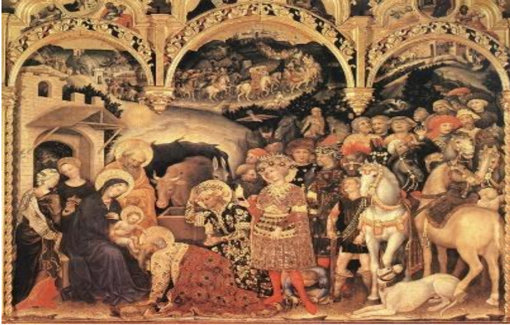
Resim 12. Gentile De Fabriano Müneccim Kralların Secdesi. 1423. 303x282 Galleria Degli Uffuzi, Floransa.

Kralların Secdesi tablosu 1423 tarihli ve imzalı olan Magi'nin (Üç Kralın) Secdesi sunağı, Gentile'nin Floransa'daki en ünlü eseridir (Resim 12). Bu, Gentile'nin, Floransa'nın sade sanatıyla şekillenen Uluslararası Gotik tarzını gösteriyordu. Altın varak ve parlak renklerin zengin kullanımı onun kişisel ve tipik Uluslararası Gotik özellikleriydi. Her zamanki zarif ve saraylı üslubuyla, perspektife ve kısaltmaya olan ilgi, Floransalıların etkilerini de yansıtıyordu (English, 2005, s. 298). Gentile bu tabloyu Floransa'lı bir tüccar için hazırlamıştır. Panonun üç kemerli çerçevesi içeriğe uygun olarak üç krala gönderme yapmıştır. Kemerler kutsal aileyi, üç kralı ve kralların maiyetindeki kişileri birbirlerinden ayırma işlevi de görür. Kemerlerin altındaki bölmelere de üç kralın İsa'yı ziyarete gelmeden önce başlarından geçen olayları betimler; Yeni kralın (Mesih'in) doğduğunun işareti olan yıldızla bakmaları, Kudüs'e doğru yola çıkışları ve Beytlehem'e varışları (Öndin, 2020, s. 204).