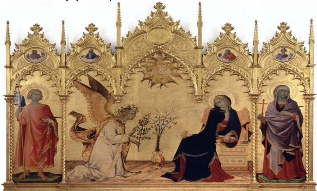
Resim 11. Simona Martini ve Lippo Memmi. Siena Katedrali için yapılan sunak resminin bir bölümü; Aziz Margaret ve Aziz Ansanus ile Meryem'e Müjde,1333, ahşap üstü tempera. 265x305. Uffizi, Floransa

Simona'nın yaptığı Siena'lı sanatçıların XIV. yüzyılın genel havasını yansıtır (Resim 11). Siena Katedrali sunak masası tablosu “Meryem’e Müjde” olayını anlatmaktadır. Meryem’e Müjde olayı Baş Melek Cebrail'in Meryem'i selamlamak için gökten indiği anı betimliyor. Bu arada meleğin ağzından çıkan sözleri de okuyabiliyoruz. "Avegratiaplen": “Selam sana lütuflarla dolu Meryem”. Melek sol elinde barışın simgesi olan bir zeytindali tutuyor; sağ eli konuşmaya hazırlanmış gibi havaya kalkmış. Meryem elindeki kitabı okuyormuş, meleğin gelişi onu biraz şaşırtmış, bu nedenle o da gökten gelen bu elçiye bakarken, bir korku ve alçak gönüllülük hareketiyle kendini geri çekiyor. Her ikisi arasında bakirelik simgesi beyaz zambakların bulunduğu bir vazo duruyor. Üstte ortadaki sivri kemerin içinde, Kutsal Ruhun simgesi güvercin, dört kanatlı meleklerle çevrili olarak görüyoruz. Gerçekte tüm tablo altın bir arka plandan öne fırlayan hayran olunacak bir düzeyde ustaca yerleştirilmiş figürleriyle değerli bir kuyumcu yapıtına benziyor (Gombrich, 1994, s. 212). Tablonun karışık düzenlemesi içine bu figürlerin yerleştirilme biçimi, meleğin kanatlarının soldaki sivri kemer tarafından çevrelenişi, Meryem figürünün sağdaki sivri kemerin altına çökilişi ve aralarındaki boşluğun ise bir vazo ve havada bir güvercinle doldurulmuşu çok etkileyicidir.