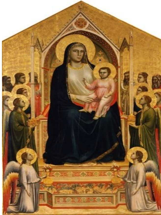
Resim 4. Meryem ve Çocuk İsa. 1300-1305. 325 x 204. Ahşap üstü tempera ve altın, Visituffizi Galeri Degli Uffizi.

Giotto modern resmin gerçek yaratıcısıdır. Rönesans'ın yolunu açmıştır. 1310 civarında yaptığı, Madonna di Ognissanti olarak bilinen Maestà'sı, Duccio veya Cimabue'nin eserinden tamamen farklıdır. Meryem, mekâna şekil veren ve figürlerin fiziksel olduğu ve nihayet insanileştirildiği bir "perspektif kutusu" yaratan bir tahtta oturuyor. Burada deneklerin gerçek bir bedene ve ruha sahip, gerçek bir mekânda, bu dünyada yaşayan gerçek insanlar olduğunu düşündürüyor (Visituffizi, 2023a).