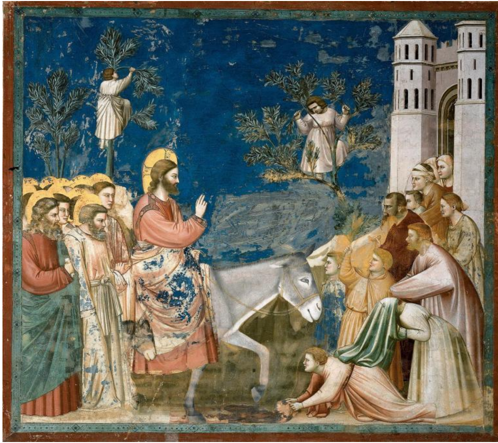
Resim 5. Giotto. İsa'nın Kudüs'e girişi, 1305-6, fresk 200 x 185 cm Scrovegni (Arena) Chapel, Padua, Italy.