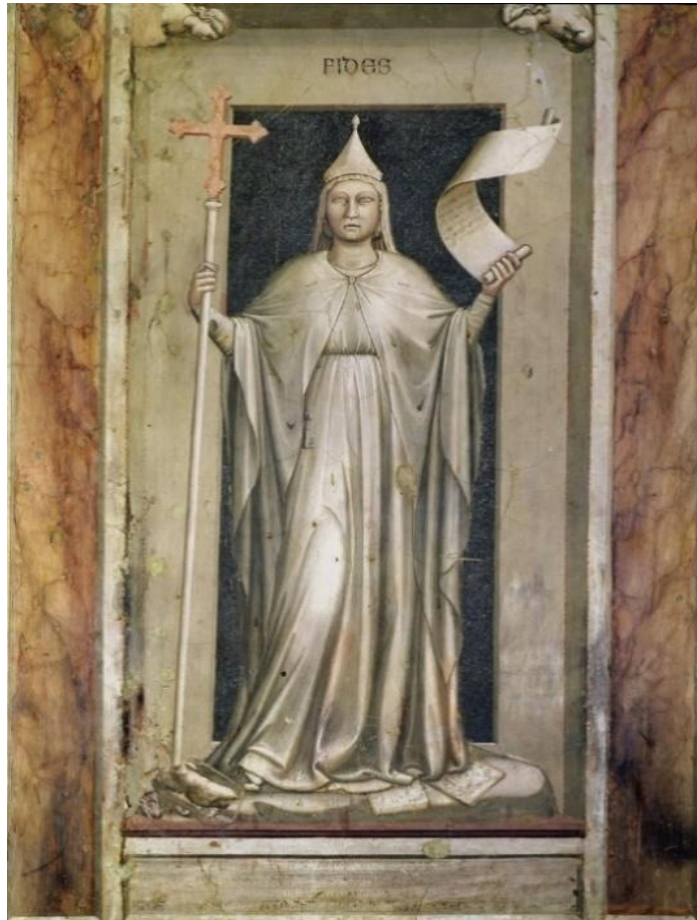
Resim 6. Giotto, İnanç. 1304-06, fresk Scrovegni Chapel, Padua.