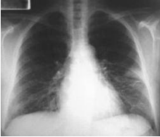
Resim 6. Altıncı ayda kontrol PA akciğer grafisi.