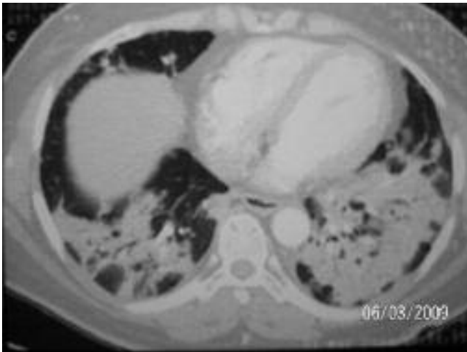
Resim 3. Her iki akciğer alt loblarda hava bronkogramları içeren fokal konsolidasyon alanları.