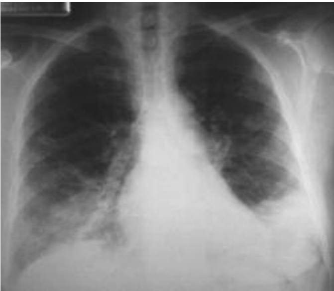
Resim 1. Sol alt zonda daha belirgin olmak üzere, bilateral alt zonlarda nonhomojen dansite artışı.

Hastanın nörolojik muayenesi normaldi ve uyku hali nedeniyle istenen psikiyatri konsültasyonu sonucunda ek öneride bulunulmadı.