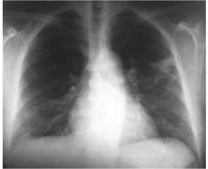
Resim 4. Üçüncü ayda kontrol PA akciğer grafisinde infiltrasyonlarda belirgin gerileme.

Klinik tablo oldukça karakteristiktir. Birkaç haftadır devam eden, viral enfeksiyon benzeri bir tablo şeklinde, kuru öksürük, ateş yüksekliği, kırıklık, iştahsızlık ve kilo kaybı, başlangıçta en sık rastlanan yakınmalardır. 2,3