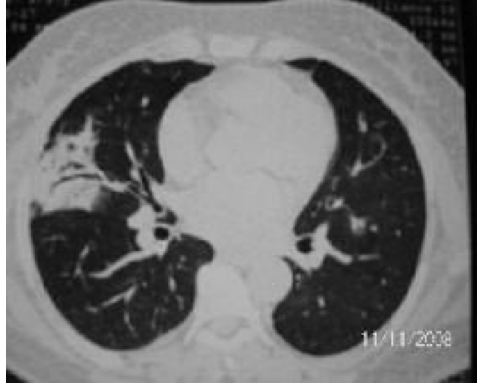
Resim 7. Altıncı ayda kontrol toraks BT: Sağ akciğer orta lob lateral segmentte hava bronkogramları içeren konsolidasyon alanı.

Olgumuzun belirgin özellikleri aşırı uyku hali, halsizlik ve terleme idi; solunumsal semptomları yoktu. Uyku hali hastanın en çok yakındığı rahatsızlıktı. Ancak polisomnografi yapılmadı ve tedavi sonunda bu yakınması da geriledi.