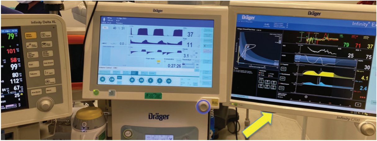
Şekil 1. SmartPilot® View (SPV)'nin yerleşimi ve ekran görüntüsü Sarı ok: SmartPilot® View ekranı

de hızlanmasına katkıda bulunabilir (3,11-13). Farmakolojik olarak iki veya daha fazla ilaç konsantrasyonunun birleşik klinik etkilerini göstermek için yanıt yüzey modelleri geliştirilmiştir (14-16). Bu, üç boyutlu bir etkileşim modelidir; x ve y eksenleri, tahmin edilen hipnotik ve opioid konsantrasyonlarıdır ve z eksen, izobol adı verilen ilaçların sinerjik etkile-