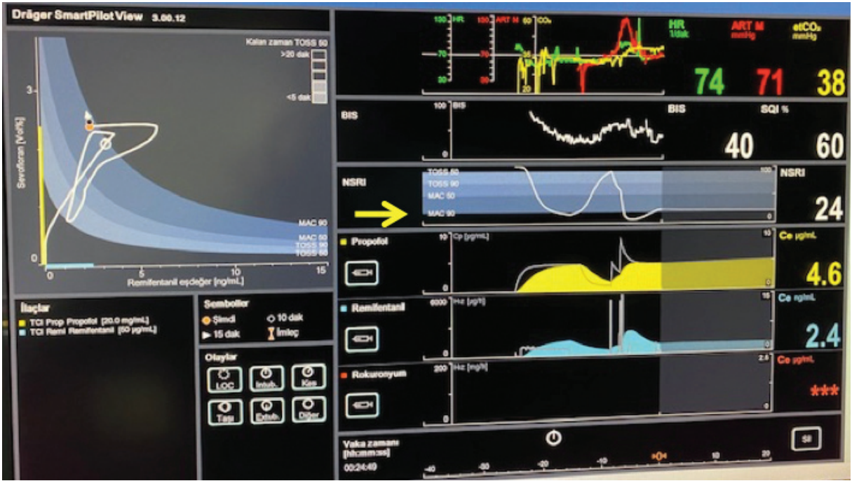
Şekil 3. SmartPilot® View (SPV) ekranı ve Noksius Stimülasyon Yanıt İndeksi (NSRI).

Sarı ok: Noksius Stimülasyon Yanıt İndeksi (NSRI)