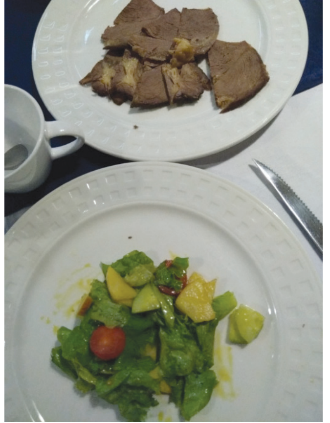
Menüde at eti ve sebze.

38 harf veya işaretli Göktürk harfleriyle yazılan anıtlardan 13. yüzyıl Moğol tarihçisi Alaaddin Ata Melik Cüveynî, Tarih-i Cihan-güşa adlı yapıtında söz etmiştir. Çin kaynakları da anıtların dikilişini bildirmekteydi. Yine de bu durum 18. ve 19. yüzyıllara kadar bilim dünyasının bilinmeyen olarak kaldı.