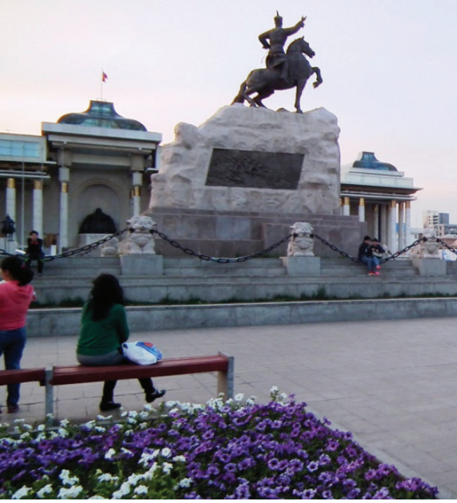
Damdin Sukbaatar heykeli.