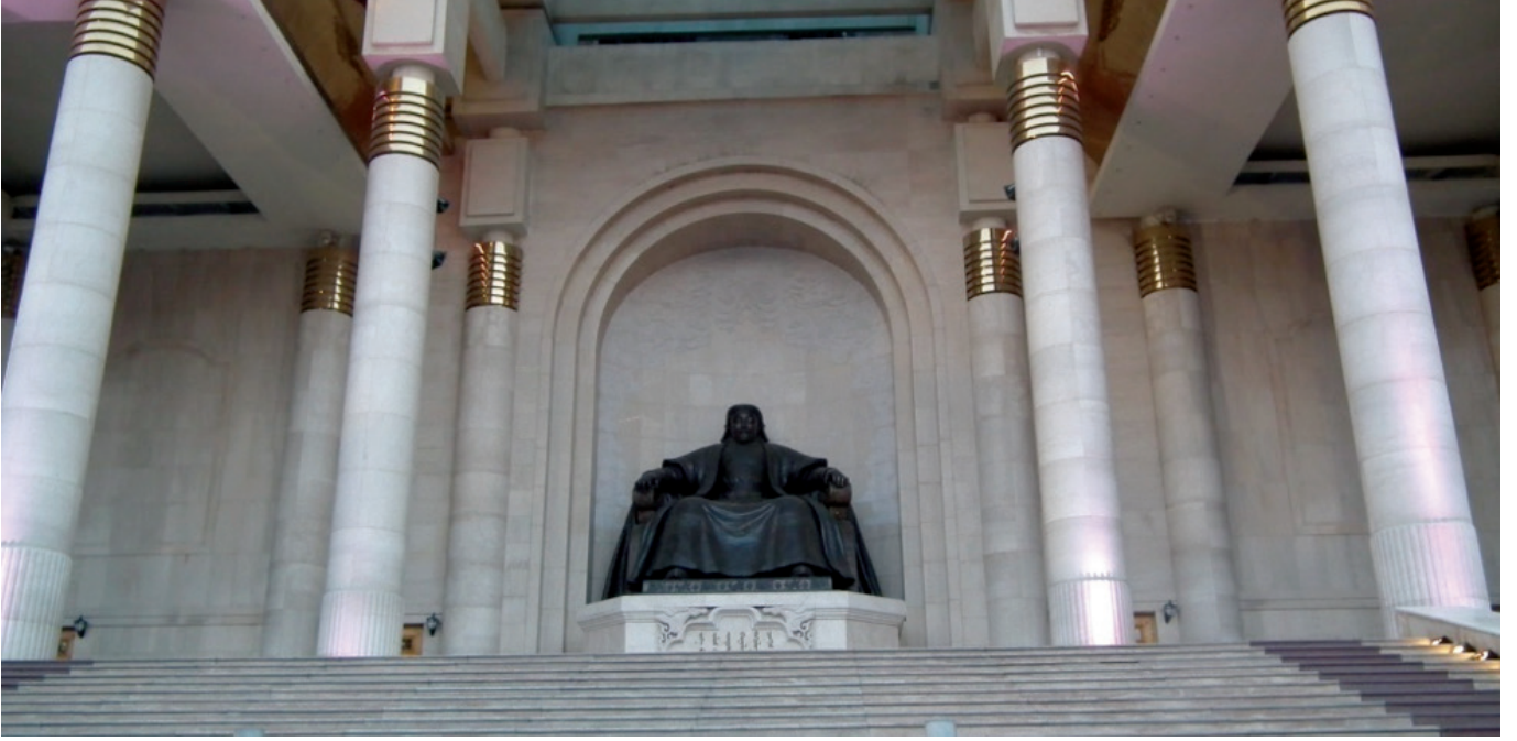
Cengiz Han bronz heykeli.