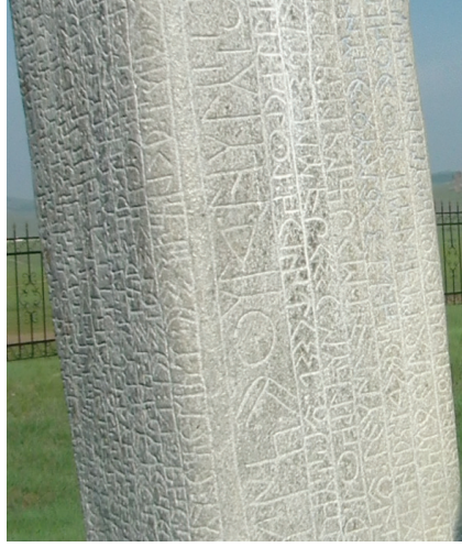
Göktürk harflerinin yakın görünümü.