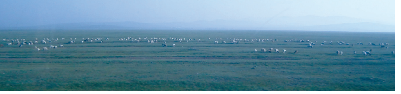
Uçsuz bucaksız özgür atlar ülkesi.