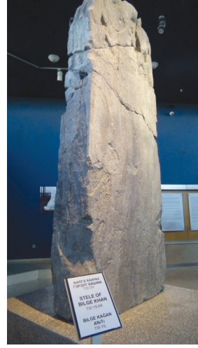
Bilge Kağan Anıtı.