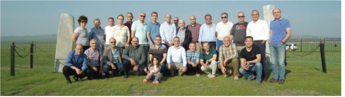
Katılımcılar, Tonyukuk Anıtı'nda.

mini anlatır sonra kendinden bahseder ve öğütler verir. Anıtların etrafında başları kırılmış sekiz tane heykel ile, anıtın ilerisinde 1200 m. uzunluğu bulan 200 tane Balbal dizisi bulunmuştur. Çin kaynaklarına göre 646 yılında Çin'de doğan Tonyukuk, vali yardımcılığı yaparken hapse atılır, hapisten kaçtıktan sonra II.Göktürk Hakanlığı'na katılır ve Apa Tarkan/Büyük Vezir olarak atanır. Yaptığı büyük hamlelerle Göktürk hakanlığı'nı canlandırır ve Orta Asya Türk hakimiyetine girer.