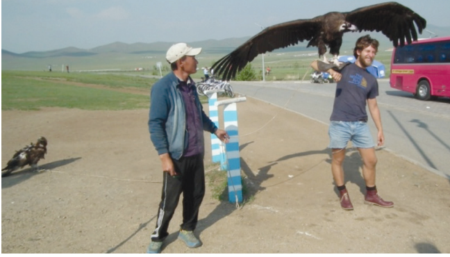
Kartalın son hali.

kazandırılmıştır. Bu anıtların önemi, İslam öncesi kayıtların çok az tutulduğu Türk tarihinin ilk ve en eski yazılı kaynağı olmasıdır. Bu anıtlardaki yazılarda Göktürk Devletinin kuruluşu, yükselişi, Kağan'ların kahramanlıkları, başarıları, devlet idaresi, iç ve dış düşmanlar anlatılmakta gelecek Türk nesillerine öğüt verilmektedir.