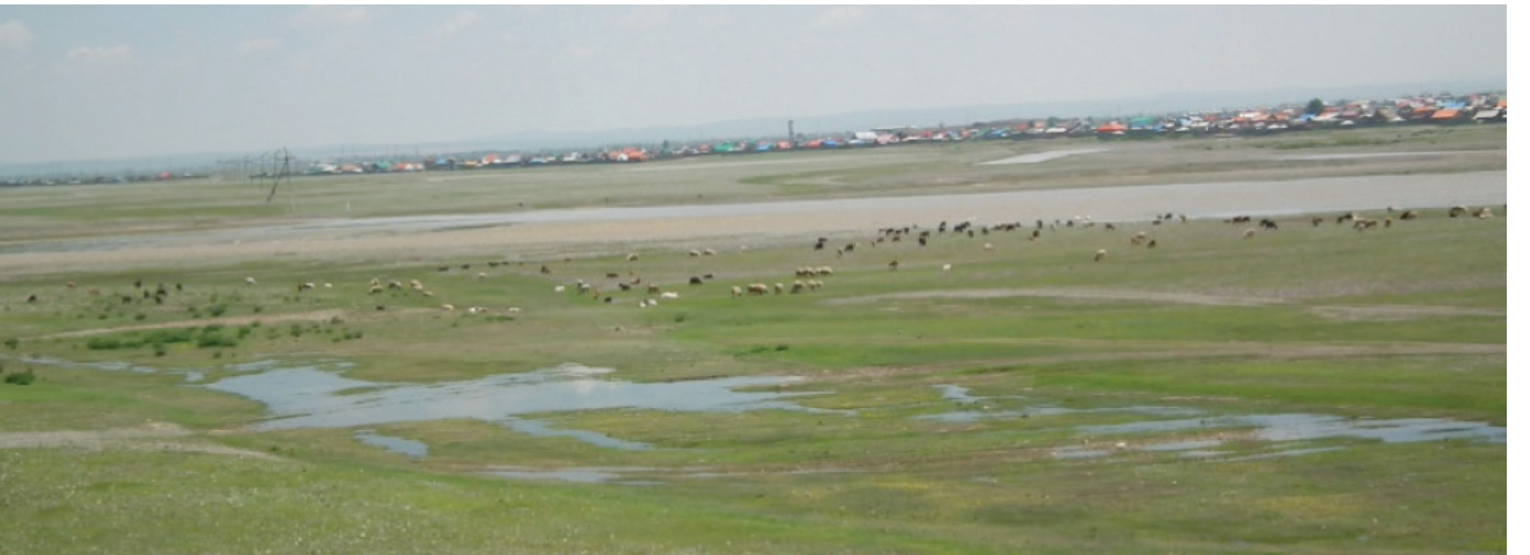
“Ruhumuzu kandırdık Orhun'un kaynağından.”

Tonyukuk Anıtıdır. Ulan Batur'un 50 km. güneydoğusunda yer alır. 720—725 yılları arasında iki ayrı taş sütun üzerine, yazıtların bir yüzü Göktürk alfabesiyle, diğer yüzü Çin alfabesiyle olacak şekilde yazılmıştır. II. Göktürk Hanlığı dönemine damga vuran ünlü devlet adamı Tonyukuk tarafından dikilmiştir. Yazılar soldan sağa doğru yazılmıştır. Bu yazıtta Tonyukuk önce İltiş Kağan dön-