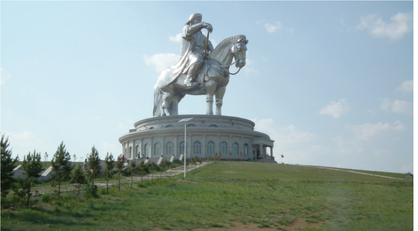
Cengiz Han'ın devasa çelik heykeli.

Nüfusun üçte ikisi şehirlerde geri kalanı ise Ger adı verilen, bir saatte kurulup sökülen taşınabilen çadırlarda göçebe olarak hayat sürmektedir. Şehirde oturanlar da evin bahçesine Ger kurup orada yaşamaya devam etmektedirler.