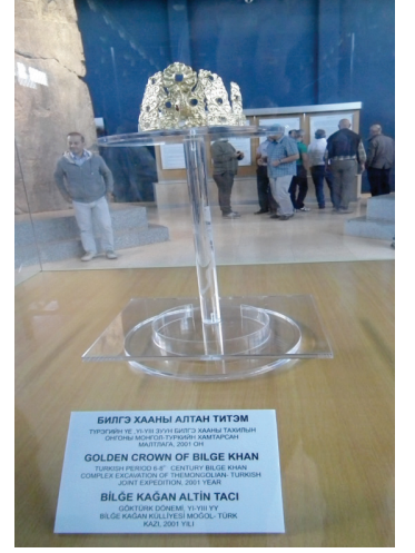
Bilge Kağan'ın altın tacı.

yer delinmedikçe, ilini töreni kim bozabilir?" Göktürkçe: "Üze teñri basmasar asra yir telinmeser Türk bodun ilijin törüñün kim artatı udaçı erti"