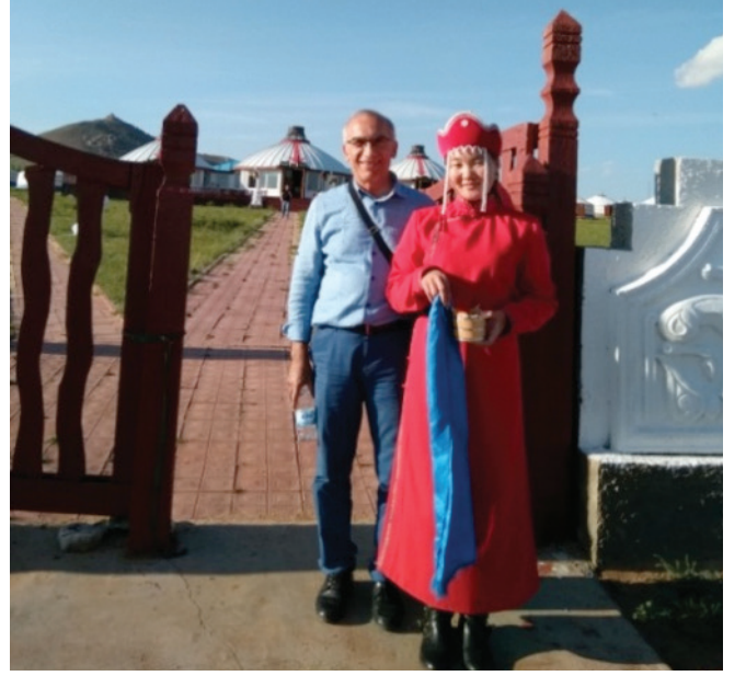
Mahalli kıyafetiyle Moğol kıızı.

En önemli beslenme kaynağını et oluşturur ve bol