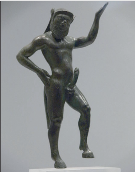
Şekil 5. Falluslu Silenos, bronz heykel. National Archaeological Museum, Atina, Yunanistan.