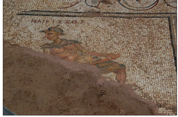
Şekil 6. Falluslu Narcissus, mozaik pano. Koruma altında açık sit alanı, Antalya, Türkiye.