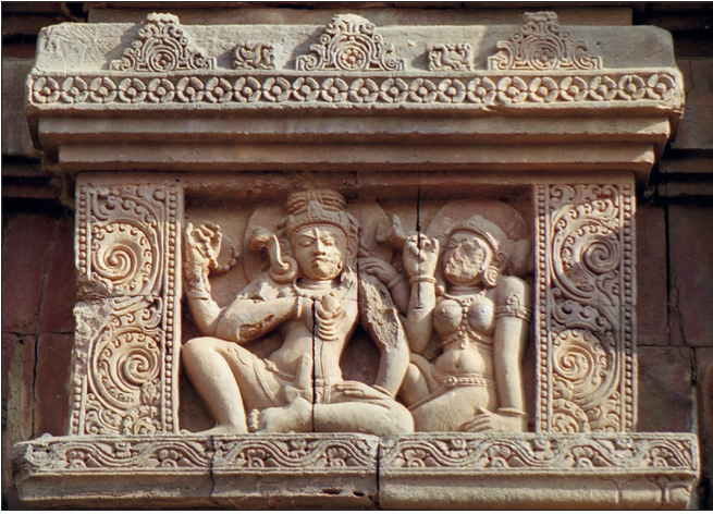
Şekil 9. Falluslu Shiva ve Parvati, rölyef heykel. Vaital Deul temple, Bhubaneshvar, Orissa, Hindistan.