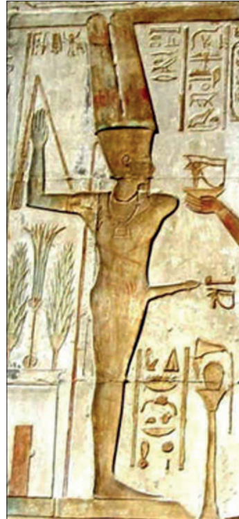
Şekil 8. Falluslu Min, Duvar Rölyefi. The Temple of Hathor, El Medina, Mısır.