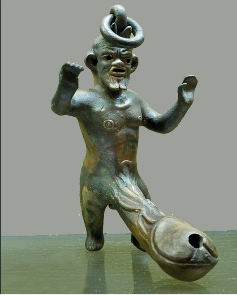
Şekil 3. Falluslu Pan, pişmiş toprak kandil. Museo Archaeologico Nazionale, Napoli, İtalya.