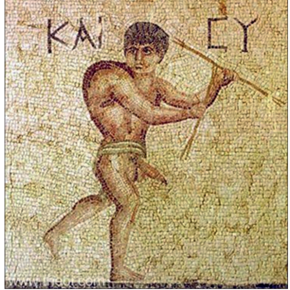
Şekil 7. Falluslu Tychon, mozaik pano. Antakya Archeology Museum, Hatay, Türkiye.