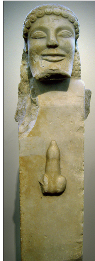
Şekil 2. Falluslu Hermes büstü, mermer heykel. National Archaeological Museum, Atina, Yunanistan.