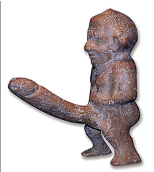
Şekil 10. Falluslu Priapos, pişmiş toprak figür. Efes Archeology Museum, İzmir, Türkiye.