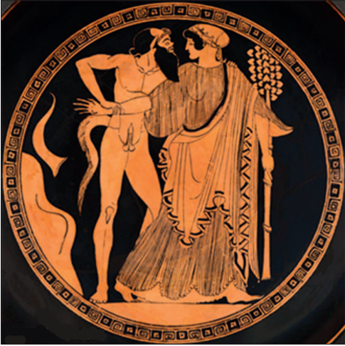
Şekil 4. Falluslu Satyr ve Maenad, pişmiş toprak seramik, Museum Collection Harvard Art Museums, Cambridge, Amerika Birleşik Devletleri.