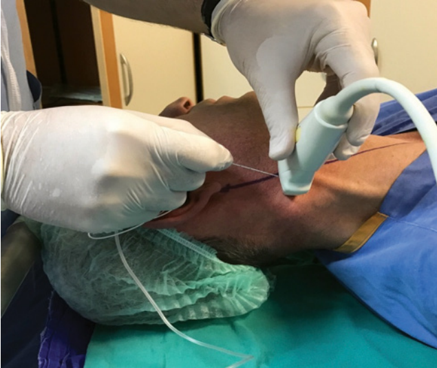
Şekil 1. Yüzeyel servikal Bloğun ultrason eşliğinde uygulanışı.

fasya geçilerek yapıldı. İlaç uygulaması sırasında negatif basınç ile kontrol edildikten sonra önce 1 ml LA solüsyonu enjekte edildi. İlacın doğru fasyal planda dağılımı gözlemlendikten sonra aralıklı negatif aspirasyonu takiben ilaç uygulandı (Şekil 2b). Operasyon toplamda 45 dakika sürdü. Peroperatif dönemde stabil seyreden ve işlem boyunca ağrısı olmayan hasta postoperatif derlenme ünitesine alındı. Derlenme ünitesindeki vital bulguları stabil seyreden ve herhangi bir komplikasyon gözlenmeyen hasta servisine gönderildi. Postoperatif dönemde cerrahi ekip tarafından takip edilen hastanın ilk 24 saati ağrısız geçirdiği ve analjezik ihtiyacı olmadığı tespit edildi.