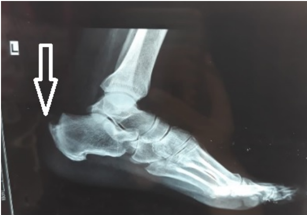
Resim 1. Sol ayak: aşil tendonunun kalkaneusa yapışma yerinde kalsifik tendinit, kalkaneus posterosuperior bölgesindeki prominensin belirginleşme