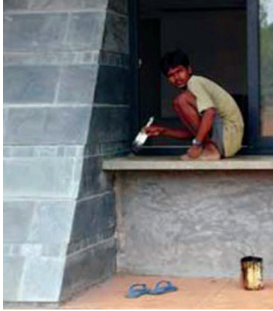
Resim: 6 Auroville Kentsel Araştırmalar Merkezi İnşaatı (URL-6, 2012).