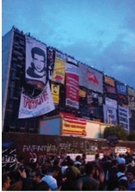
Resim: 8 Gezi Parkı Eylemleri Sırasında İşgal Edilen Atatürk Kültür Merkezi (Eser Yağcı, 2013).

6. yüzyıldan itibaren poliste (Mumford 2007, 250-253), sonrasında Çin, Hindistan, Pers, Yakın Doğu ve Batı’da gizemci öğretiler ile sürmüştür. Gücün mülkiyette temsil bulmasıyla, yaşam biçimini kısıtlayan yapıların gücün sürekliliği ile bağı doğrultusunda, bu grupların karşı durduğu hedefe mülkiyeti koymaktadır. 6. yüzyılda beliren karşı tutumlardan çok önce, “egemen bir azınlığa” fayda sağlayan mülkiyetin kötülüğü “Asurlular’a ait bir tablet” ve Gılgamış Destanı’nda “Utnapiştim’de ifade bulur”. Mumford’a (2007, 143) göre, kentleşme ile sınıf ayrılıklarının yapılanmasının temelinde yatan mülkiyet ilişkileri ile ilgili ayrıntılı yasalar, M.Ö. 1700 gibi erken bir dönemde Hamurabi Yasaları’ndan bu yana kentlerde ayrıcalıklı olanlar ve olmayanları, sosyal ve mekânsal olarak ayırmaktadır. Proudhon (2010, 97) için ise mülkiyet, iktidarı temsil eden erkin dayattığı kuralların statüko haline gelmesine neden oluşturur. Proudhon’un (2010) tanımlarında, mülkiyet ile dünyada yaşayan tüm canlıların kullanımında olan