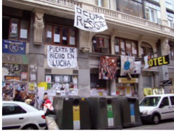
Resim: 7 İspanya'da Mayıs 15 protestolarında işgal edilen Hotel Madrid (Eser Yağcı, 2011).

İzinsiz yerleşme 1980'lerden itibaren gelişmiş ülkeler kategorisinde anılan ülkelerde de yaygınlaşmaya başlayan bir harekete dönüşmüştür. Alternatif mekân, barınma, konut sorunu, eşitsizlik, kentlerde yaşam ve ifade alanlarının daralması nedeniyle sosyal ve kültürel yeni ortamlara olan gereksinim, politik bir eylem, işgal edilen mekanın korunması ya