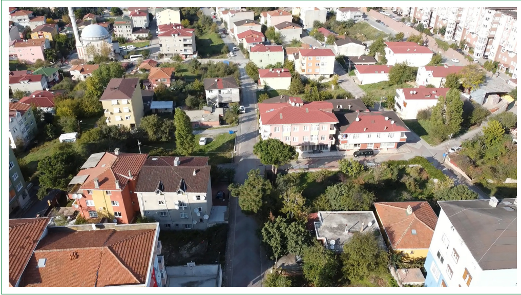
Şekil 7. Mahallenin güncel görünümü.

Müşavirin çok yönlü mobbing eylemlerinin sonucunda, mahalle sakinleri belirsizlik, kafa karışıklığı, endişe, stres ve güvensizlik gibi duyguları yoğun bir şekilde deneyimledi. Bu durum, hem mahalle sakinlerinin birbirlerinden uzaklaşmasına hem de kendi konutlarına karşı yabancılaşmalarına yol açtı.