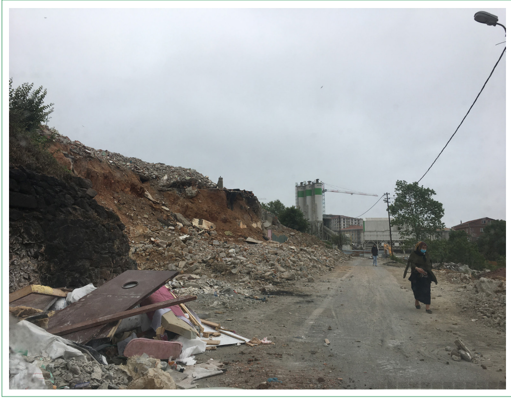
Şekil 4. Fiziksel düzensizlik göstergeleri.