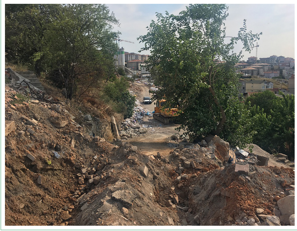
Şekil 5. Fiziksel düzensizlik göstergeleri (İlk yazın arşivinden).

giderlerinin kapatılmaması ve dışarı akması, düzenli yaşamını sürdüren kiracıların yerlerinden edilmesi ve en önemlisi yıkılan binaların molozlarının kaldırılmaması ve bu molozların solunum yoluyla asbest (kanserojen madde) salgılaması ve daha sayamadığım birçok bireysel mağduriyetler yaşanıyor burada. Bunların hepsi bizim için büyük bir tehdittir (Çalışkan, 2019 tarafından aktarıldı).