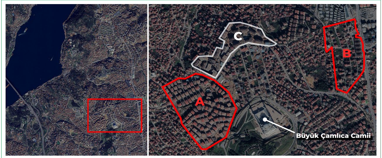
Şekil 1. Dönüşüm Alanlarının Konumu - A Kirazlıtepe, B Mehmet Akif Ersoy (özel sektör öncülüğünde), C Mehmet Akif Ersoy (devlet öncülüğünde).

projelerine ev sahipliği yapmaktadır. Bu durum, Boğaziçi Kanunu'nun bu alandaki nüfus ve inşaat yoğunluğunu sınırlama hedefiyle çelişmektedir.