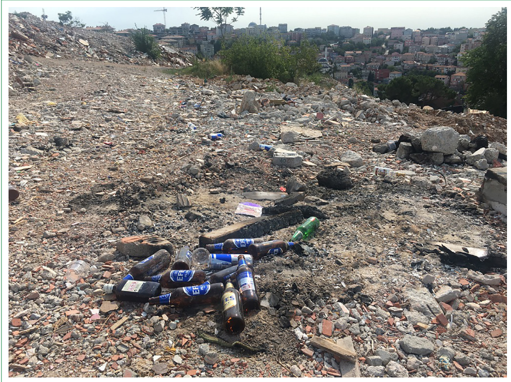
Şekil 6. Sosyal düzensizlik göstergeleri (İlk yazarın arşivinden).

Kirazlıtepe'de ilk camiyi yıkmalarının sebebi de caminin altında bir avlu ve avlunun içerisinde bir kıraathane vardı... Dolayısıyla bir süre sonra o cami basın açıklamalarının yapıldığı, toplanılma alanı oldu. Ve onu yıkmalarının sebebi aslında oradaki toplanmayı ortadan kaldırmaktı. Buna benzer şeyler yaptılar (Umut, 12.12.2022, Kirazlıtepe).