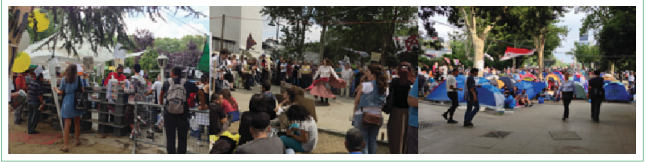
Şekil 2. Mayıs–Haziran 2013, Taksim Gezi Parkı Protestoları: sosyal pratik ve kentsel mekan arasındaki yeni bağlar.