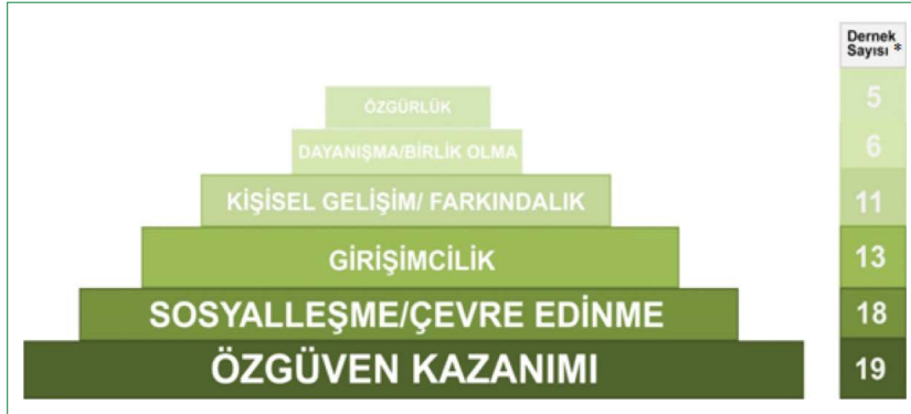
Şekil 4. Derneğin köy kadınına etkisinde öne çıkan etmenler (*: Mülakat yapılan 21 dernek içerisinde ilgili ifadeyi kullanan dernek sayısı).