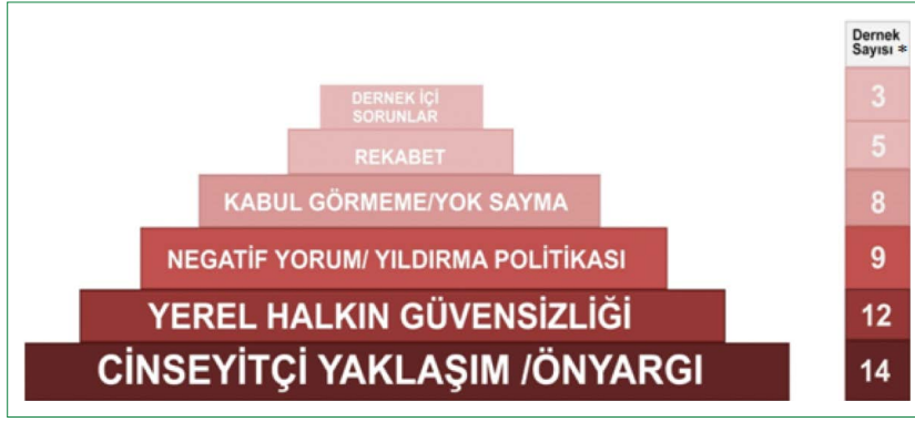
Şekil 3. Dernek kuruluş sürecinde öne çıkan kısıtlar (*: Mülakat yapılan 21 dernek içerisinde ilgili ifadeyi kullanan dernek sayısı).