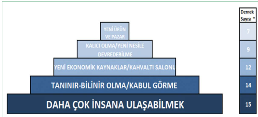
Şekil 5. Derneklerin geleceğe yönelik hedef ve beklentilerinde öne çıkan başlıklar (*: Mülakat yapılan 21 dernek içerisinde ilgili ifadeyi kullanan dernek sayısı).

şimciliğinin temelinde yatan motivasyonlarla benzer nitelikler göstermektedir. Gelir elde etme, kabul görme, bağımsız olma, kendini geliştirme, toplumu geliştirme (Scheinberg ve MacMillan, 1988) talebi ile maddi-manevi kazanımlar, kendi geleceğini şekillendirme ve iş fırsatlarını değerlendirme (Littunen, 2000) isteği bu çalışma içinde ortak motivasyon araçlarıdır. Ancak Bursa Üreten Kadın Dernekleri Federasyonu örneğinde ortaya çıkan en temel farklılık literatürde girişim motivasyonu olarak öne çıkan değerlerin, köy kadınlarında girişim sonrası