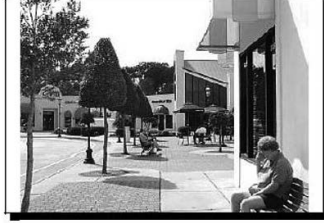
Açık alanda oturularak doğal gözetimin sağlanması

1- Doğal gözetime ilişkin maddeler halinde tasarım ilkeleri