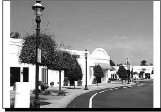
Temiz, bakımlı ve iyi aydınlatılmış alanlar müşteri ve çalışanların kaygılı hissetmelerinin önüne geçmektedir

2- Doğal erişim kontrolüne ilişkin maddeler halinde tasarım ilkeleri