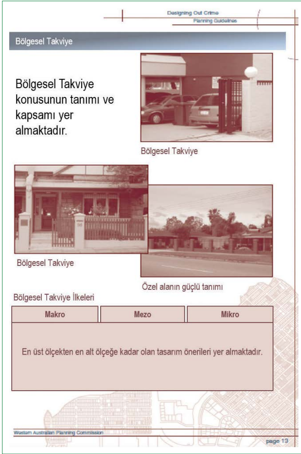
Şekil 2. Batı Avustralya Suç Önleme Rehberi'nden ilkelere ilişkin teknikler (Western Australian Planning Commission, 2006).

ilişkin dört temel CPTED ilkesini tek tek açıklanmakta ve ardından bir kontrol listesi paylaşılmaktadır (Şekil 4). Devamında farklı işlev alanları için (konut ve konut alanı türleri, mahalle, kent merkezleri, ticaret sokağı, otopark alanları, eğitim alanları, alışveriş merkezleri, ofis yapıları, sanayi alanları), dört stratejiye ilişkin ilkeler maddeler halinde sıralanmakta, her işlev alanı ile ilgili tek bir örnek alan fotoğrafı ile işlev başlıkları desteklenmektedir. Ardından peyzaj düzenleri ve aydınlatma ile ilgili temel ilkelere yer verilmektedir. Rehberin daha çok uygulayıcılar ve tasarım profesyonellerine yönelik hazırlanmış olması nedeniyle rehberde ele alınan ipuçları plancılar, mimarlar gibi meslek insanlarına hitap etmektedir. Bu nedenle ayrıntısız, temel öneriler her bir işlev alanı için aynı sistematik düzende maddeleştirilerek anlatılmıştır. Sade ancak profesyoneller için anlaşılması kolay bir teknikle hazırlanan rehberin yerleşme sakinlerini/kullanıcıyı uygulama sürecine dahil etmediği görülmektedir.