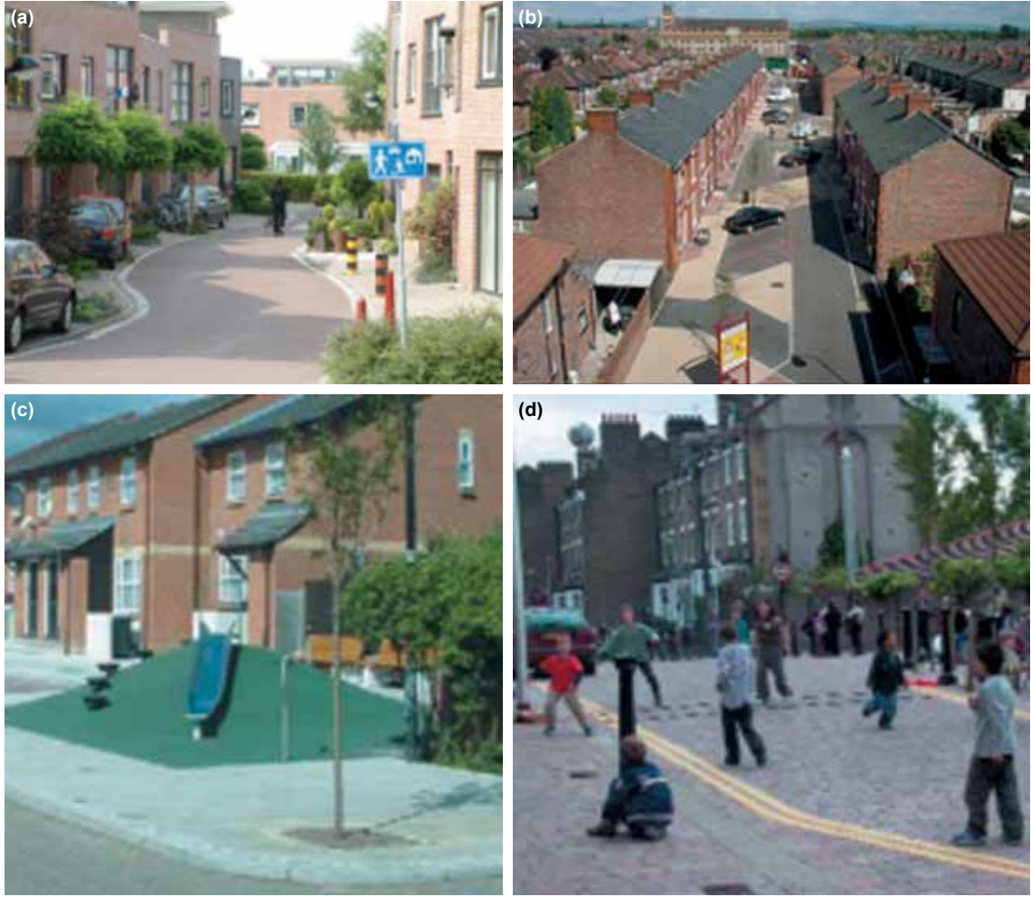
Şekil 1. (a) Bir Woonerf örneği (Rijswijk, Hollanda) (Url-1). (b) İngiltere'deki ilk "Home Zone" örneği (Stainer Street, Northmoor, Manchester) (Joseph Rowntree Foundation, 2007). (c) "Home Zone" olarak düzenlenmiş bir sokakta oyun alanı (DFT, 2005). (d) "Home Zone" olarak düzenlenmiş sokakta sokak oyunları (DFT, 2005).

çekici çevreler ve çocukların oyun gereksinimine cevap veren, çocuğu her türlü kötü olaylardan koruyan, çocukların bakış açılarını yansıtan ve çocukları aktif olarak eğitim sürecine katmayı amaçlayan mekanlar sunmayı amaçlayan bir girişim olarak uygulanmaktadır. (UNICEF, 2006). "Learning through Landscapes" girişimi ise okul bahçelerinin geliştirilmesi için başlatılmıştır. Bu okullarda güçlü bir eğitim müfredatı ve okul bahçelerinin kullanımına odaklanmış olan teneffüs ya da oyun zamanı eşdeğer olarak düşünülmektedir (Jeffrey and Woods, 2003).