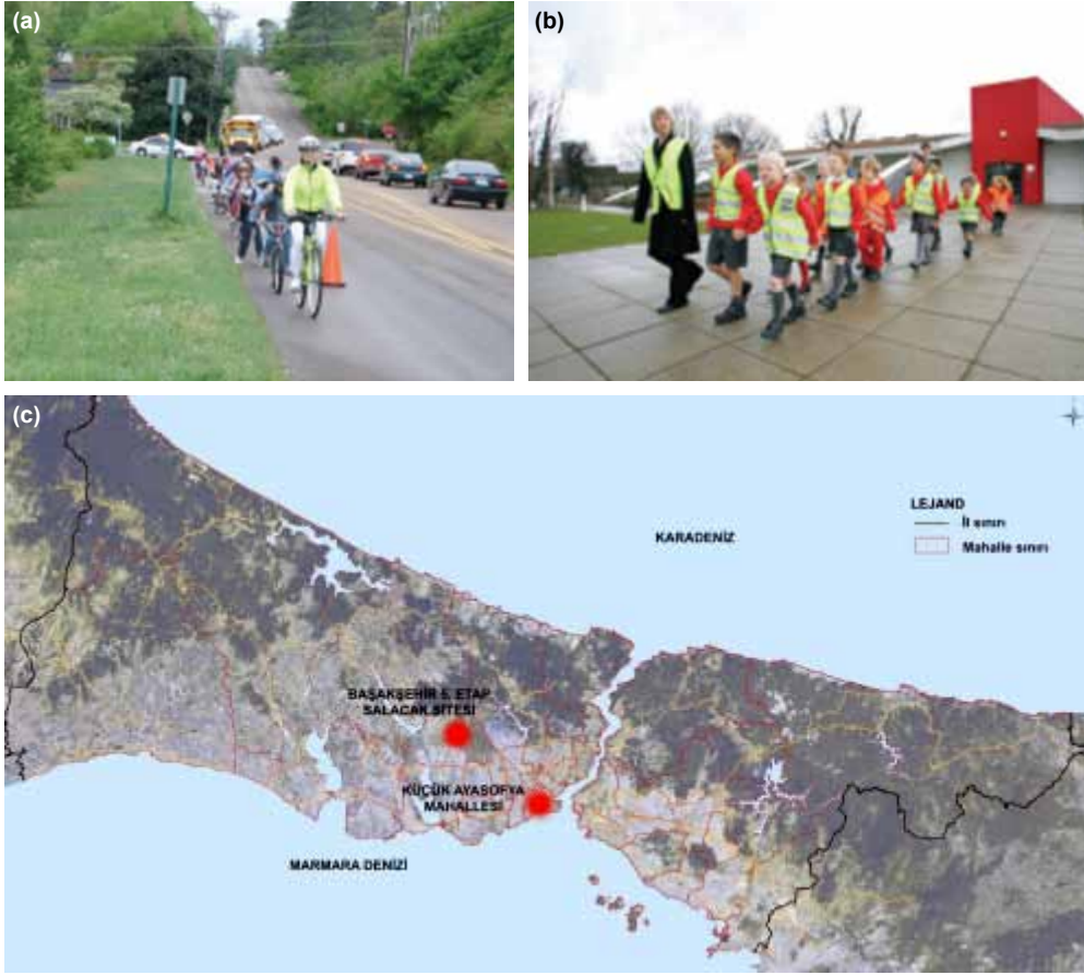
Şekil 2. (a) Safe Routes to School (Hamilton County, UK) (Url-2).url2. (b) Walking School Buses (Url-3).url3 (c) Alan araştırması için seçilen yerleşme alanlarının İstanbul içindeki yeri 2 .

Yoğun ve plansız yapılaşma nedeni ile kentsel alanlarda açık alanlar hızla azalmış, otomobil sahipliğinin artmasına bağlı olarak trafik yükünün artması kentsel alanı çocuklar için tehlikeli mekanlar haline getirmiştir. İstanbul çocuğun gereksinimleri ve isteklerine cevap vermemekte, çocuğa güvenli ortamlar sunmamaktadır.