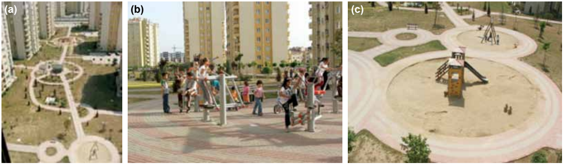
Şekil 4. (a) Başakşehir Kiptaş 5. Etap Salacak sitesi açık alanları. (b) Spor aletlerinin olduğu bir mekân ve çocuklar. (c) Site içindeki çocuk oyun alanı.

nut alanı seçilmiş, bu alanlarla ilgili gerekli bilgiler elde edilmiş, gözlem, fotoğraf çekimi vb. çalışmalar ile alana ait objektif veriler ortaya konmuştur. Bu alanlar Fatih İlçesi'ne bağlı kent merkezinde yer alan tarihi bir mahalle yerleşmesi olan Küçük Ayasofya Mahallesi ve bir toplu konut alanında yer alan Başakşehir İlçesi'ne bağlı Başakşehir Kiptaş 5. Etap Salacak Sitesi'dir. Çalışmanın ikinci bölümünde çalışma alanlarında yaşayan çocukların çoğunluğunun devam ettiği devlet okullarında ilköğretim dönemini kapsayan 7-14 yaş aralığındaki çocuklarla birer anket çalışması gerçekleştirilmiştir. Çocuklarla gerçekleştirilen anket çalışmasının amacı çocuğun fiziksel çevresine ilişkin beklenti, isteklerinin belirlenmesi ve alan araştırması için seçilmiş olan bu yerleşme alanında çocuğun mekânsal sorunlarının çocuk gözünden ortaya konmasıdır.