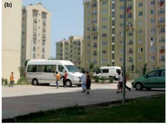
Şekil 5. (a) Otoparkta bisiklet süren çocuklar. (b) Otoparkta futbol oynayan çocuklar.

Çalışma alanından ikincisi Küçük Ayasofya Mahallesi'dir (Şekil 2c). Yerleşme sosyo-ekonomik olarak alt gelir seviyesine, düşük eğitim düzeyine sahip insanların yaşadığı, kırdan kente göç eden insanların İstanbul'da ilk yerleştikleri ilk alanlardan biri olan, bir geçiş alanıdır.