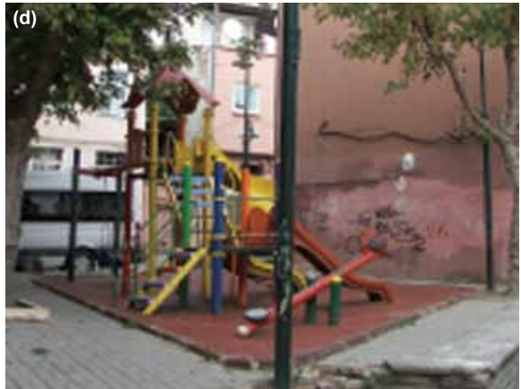
Şekil 6. (a) Kadirga İlköğretim Okulu bahçesi. (b) Küçük Medrese Parkı. (c) 23 Nisan Parkı. (d) Çayıröğlü Sokak üzerindeki çocuk oyun alanı.