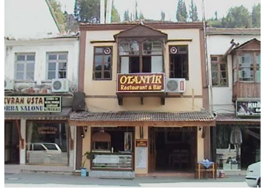
Resim 14. Eski yapıların yeniden değerlendirilmesi, Fethiye

Mevcut atıl yapıların yeniden işlevlendirilerek turizm sektörüne kazandırılması, çevreci turistin beklentisini karşılayacak düzeyde görsel ve kültürel çeşitlilik yaratmakta ve arzın daha az yapılaşmasını sağlamaktadır (Resim 14,15).