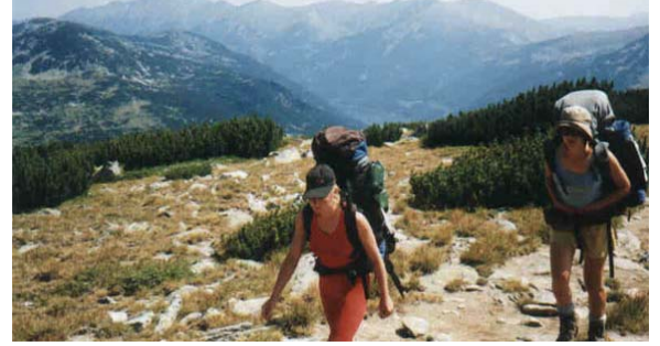
Resim 1. Dağ Yürüyüşü ( küçük ölçek, bireysel planlama, ön hazırlık, uzman destek)