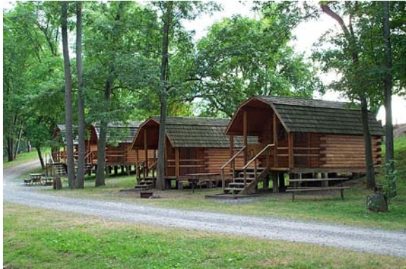
Resim 13. Doğayla uyumlu kamping konaklama birimleri

Mevcut atıl yapıların yeniden işlevlendirilerek turizm sektörüne kazandırılması, çevreci turistin beklentisini karşılayacak düzeyde görsel ve kültürel çeşitlilik yaratmakta ve arzın daha az yapılaşmasını sağlamaktadır (Resim 14,15).