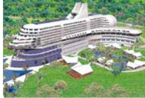
Resim 9. Antalya kıyılarında concorde uçak temalı otel

şekilde önceden planlanması anlayışına dayanmasıdır [3].