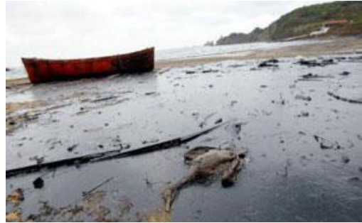
Resim 17. Doğal Çevrede Kirlilik

Alternatif turizm arayışlarının temelinde kitle turizmine karşı oluşan tepkiler ve çevreci sivil toplum örgütlerinin toplulukları kaynakların yok olması konusunda uyararak, bilinçlendirmesi yatmaktadır. Bu gerekçelerle oluşan ekolojik turizmin mevcut doğal kaynakları koruyarak ve yeni yaşam alanları geliştirerek tür kayıplarını engelleyeceği, katı-sıvı atıkları dönüştürerek, ayrıştırarak yeniden kullanılacağı, su kaynaklarının kullanımını optimumda tutacağı, kıyı ve ormanlık alanlarda sınırlı alanda sınırlı eylemler planlayacağı öngörülmektedir. Bu yüzden doğal çevre üzerindeki olumsuz etkilerinin yüksek maliyetler gerektirmeksizin tolere edilebilir düzeylerde olacağı veya hiç olmayacağı söylenebilir [14].