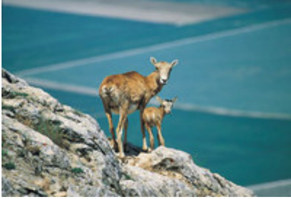
Resim 5. Yaban Hayatı Gözlemi

Bu turist gittiği yerlerde kendi çevresine benzeyeni değil, yöreye özgü olanı aramaktadır. Amaç değişik uygarlıkları tanımak, kültür varlıklarını anlamak, farklı iklim koşullarını yaşamak ve doğada doğayla uyumlu sportif etkinlikler gerçekleştirmektir [10], (Resim 5,6,7).