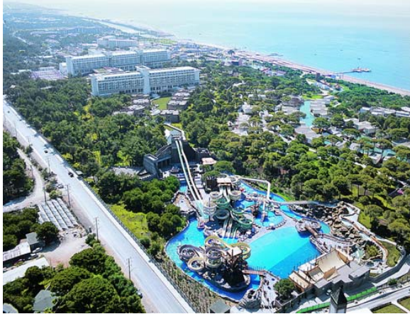
Resim 8. Kitle turizminin hakim olduğu Antalya, Belek kıyılarındaki tatil köyü ve otellerin yerleşme dokusu görünümü

Yatırımcıların ve tur operatörlerinin kısa sürede (7-15 günlük konaklama süresi) yüksek kar beklentilerinin, turistlerin düşük maliyetli standart konaklama kalitesi, mekânda aşinalık ve güven isteğiyle birleşmesi, kitle turizminin hedeflerine uygun olarak, kıyı ve kırsal mekanlarda büyük alanlara yayılan tatil köyü ve 4-5 yıldızlı otel gibi mega komplekslerden oluşan bir turizm mimarlığı oluşturmuştur [3], (Resim 8).