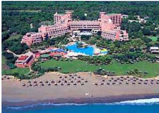
Resim 11. Belek kıyılarında uluslararası üslupta otel

Sonuç olarak tablo 3'de belirtilen mimari karakteristikler kitle turizmi mimarisinin belirleyicisi olmaktadır. Kitle turizmi mimarisi, kıyı mekânlarını görsel ve mekânsal çeşitlilikten uzak, yerel kimlik ve niteliklerden yoksun, yöre mimarisini ve yapım sistemlerini göz ardı eden, yaygın karakterli