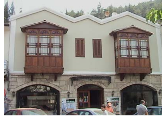
Resim 15. Eski yapıların yeniden değerlendirilmesi, Fethiye

Yeni yapılaşmalar için geçmiş kültürlerin yaşama ve mekâna dair verilerini saptamak ve bunları özümseyerek taklide ulaşılmayacak ölçüde tasarımlara aktarmak önemlidir. Ancak bu yorum yeni bir akım olarak gelişen temalı oteller veya kitsch kavramlarına varan sonuçları doğurmamalıdır [2], (Resim 9,10).