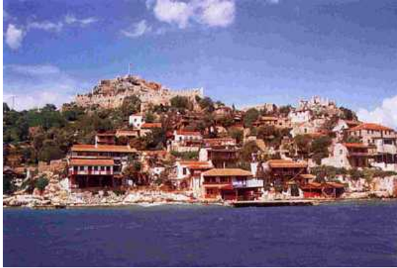
Resim 12. Ekolojik turizm yerleşmesine bir örnek, Kaş-Kekova/ Kaleköy

Çevreci turist profilinin çevreye duyarlı, maceracı bir ruha sahip olması, kendi başına dolaşma, halk içinde halkla birlikte genel yaşam standartları içinde konaklama isteği, doğayla bütünleşen ancak onun taşıma kapasitelerini zorlamayan, yöresel mimariyle uyumlu ve saygılı bir planlamayı ve yapılaşmayı öngörmektedir (Resim 12). Bu da pansiyon, butik otel, hostel, apart otel, oberj, motel gibi küçük ölçekli konaklama yapılarını kapsamaktadır [2], (Resim 13).