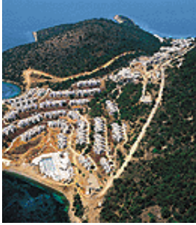
Resim 18. Kıyı mekânı üzerinde bir tatil köyü inşası

Kitle turizmi yer aldığı yapılı çevre üzerinde öncelikle arazi kullanımlarının değişimine neden olmaktadır. Tarım arazileri, zeytinlikler ve bakir koylar yoğun turistik yapılaşmaya açılarak yeni yerleşmeler oluşturulmaktadır. Korunması gerekli özgün kentsel alanlar yeni mega konaklama yapılarıyla zedelenmektedir. Bina kullanımları da değişmekte birincil konutlar ikincil konut, pansiyon veya otel olabilmektedir [14].