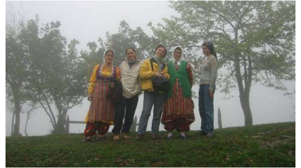
Resim 2. Yerel kültürle etkileşim (dil-kültür öğrenimi, yerel girişimci hizmeti)