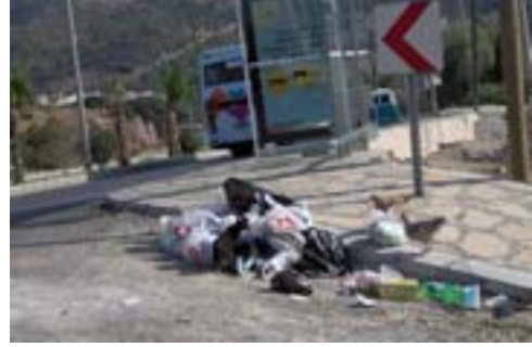
Resim 16. Kentsel Çevrede Kirlilik

çevreyi olumsuz etkileyen bu sorunlar kitle turizminin yoğun tüketimlerinin gerçekleştiği alanların temel sorunlarıdır. Bu yüzden kitle turizminin gelişiminin durdurulması veya yavaşlatılması ve kayıpların geri kazanımının planlanması gerekmektedir. Geri kazanımların çok yüksek maliyetler gerektirmesi ayrı bir finansman sorunu yaratacaktır.