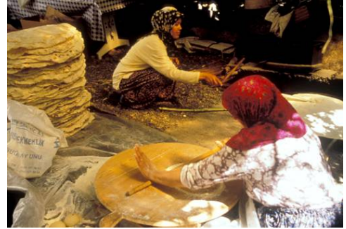
Resim 7. Yerel Girişimci ile kültürel etkileşim