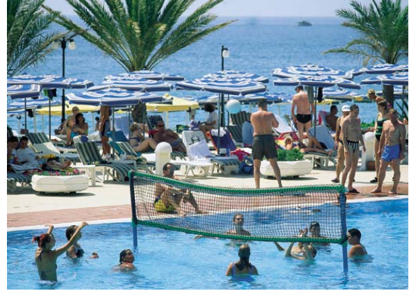
Resim 4. Bilindik Sportif Etkinlikler

2. Bireysel Kitle Turisti : Organize kitle turistin özelliklerini taşımakla birlikte, gittiği yöredeki yeniliklere biraz daha açık bir turist profilinden söz edilmektedir.