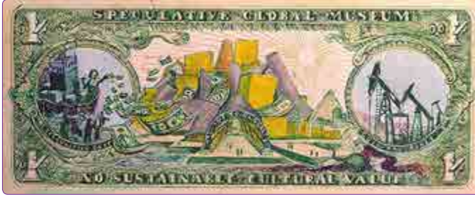
Şekil 2. Dramatik kültürel yatırımlara dikkat çeken Global Ultra Luxury Faction aktivist grubunun hazırladığı görsel. 41

gücü değerlendirerek sivrilen bir avuç yıldız mimarın “post-fordizm dönemi çılgınlığı” kentsel dönüşümün büyücüleri haline geldiğini ifade etmektedir. Mimarın neredeyse bütün işlevlerinden arınmış ve esas kaygısı spekülasyon emlak piyasasını tırmandırmak olan yapılar tasarlayarak yarattığı değer artışının altını çizmektedir. 40 Böylece tasarım da, çok başarılı bir sabotaj mekanizması olarak sisteme dahil olmaktadır. Burada sabote edilen değişim değeri yaratma gayesiyle, sağladığı gerçek toplumsal faydalardan ve kullanım değerinden başarısını ve gücünü alan mekanların üretimi olmaktadır. Kullanıcılarına, inşaatında ve işletmesinde çalışanlara, ait olduğu mahalleye, topluma, çevreye kazandırdıklarıyla yani kullanım değeriyle kendine bir yer edinmesi gereken mimari; spekülasyon, arz talep dengesine göre her an farklılık gösteren, yatırımcının gözünden hesap edilen değişim değeri yaratma kaygısıyla, kışkırtıcı, seksi, baştan çıkarıcı tasarımlarla; herhangi bir olumsuz tepki çekmek ya da direnç oluşturmak bir yana; hem gidilip kullanılmasa dahi daha fazla ilgiye erişmiş; hem de patronajı dışındaki paydaşlara fayda sağlama zorunluluğundan da özgürleştirilmiştir (Şekil 2).