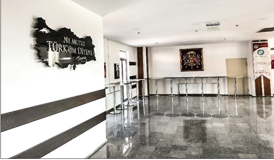
Şekil 2. Etimesgut Korkut Ata Kültür Merkezi.