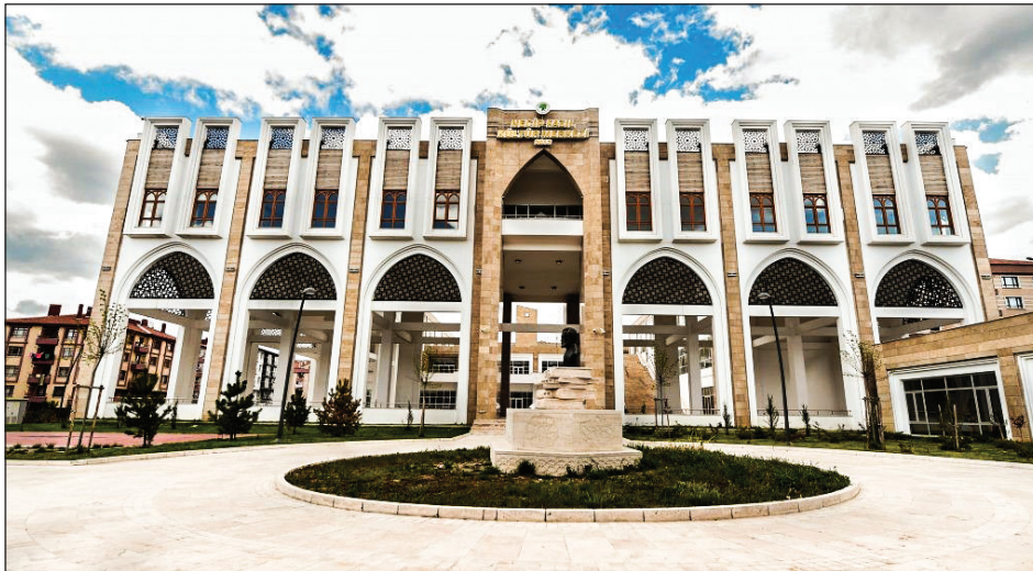
Şekil 5. Necip Fazıl Kültür Merkezi (Mamak).