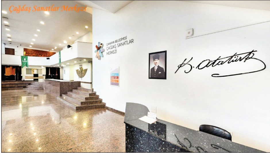
Şekil 4. Çagdas Sanatlar Kültür Merkezi (Çankaya).

İsimlendirme pratiklerinin sadece bir çağırma eylemi olmadığı aynı zamanda bir anlam yükleme ve yaşama dair bir politik (ve dolayısıyla ideolojik) çerçeve çizme faaliyeti de olduğu belirlenmiştir. Kültür merkezlerinin isimleri orada gerçekleştirilecek faaliyetler üzerinde de belirleyici kodlar üretmektedir. Zira kültür merkezine isim veren yapısal eksenli süreçler ve tercihler, kültür merkezi faaliyetlerinin belirlenmesinde de aynı yaklaşımı benimsemektedir.