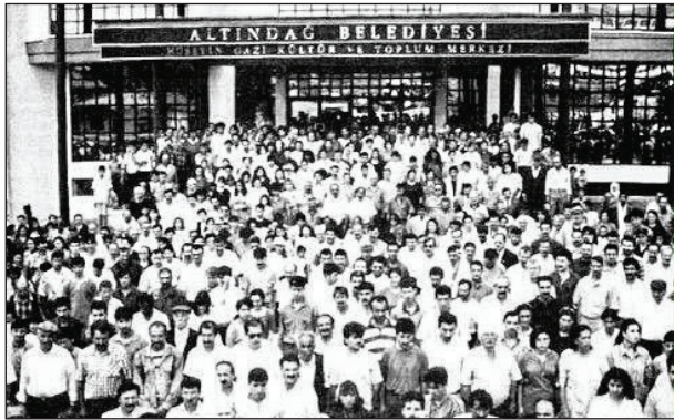
Şekil 1. Altındağ’daki Hüseyin Gazi Kültür Merkezi (eski adı Uğur Mumcu Kültür Merkezi) isim değişikliğinin protesto edilmesi, 6 Ağustos 1994.

Bu isimlendirme bazen toplumun çoğunluğu tarafından kabul görülürken bazen de anlaşmazlıkların ve tartışmaların