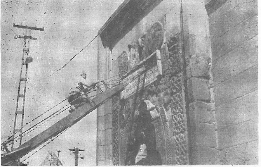
Resim 1 : Burada Şifaiyyenin kapısında, elektrik merdiveni üzerinden yapılan, gözenek resimleri üzerindeki çalışmalar görülmektedir. Resimde görüldüğü gibi, çekilen gözenek resimlerinden, taş üzerindeki Murç izlerini fotoğraf ile tesbit etmek imkanımız olmuştur.