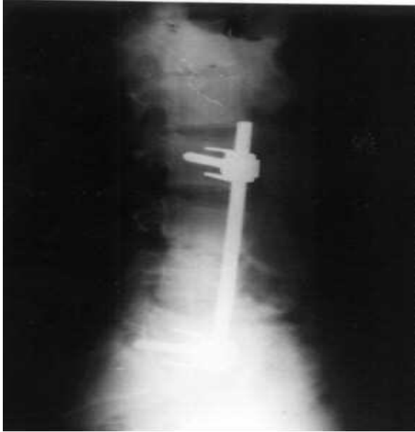
Resim 5. 29 yaşındaki hastanın ameliyat sonrası yan radyografisi