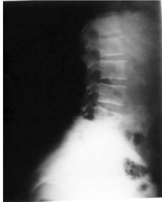
Resim 2. 29 yaşındaki hastanın ameliyat öncesi yan radyografisi