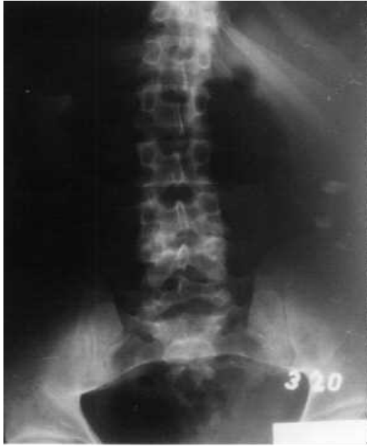
Resim 1. 29 yaşındaki hastanın ameliyat öncesi A-P radyografisi