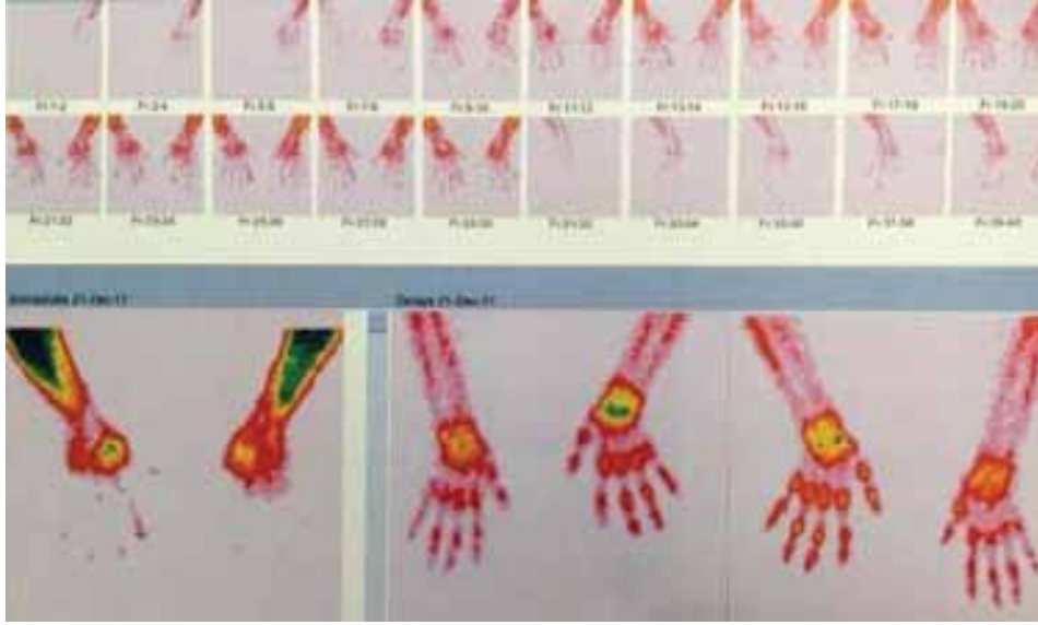
Şekil 2. Sol elde geç fazda periartiküler artmış aktivite tutulumu.