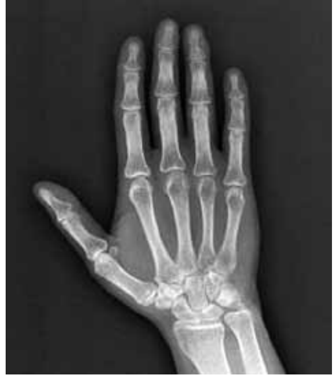
Şekil 1. Periartiküler osteopeni.

Kırk altı yaşında kadın hasta sol elinde şişlik, ağrı, hareket kısıtlılığı şikayetiyle kliniğimize başvurdu. Dört ay önce sol el dördüncü parmak distal falanks kırığı öyküsü mevcuttu. İki hafta atele alınan hastanın iki ay sonra yanıcı tarzda ağrı, şişlik, hareket kısıtlılığı şikayetleri başlamış. Hastanın şikayetleri NSAİD'leri kullanmasına rağmen devam etmiş. Hastanın muayenesinde sol el şiş ve hiperemikti. Isı artışı yoktu. Sol el bileği, MKP ve PIP eklem hareket açıklığı kısıtlı ve ağrılıydı. Sistemik ve nörolojik muayenesi normaldi. Hastanın hemogram, sedimentasyon, rutin biyokimya ve idrar incelemesi normaldi. Radyolojik incelemede sol el-el bileği grafisinde periartiküler osteopeni ve yumuşak doku şişliği mevcuttu. Eklem aralığı normaldi (Şekil 1). PA akciğer grafisi normaldi. Üç fazlı kemik sintigrafisinde periartiküler artmış aktivite tutulumu izlendi (Şekil 2). Bu bulgularla dördüncü parmak distal falanks kırığına bağlı gelişen KBAS tip 1 tanısı kondu. Hastaya 200 IU nasal kalsitonin, 1200 mg/gün gabapentin, kalsiyum 1000 mg/gün ve D3 vitamini 880 IU/gün başlandı. Fizyoterapi programı olarak retrograd ödem masajı, kontrast banyo, konvansiyonel TENS, kesikli Ultrason (1w/cm 2 ), desensitizasyon ve eklem hareket açıklığı egzersizi başlandı. Üç haftalık tedavi sonrasında hastanın şikayetlerinde belirgin azalma oldu. Hastaya gabapentin, kalsitonin, eklem hareket açıklığı egzersizi ve kontrast ban-